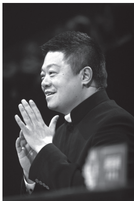
“差一分”的状态挺好的

高晓松：我告诉你，张朝阳本人来绝对写不了这么多字，因为我2000年的时候就是搜狐的艺术总监，我很了解他。