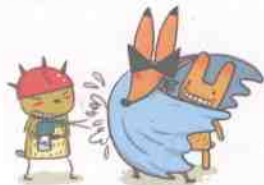
找来歇你的盖子, 保护你。