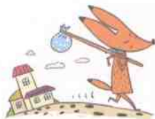
将脚印覆盖在地上就是旅行。