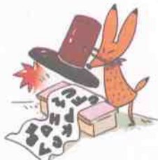
将文字覆盖在纸上, 就是报道事件。