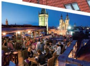
晚上的王子酒店 空中花园

走出广场，一路向北，就可以来到伏尔塔瓦河边的这座被誉为欧洲最美的古桥之一的查理大桥了。早在12世纪大桥就已经存在，1357年查理四世对桥进行了改造，从而得名“查理大桥”。桥的两端有两座高大宏伟的哥特式桥塔，这座长达520米的桥上每个桥墩之上都配有一组雕像，总共30座雕像都是捷克17、18世纪巴洛克艺术大师的作品。由于年代久远，现在的大部分雕塑都是复制品，原件被收藏在博物馆内而得到妥善保存。关于这座大桥还有一个美丽的传说——相传恋人们夕阳西下时在这座桥上拥吻，能得到一生的幸福。如果在这座桥上求爱或求婚，不仅成功率高，而且会天长地久。大家不妨一试哦！