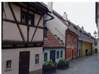
如童话世界般的黄金巷

卡夫卡这个名字对文学爱好者来说可谓如雷贯耳，那么你是否知道卡夫卡的故居就在这个布拉格城堡区一个叫做黄金巷（Golden Lane）的小胡同里呢？黄金巷得名于16世纪在此居住的诸多炼金师。这条小巷很窄很短，以鹅卵石铺路，路两边布满了色彩斑斓的小房子，房子的天花板都很矮，很容易就碰到头，给人一种进入童话世界的错觉。卡夫卡在这条小巷22号房子里生活过一