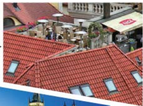
空中花园 白天的王子酒店

影片中安娜和本爬上了市政厅对面的王子饭店（Hotel U Prince）的屋顶，居高临下地观赏歌剧。这座五星级酒店在屋顶建有一个空中花园，在那里，你不但可以享受精美的食物，更可以将老城广场的美丽风光尽收眼底。白天和夜晚各有不同风情：白天，广场上行人熙熙攘攘，而你坐在安静的空中花园，享受着美食和咖啡带给你的这千金难买、远离尘嚣的悠闲时刻；晚上，在柔和的灯光下，微风徐徐，你可以尽情享受老城一天喧嚣过后的宁静安详，又是另一番美妙感受。