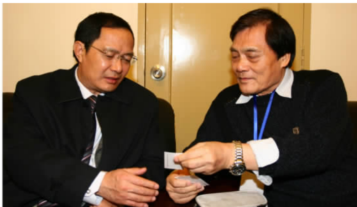
文化部副部长欧阳坚与作曲家金湘亲切交谈