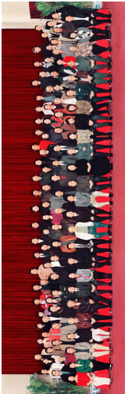
2008中国歌剧院论坛合影