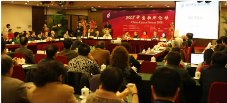
2008 中国歌剧论坛开幕式