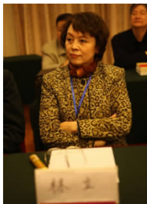
中国文联国内联络部部长林立