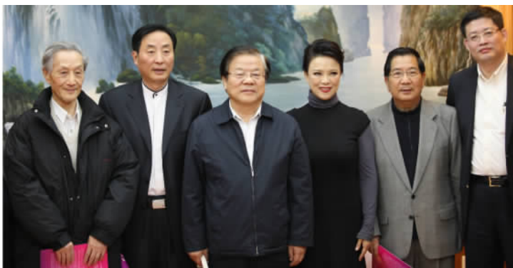
文化部部长蔡武与2008中国歌剧论坛组织者合影