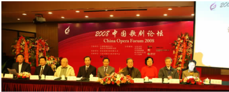
2008 中国歌剧论坛主席台

从左至右依次为中国歌剧研究会主席王祖皆, 北京大学新闻发言人赵为民, 著名词作家乔羽, 中国文联书记处书记廖奔, 文化部副部长欧阳坚, 著名诗人、剧作家贺敬之、著名歌剧表演艺术家王昆, 中国歌剧研究会名誉主席田川, 中国戏剧家协会副秘书长任卫红。