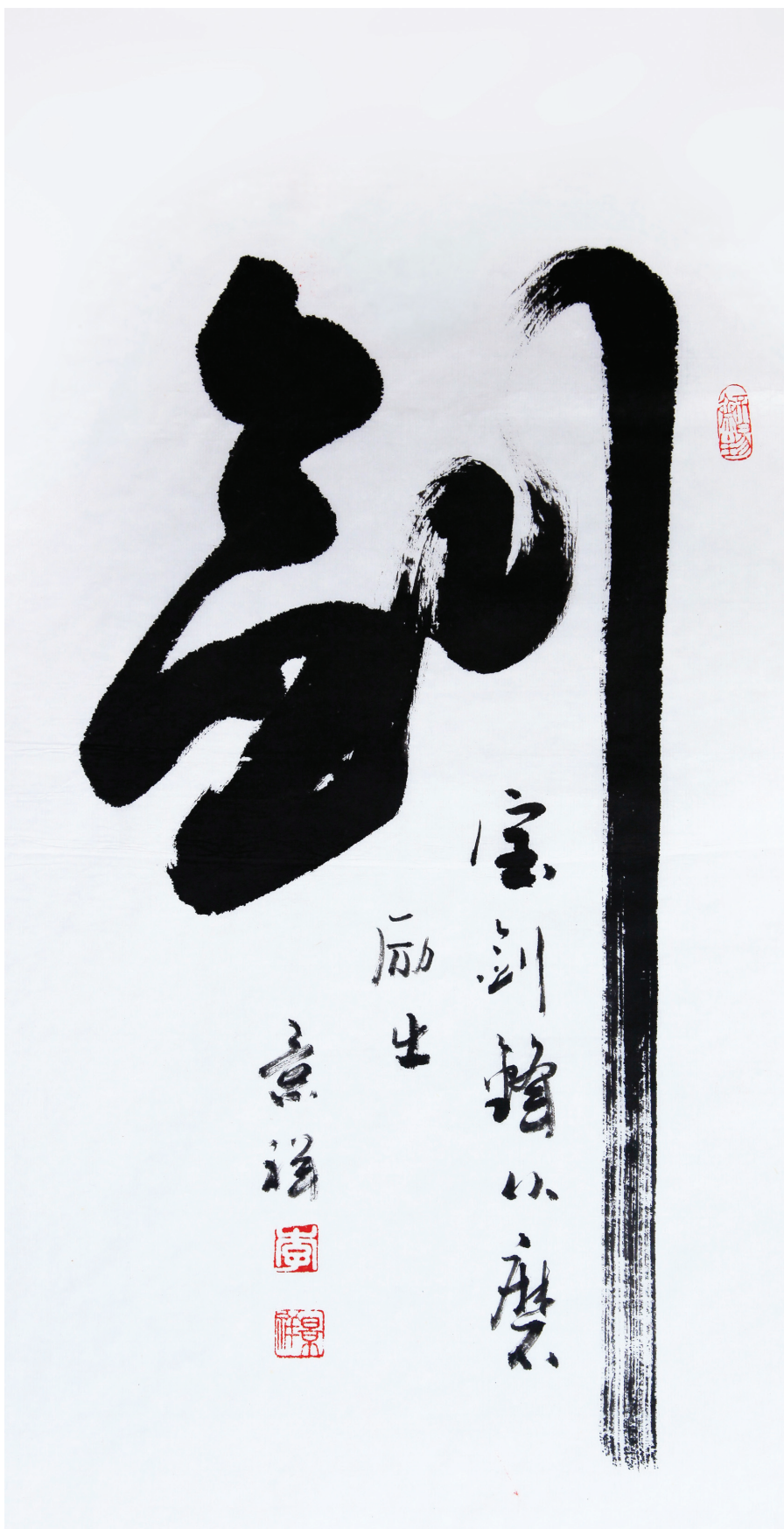
劍 寶劍鋒以磨 尺寸 31x68cm