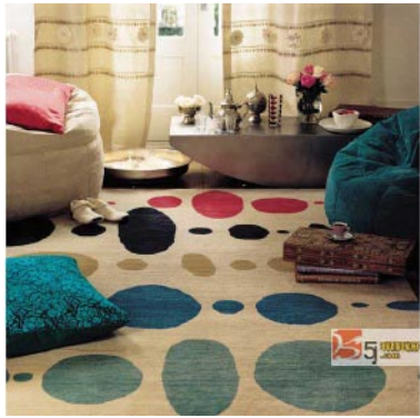
图1-1 地毯 http://www.5s5j.com/

(1) 地毯。地毯是室内铺地的一种，通过地毯上不同的装饰图案可以协调室内的整体风格。不同图案的地毯让居室风格各异，它往往成为室内的视觉中心。如花团锦簇的地毯样式，必定体现传统的、高贵典雅的风格；几何纹饰的地毯给人以庄重典雅而又不失活泼的感觉，用于光线较强的房间，可以使房间显得宽敞而富有情趣（见图1-1）。