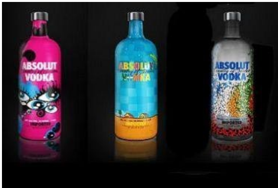
图1-13 瓶子的适合图案 http://www.sccnn.com/

图案在构图、造型、色彩、肌理等方面都追求装饰美感，形成了许多充满秩序美的程式化语言。如对称重复、二方连续、四方连续等骨骼的运用，适合图形的完形处理等装饰艺术语言（见图1-13）。