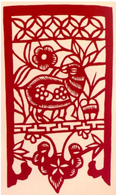
图1-14 剪纸作品 “喜上眉梢”

人们喜欢各种充满喜庆和吉祥等象征意义的图式，寻求情感的寄托。各个民族由于风土人情和兴趣爱好的不同，对美好事物的愿望和联想也各不相同（见图1-14）。