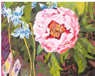
图1-6 植物图案 李江 指导教师秦娅娜