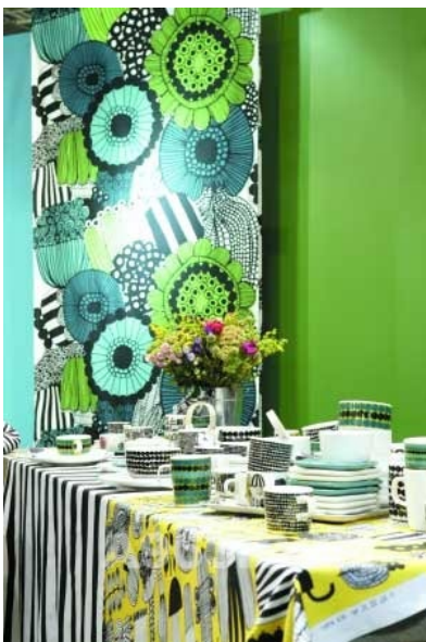
图1-3 墙面