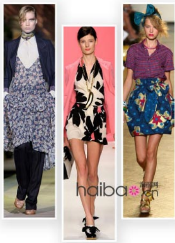
图1-4 印花图案在服装中的应用 http://www.haibao.cn