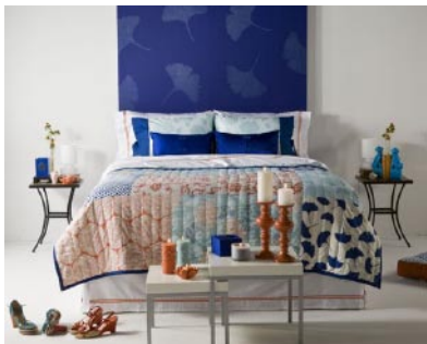
图1-2 家具 http://cs.jiaju.sina.com.cn

图案在设计过程中，可从不同的角度出发进行构思，因看问题的角度标准不同，分类的方法很多。