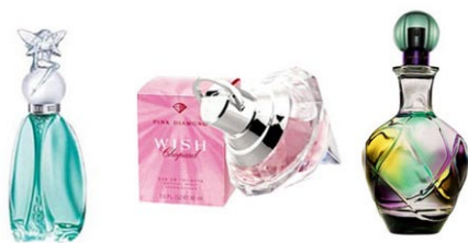
图1-9 立体图案 http://www.haibao.cn

图案设计分为平面装饰和立体装饰两大类。平面装饰图案设计是在二维空间进行设计并应用图案表现,如广告招贴图案、染织服饰图案、书籍装帧图案、建筑平面装饰材料等。立体装饰图案设计是在三维空间进行设计并应用到装饰物表面具有空间效果的图案表现,如陶瓷器物、工艺金属制品、雕刻玉石制品、家具造型设计、服装设计、工业用品外观造型等(见图1-9)。