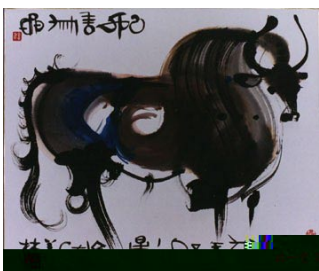
图1-5 动物图案 韩美林