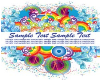
图1-7 几何图案 http://www.sccn.com/