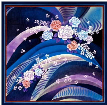
图1-11 独立纹样图案 胡媛

在艺术中,常常看到一些奇异的、自然界中没有的景象,如四季同景、花中套动物、龙凤翱翔等超越时空的画面,通过艺术的处理,体现出人们对美好生活的追求,提高了人的审美情趣和生活乐趣(见图1-12)。