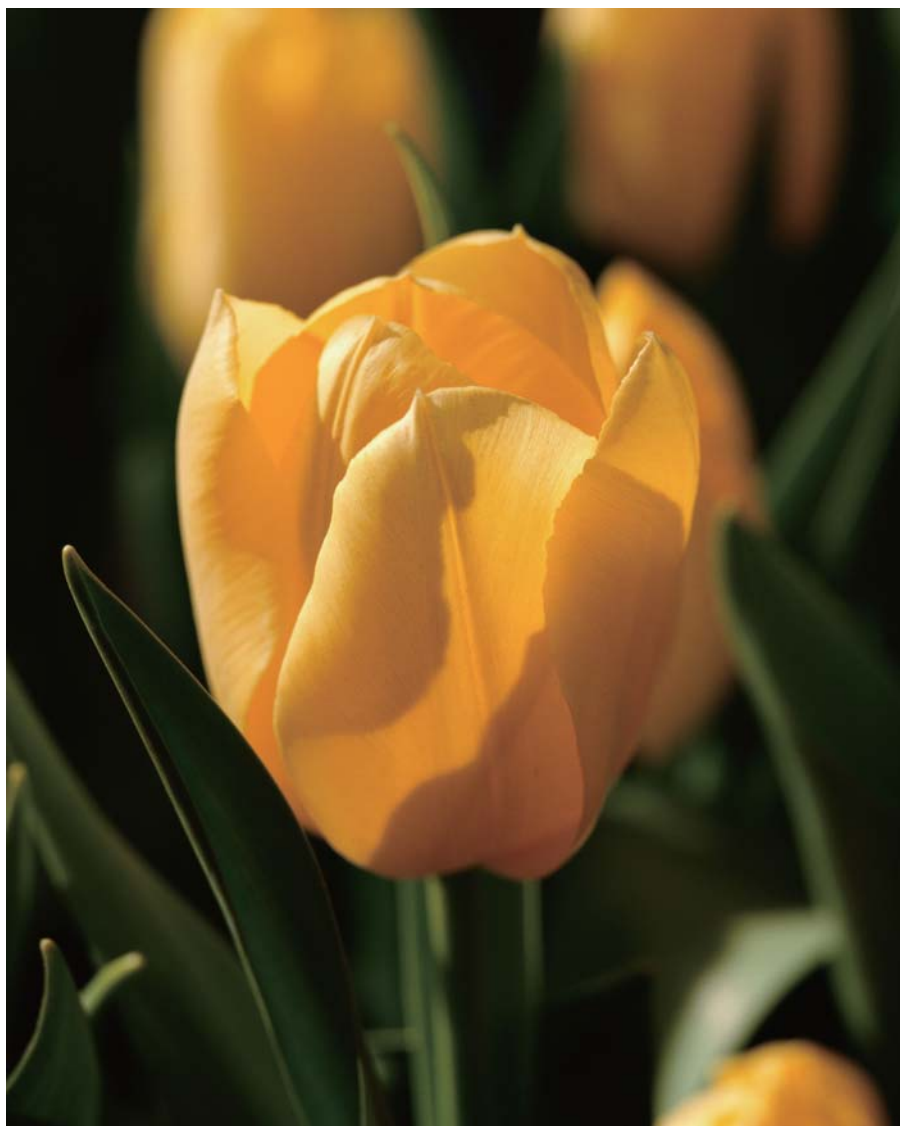
含苞待放的花蕾在直射光的照射下，显得蠢蠢欲动。

色彩是一种视觉现象。人们之所以可以看清物体以及各种缤纷的色彩，是因为光线照射到物体上，再由物体对光线进行反射或透射之后，刺激人们的视觉而形成的。当光线和物体反射或透射的情况发生改变，也会引起色彩的变化。