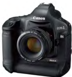
专业级：佳能EOS-1Ds Mark III

专业级数码单反相机集各自品牌的最新最优技术于一体，几乎拥有职业摄影师所需要的所有功能。此类单反相机采用各种坚固耐用的材质，全金属外壳，最高达30万次的快门寿命，惊人的画质，高速的反应速度，系统功能的高度集成化，以及卓越的防水、防尘功能，可以应对任何复杂困难的拍摄环境。同时，专业级数码单反相机还拥有更为准确的多点双十字对焦系统，可以应付高速对焦操作。适合职业摄影师、记者使用。