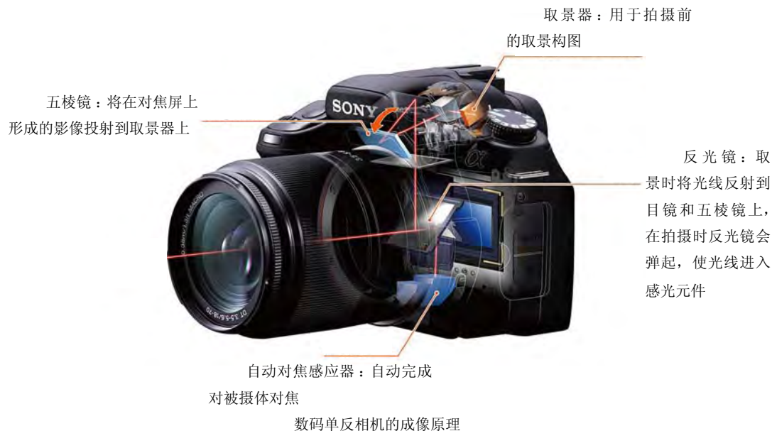
数码单反相机的成像原理