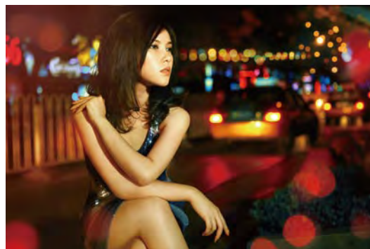
专业级数码单反相机的优秀画质，色彩还原真实准确

光圈：F2.8 快门速度：1/60 s 感光度：ISO2500 焦距：54 mm