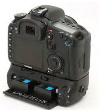
数码单反相机上的功能按键

虽然数码单反相机的自动拍摄功能越来越强大，但在实际拍摄过程中客观环境会产生很多变化，为了追求完美的画面效果，在某些情况下会要求数码单反相机同时具有手动调节的功能，供拍摄者根据拍摄环境进行适当调节。因此，便捷的操控性能也是数码单反相机专业性能的重要体现。普通数码相机由于机身体积较小，很多功能都只能在菜单中设置，操作起来比较烦琐，而数码单反相机由于机身体积较大，大多数常用的功能都可以通过功能按钮来实现，为拍摄带来了很大方便。