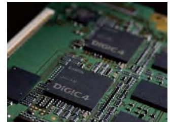
佳能DIGIC4数字信号处理器