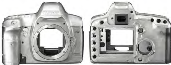
中高端数码单反相机机身通常为铝镁合金，轻巧且坚固