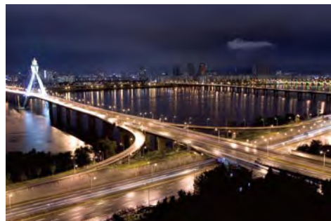
准专业级数码单反相机的成像质量