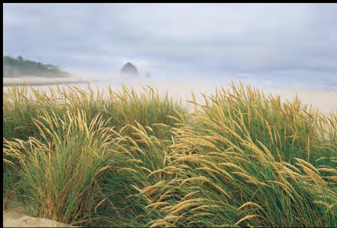
数码单反相机的优秀画质