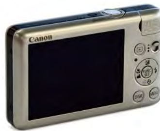
普通数码相机的按键较少，很多都只能在菜单中设置