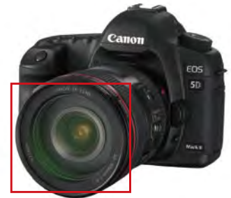
数码单反相机的镜头