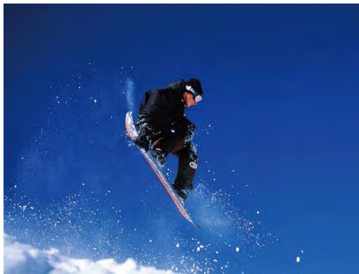
高速快门抓住每一个精彩瞬间

普通数码相机一般都会有快门时滞较长的缺点。相对于普通数码相机，响应速度快是数码单反相机的突出优势。它的开机速度快、快门反应迅速、快速而准确的对焦系统，能够帮助摄影者抓住每一个精彩的瞬间。由于其对焦系统独立于成像器件之外，因此快门时滞较短，它们基本可以实现和传统单反一样的响应速度，尤其在新闻、体育摄影中更是深有体会。除此之外，高端数码单反相机有 1/8000\text{ s} 的快门速度及每秒数十张连拍速度，完全可以媲美传统胶片相机，足以实现对精彩瞬间的抓拍，且精准度非常高。