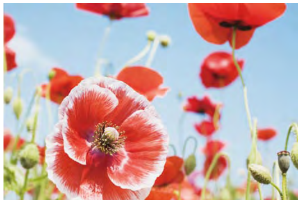
初级数码单反相机，质感与颜色都很不错

打开包装盒以后，作为纸质资料的说明书及保修卡同样是鉴别行货、水货的依据，正规的行货都采用中文印刷的说明书，有的相机还配备几本分别采用中文、英文等不同语言印刷的说明书。而水货往往不具有中文说明书，或是繁体中文的说明书，即使具备，也并非行货原配的说明书，纸张及印刷质量都比较差，一般很容易就可以看得出来。另外，保修卡上列有详细的规定和维修记录等详细项目，同时还列有各个城市指定维修点的维修卡及加盖合法保修印章。