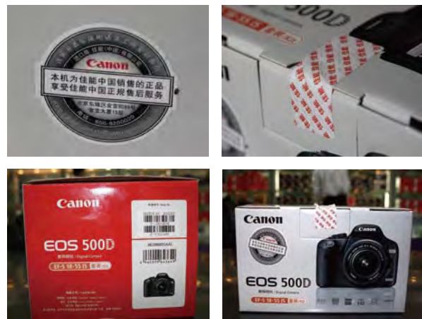
正规行货包装盒细节图

光圈：F2.8 快门速度：1/640 s 感光度：ISO100 焦距：34 mm