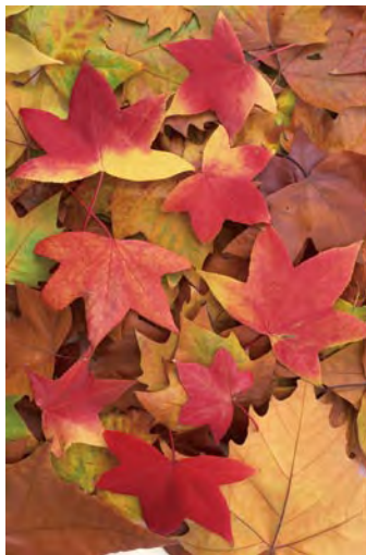
画面色彩与质感都有不错的还原