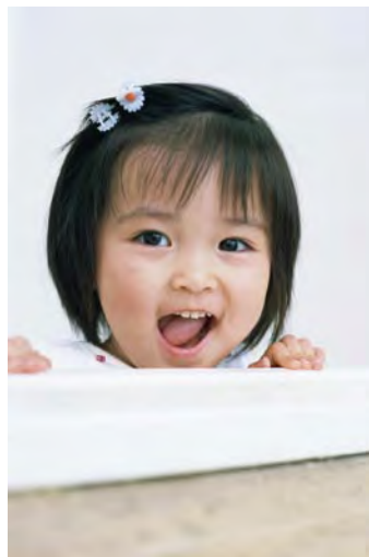
入门级相机拍摄宝宝生活照

光圈：F2.8 快门速度：1/400 s 感光度：ISO100 焦距：40 mm