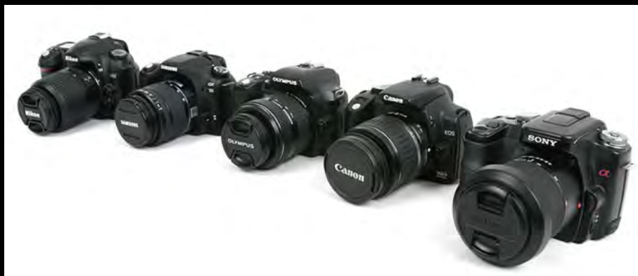
常见的数码单反相机品牌，从左到右依次为：尼康、三星、奥林巴斯、佳能、索尼