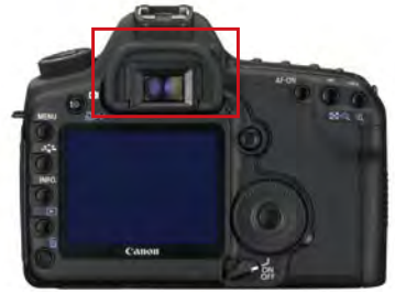
数码单反相机的取景器

目前市场上的数码单反相机，入门级的最为丰富。几乎各大品牌，包括佳能、尼康、索尼、宾得等都有自己的入门级相机。这类产品的外观时尚精致，功能适用且摄影中所用到的功能几乎都具备，像素也毫不亚于专业相机。但缺乏良好的操控手感，扎实的用料做工，以及高速连拍和最快的快门速度等功能。这类相机适合摄影初学者、中老年摄影爱好者、学生等，此外，由于其体积较小便于把握，也一定程度地受到女性消费者的欢迎。