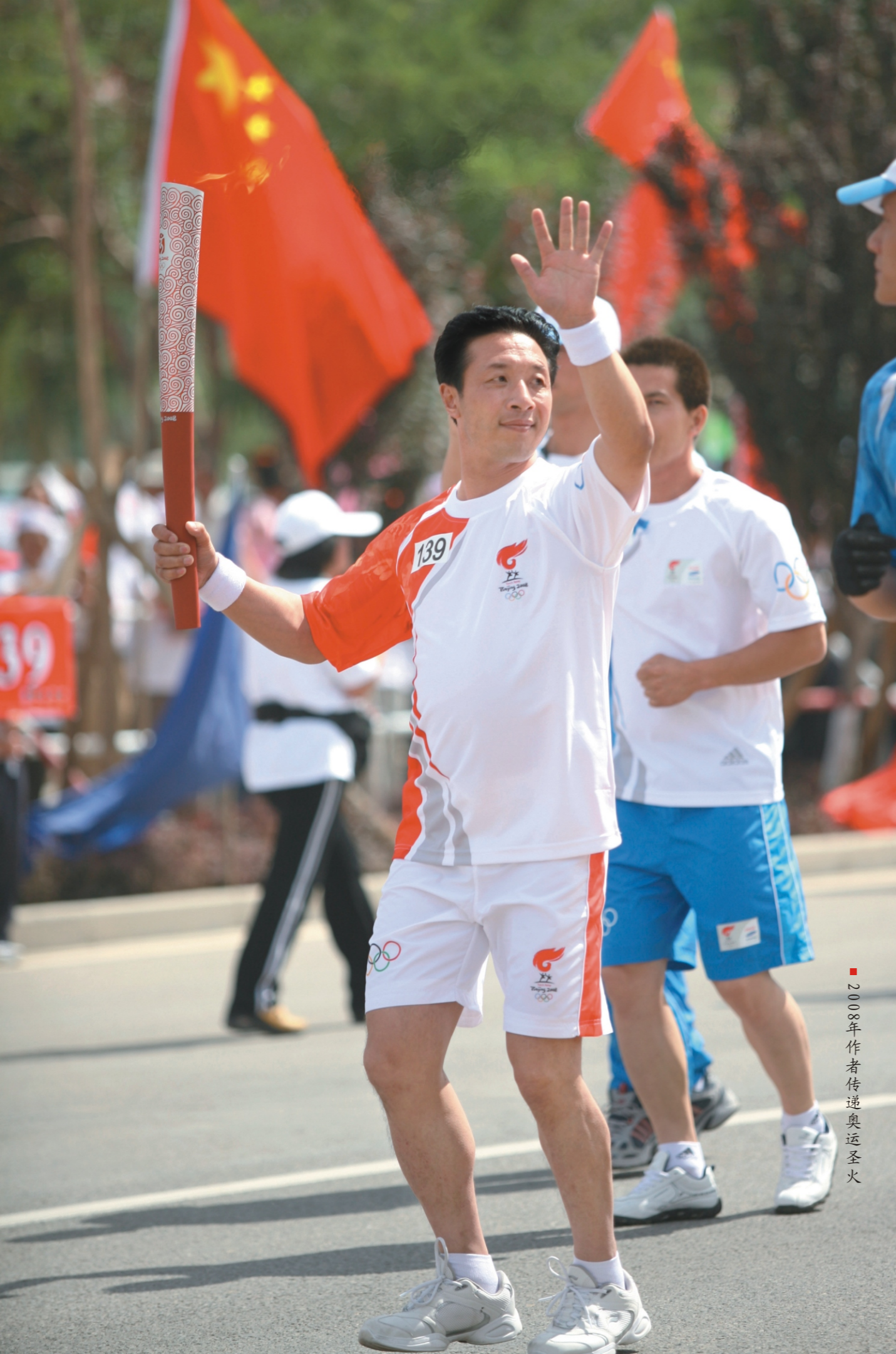
■ 2008年作者传递奥运圣火