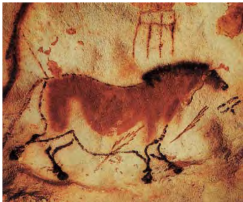
图1.10 法国拉斯科洞穴壁画

在西方，从公元前15000年拉斯科岩洞壁画时期至信息时代的今天，人类应用色彩来表达已有几千年的历史，色彩一直具有无可替代的重要意义。具有强烈色彩感觉的古罗马墙面和拜占庭多种彩饰镶嵌的精细工艺，在色彩领域中一直呈现出高超的装饰风格。人类制作颜料是从炙烤动物肉时流出的油与某些泥土的偶然混合开始的，逐渐发展为以蛋清、蜡、亚麻油、树胶、酪素和丙烯聚合剂等作颜料结合剂。从文艺复兴时代开始，艺术家们开始不断探索新的色彩材料，凡·爱克兄弟等人在“油—胶粉画法”的基础上改进而形成了亚麻油等调制的油画颜料，为油画的产生提供了媒介材料。尽管如此，独立意义上的科学的色彩学研究却晚于透视学、艺术解剖学而到近代才开始，自此，绘画上色彩表现的手段大为丰富。