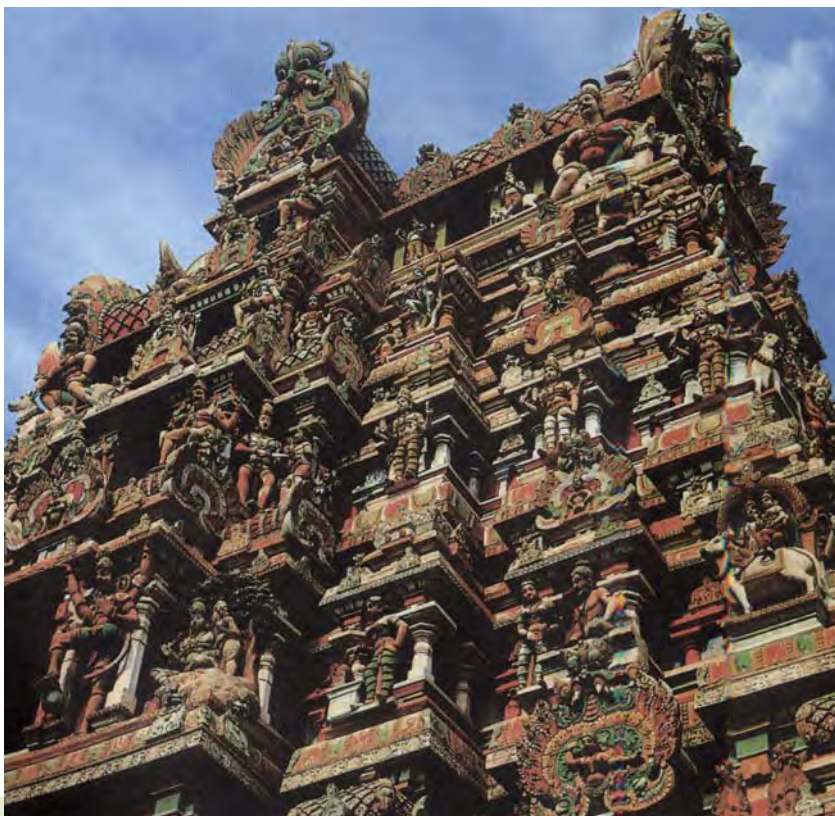
图1.13 印度米纳克神庙 应用红绿色对比的构成营造出全然不同的印象，呈现出一种清新、活泼、典雅、瑰丽的风韵