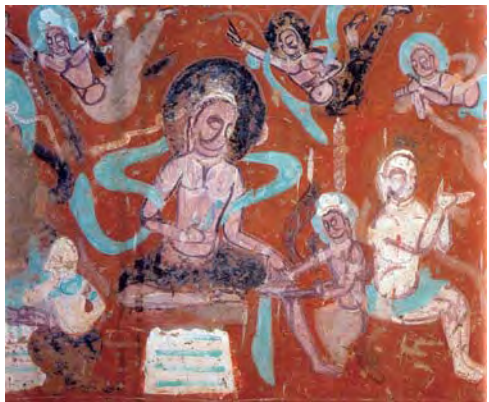
图1.3 尸毗王割肉贸鸽敦煌莫高窟等275窟壁画