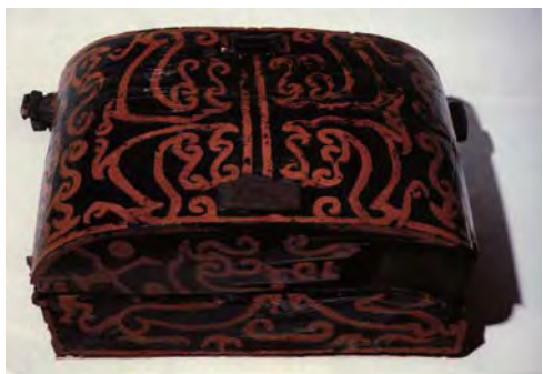
图1.2 《衣箱》曾侯乙墓出土 曾侯乙墓漆画，以朱、黑为主，色调鲜明、对比强烈。用色之道与粗犷的神韵，丰富的幻想，相互配合，相得益彰