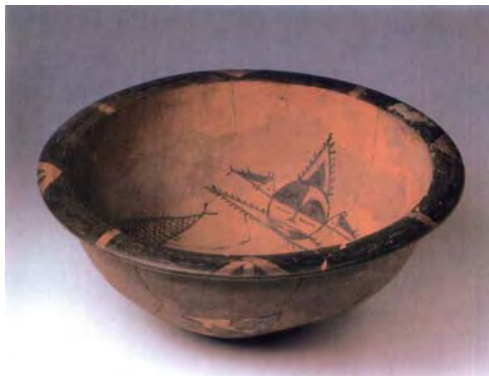
图1.1 人面鱼纹彩陶盆 仰韶文化 西安半坡

以中国人为代表的东方人，擅长整体的、辩证的思维方式，重综合、归纳和感性的直觉与顿悟，强调有机的辩证统一和事物的普遍联系，主张矛盾的和谐。因此，形成了基于社会学和心理学的五行观的完备的感性色彩文化，它是以天人合一思想作为指导的。古代先民曾从自然万象有规律的色彩变换中获得了五种基本色相，即青、赤、黄、白、黑，并体会到这五种色与当时人的生产、生活实践有着这样或那样的利害关系。因此，古代先民将这五种色确定为正色，其他色定为间色；正色代表正统的地位，五色被视作特定观念的指代。后又随着阴阳五行学说的产生与发展，色彩文化渗透到哲学领域，给中国古代哲学披上了彩色外衣，五色与五行（水、火、木、金、土）、五方（北、南、东、西、中）、五时（冬、夏、春、秋、长夏）、五性（智、礼、仁、义、信）、五声（呻、笑、呼、哭、歌）、五态（恐、喜、怒、忧、思）、五气（寒、热、风、燥、湿）成为构架世界秩序的整体系统。因此，在中国，色彩的视觉功能