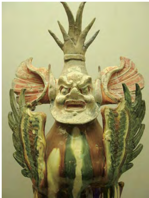
图1.5 唐三彩 造型生动逼真，色泽艳丽，富有生活气息