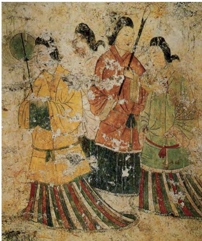
图1.12 高松冢古墓壁画 以岩石为主要颜料的日本画基础在此萌芽

19世纪，由于光学理论和实践的发展以及摄影技术的日益成熟，一些有关色彩理论的科学论述为欧洲艺术家探索新的绘画表现奠定了理论基础，严重地动摇了一向视模仿自然色彩为全部目的的传统绘画信念。在色彩艺术发展史上，印象派是一个重要的里程碑。印象派画家把色彩从自然中抽象出来，按照色彩自身的法则来表现自然规律，跨出了探索艺术纯粹性的第一步，带来了整个艺术观的改变，如印象派画家莫奈等人致力于大自然中环境与光线的研究，大胆地抛弃了传统的古典主义绘画的棕褐色调，采用鲜明的色彩和笔触进行户外写生创作。在印象派画家那里，色彩还是依附于具象的物体之上，而后期印象派画家，如凡·高等反对科学和客观的力量，他们在绘画中加入了自己的主观成分。新印象派修拉、西涅克等人在研究光学和色彩学新理论的基础上，发明了用难以数计的小色点为基本语汇的“点彩画法”。现代热抽象绘画的始祖康定斯基则比印象派画家更大胆地反叛了传统，在康定斯基的作品中，已见不到传统绘画中的具象物体，色彩已不再依附于任何具体的物象而存在，他使色彩从绘画中独立出来并体现每种颜色的恰当价值。冷抽象的代表人物蒙特里安只用三原色构成画面，探索色彩的抽象表现形式——几何构成。色彩的发展促进了视觉艺术从19世纪向20世纪多元化时代的转变。