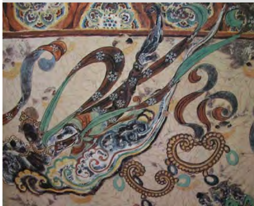
图1.4 敦煌莫高窟壁画飞天纹（盛唐）

即使如此，中国古代也出现了色彩鲜明的艺术品，如通过敦煌莫高窟壁画的色彩可以感受到古代民间艺术家用色的豪放与大气；唐三彩更是以华贵斑斓的色彩乐章和典雅丰满的造型特点创造出中国古代造型的艺术典范；五代、南北朝时期的宫廷绘画富丽堂皇；中国宋代的瓷器因五大名窑各自的特色形成了五种不同的色彩风格。这些艺术品体现了劳动人民质朴生活的情感，凝聚着劳动人民富于生命力的美学特色，看似极其简单明了的色彩却表现出各种不同的意境和民族风格。