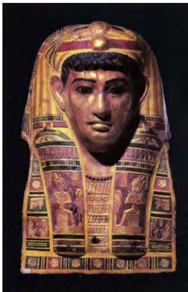
图1.15 埃及男子木乃伊面具