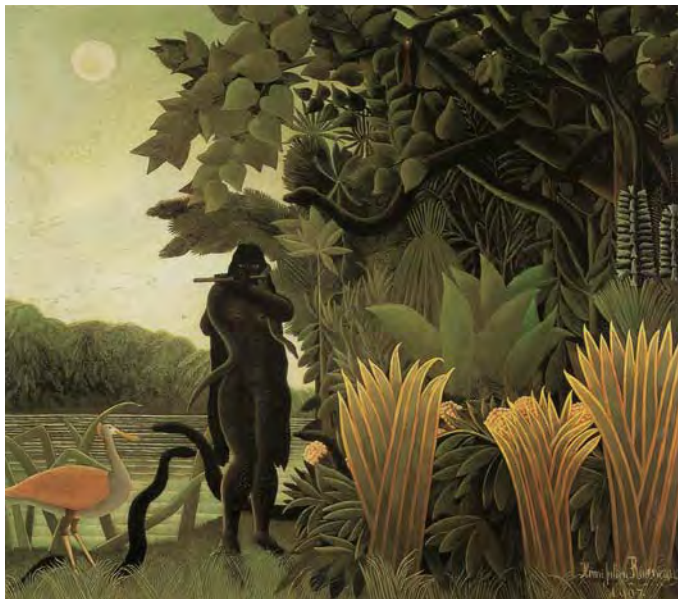
图1.16 《弄蛇的女郎》亨利·卢梭（法）光与色的敏锐直觉把画面中所有不协调的部分填满，让我们有一种惊讶的感觉——惊讶于自然世界的如此亲切、如此贴近

色彩学理论的研究，与文明的历史一样悠久。古希腊时代的科学家、思想家们就已经开始了对光与色的探索，并且创立了自己的色彩观，亚里士多德第一次提出了“光就是色”的理论。文艺复兴时期，色彩学与透视学、艺用解剖学一起成为美术的基础理论。由于形与色是美术形象的基本外貌要素，因此，色彩学的研究及应用便成为美术理论首要的、基本的课题。17世纪60年代，科学家牛顿通过著名的“日光一棱镜折射实验”得出白光是由不同颜色光线混合而成的结论之后，颜色的本质才被纳入科学探索的主流领域，从而逐渐得到正确的解释。由开普勒奠定的近代实验光学为色彩学的产生提供了科学基础。感知心理的研究为解决色彩视觉的问题，心理物理学的方法为解决视觉机制对光的反映的问题，都提供了重要的前提条件。印象派出现之后遇到的外光描绘、色彩并置对比、互补色等问题，促使理论家、艺术家运用科学方法探讨色彩产生、接受及应用的规律。到19世纪下半叶，色彩学研究的专门著作开始出现，如薛夫鲁尔的《色彩和谐与对比的原则》（1854）、贝佐尔德的《色彩理论》（1876）等。进入20世纪，色彩学更是在现代光学、心理物理学、神经生理学、艺术心理学等基础上获得了长足进展。色彩学的产生与发展有赖于这些学科（尤其是光学）的长足进展，而色彩学研究的成果又为这些学科提供材料，推动它们的深入发展。