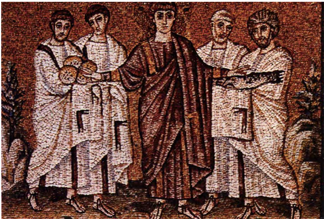
图1.11 面包和鱼的奇迹 圣阿波利奈尔·诺沃 巴雪利卡式教堂的镶嵌画 背景用金黄色的玻璃碎片铺成，平静安详的基督形象占据着画面的中心，体现出基督的永恒力量