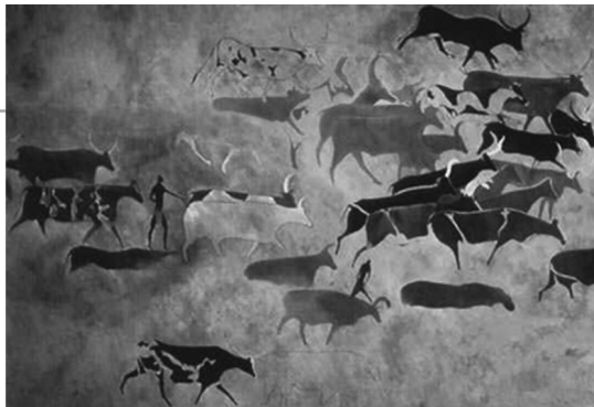
拉文特岩画中的野牛图

西班牙拉文特岩画不是画在洞窟的崖壁上，而是画在露天的石灰质山岩敞亮的地方或悬崖的下面以及岩阴处；岩画大多是彩绘，岩刻很少，颜色多用红色，黑色很少，白色几乎不用。颜料的来源是赤铁矿、褐铁矿、锰矿以及木炭。由于岩壁画大都是用赭石色绘制在灰色的岩面上，从远处即可见到。