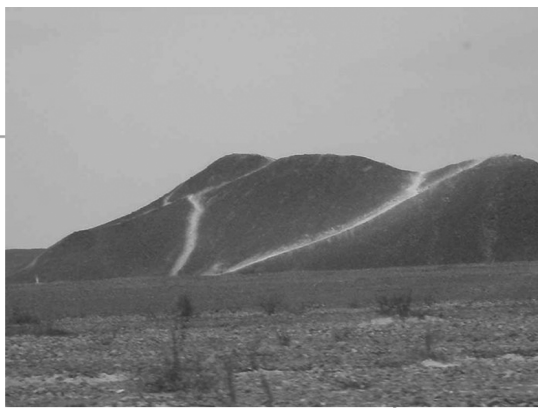
纳斯卡岩画的面积很大，站在地面上根本看不出来

纳斯卡岩画又称纳斯卡几何图形。它作于何年何月，出自何人之手，又是怎样创作出来的，至今还是一个尚未解开的谜。有意思的是，这种画站在地面上根本