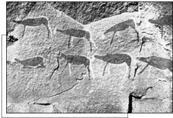
撒哈拉沙漠中野兽岩画

阿杰尔高原岩石图像，小自几厘米，大至6米。大多数彩色图像是用各种土色颜料绘制的，其中有褐色、红色、淡绿色和黄色，还有白色和天蓝色。图像一层一层地画在岩石上。有一些完整的场面在内容上毫无任何关系却彼此重叠，多达12层。