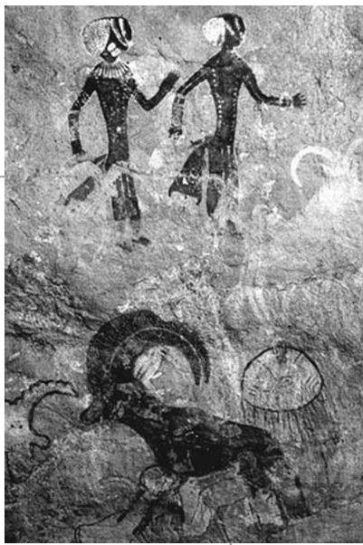
北欧岩画中人的形象

北欧地区在地理上接近北极，所以北欧岩画又有北极美术之称。大约在一万年前的中石器时代，地球气候显著变暖，北欧和北俄的冰河溶解。由于冰河溶解、海面上升和陆地隆起等原因，大不列颠岛等岛屿和欧洲大陆游离。气候的变化，性喜寒冷的驯鹿、猛犸等动物向北方转移。有的动物群迁移了，有的动物群灭绝了，迫使人类作如下三种选择：第一，随着动物群向北方迁徙；第二，转移到附近地方，靠捕获森林中的小动物以及贝类维持生活；第三，仍旧停留在原地，从事以采集和植物栽培为主的生活。第一部分人在斯堪的纳维亚