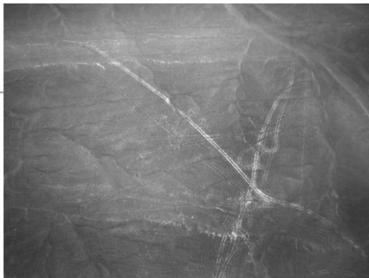
画在山谷中的纳斯卡岩画

在16世纪30年代，西班牙殖民者入侵秘鲁时曾到过这片神秘的谷地。他们乍一见到旷野上到处分布着宽窄深浅不一的“沟槽”，还以为是一些小路，便顺“路”而行，不料绕了一会儿就走不通了。他们又疑心那或许是灌溉水渠，却怎么也找不到一点儿水。这令他们大惑不解，最后只好带着诸多谜团憾然离去了。