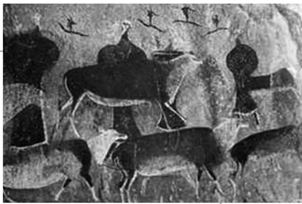
羚羊形象在南部非洲多色图像中极为常见

在漫长的岁月里，这些岩画层层覆盖，形成了很厚的颜色层。底下几层是用一种赭黄颜料画出来的动物侧面像。后来，岩画逐渐采用两种颜色作画，并出现了宏伟的场面和合乎透视规律的构图。大约从公元前2000年中期起，开始