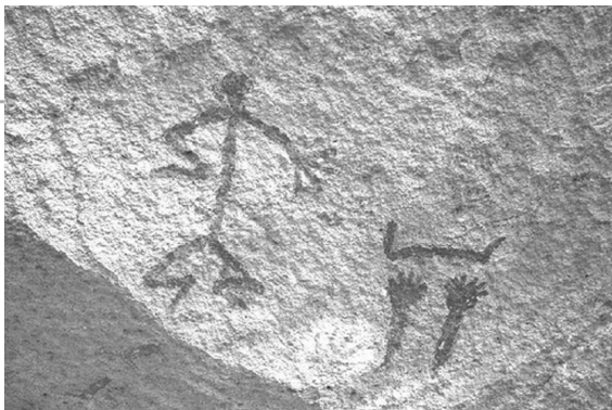
岩画中的简单符号

半岛创造了极北美术。他们从事与旧石器时代酷似的生活方式，以狩猎和渔捞为生；在文化方面保持着旧石器时代的文化传统，其样式是自然主义的。极北美术的岩画作品，几乎全部是岩刻，彩画很少；作品主题有驯鹿、麋、鹿、鲸、鲑、鱼、鸟、爬虫类