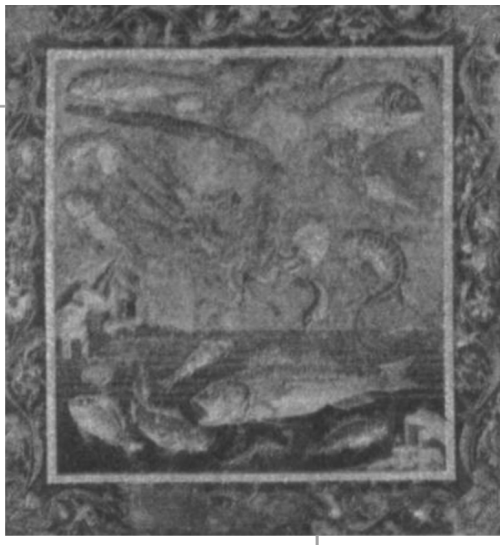
古罗马海洋生活的情景

许多年后，伴随着考古的挖掘，庞贝的面貌开始重新展现出来。它保留了古罗马的建筑装饰、工艺制品和大量壁画。这些壁画代表了古罗马绘画的成就。根据考古的勘测，这些壁画多绘制于公元前 2 世纪~公元 79 年，分为四种样式。