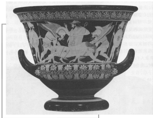
阿提卡红绘式瓶画

到了公元前 6 世纪初，古希腊的绘画就已经摆脱了东方艺术的影响，形成了有自己特色的壁画，并且产生了不少杰出的画家。有许多关于画家的故事流传了下来，其中一个是这样的：有两位古希腊画家举行绘画比赛，看谁的画更逼真。他们画好之后，都把作品挂在