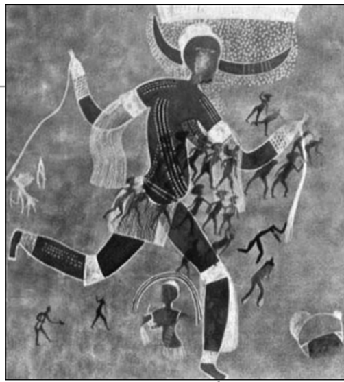
撒哈拉沙漠岩画中的双角女神

在撒哈拉南部和西部，普遍盛行牧养公牛时期最后阶段的艺术，仅在毛里塔尼亚和西撒哈拉就有 100 多处共 2000 多件石刻。这些石刻尽管数量众多，题材却很雷同，有些图像还有程式化的倾向。在这一辽阔地区的石刻中间，没有任何能够与费赞或阿杰尔高原古代水牛时期雄伟的岩画媲美的作品。在阿海奈特（阿尔及利亚境内）和霍加尔另有两个岩石艺术区域。阿海奈特石刻在特点、风格、技术和题材方面与撒