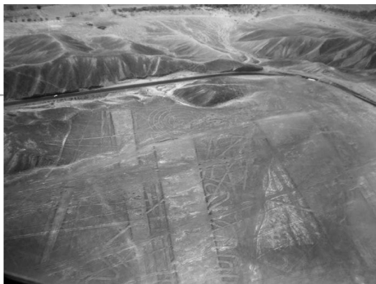
纳斯卡以粗线条著称

还有一个长 40 米的蜘蛛，圆肚、突眼、细腿、多足，栩栩如生，酷似真的蜘蛛。另有一个长 100 多米的猴子，足有一个足球场那么大，尾巴卷曲，神态活泼，顽皮可爱。特别引人注目的最大动物图案，是一只占地约 5 平方千米的展翅欲飞的大鹏鸟，光它的翅膀就有 50 米