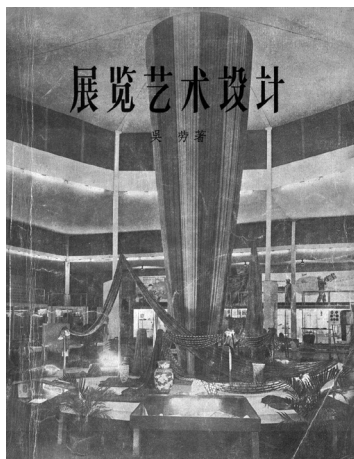
《展览艺术设计》，人民美术出版社，吴劳著，1958年

并在巴黎市立装饰美术学院学习家具设计、染织、陶瓷、金属工艺等。他在留学法国前，先在广东省立工业专门学校上学，受过金工、木工等技术训练。20世纪30年代曾两度赴德参观包豪斯的展览，比较推崇包豪斯思想，毕生关注艺术与技术的结合。