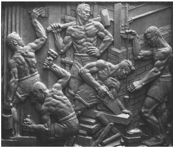
桂林光复纪念碑（局部），郑可设计，20世纪40年代

艺术特色，借鉴由鲁迅介绍到中国的墨西哥壁画与苏俄和德国版画，形成“至性在真”和“装饰得无可装饰便是拙”的装饰艺术观，立志做“新时代的民间艺人”。他的装饰不是纯形式，而是结合情感表达和强化自然的艺术手段。20世纪30—60年代，他作为《时代漫