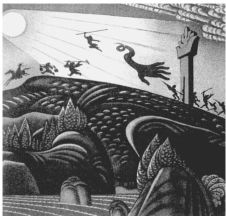
《西游漫记》，张光宇设计，1945年