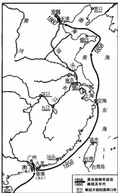
第二次鸦片战争形势图

十四年后的这一天，英法联军仍然把进攻的矛头指向了广州，这时的广州已经找不到一位叫林则徐的民族英雄了，反而多了一对贪生怕死的糊涂蛋，一个叫叶名