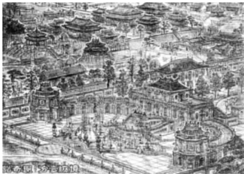
圆明园复原图(局部)

孩子们，你们永远无法想象当时的疯狂，就像饿狼突然发现了肥肉，尽量地拿，尽量地抢，每个人的腰间和口袋都是鼓鼓囊囊的，手上拎着，肩上扛着，可是很快他们就发现，这些是远远不够的，因为珍奇异宝实在是太多了，于是，他们开始在这宫殿里寻找箱子和丝绸，一箱一箱地、一包一包地背了出去。一连几天，他们