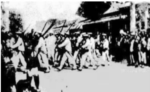
1860年10月英法联军在北京街头

身负重任的俄国公使假意劝架，来到了大沽口仔仔细细地绕了一圈，发现大沽口的侧面有一个地方没有防守，回去就把这重大的消息告诉了英法联军，还自告奋勇给他们带路，包抄了炮台，北京近在眼前了。惊慌失措的咸丰皇帝仓皇出逃，一口气逃