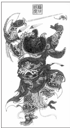
年画中的钟馗 陕西凤翔

画，因产于天津杨柳青镇而得名。始创于明崇祯年间，盛于清雍正、乾隆至光绪初。杨柳青木版年画并非全用套版印刷，而是风格独特的印绘结合，构图丰满，线刻细腻，手工染色艳丽。题材多为戏曲和神话故事以及表现世俗风情的仕女、胖娃娃等。年画中的“娃娃样”样式多达百种，“美人”题材成为特色品种。年节中，极适宜渲染、营