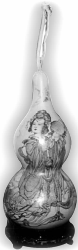
葫芦烙烫 麻姑献寿