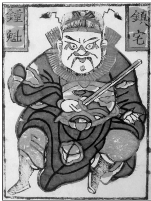
年画中的钟馗 天津杨柳青