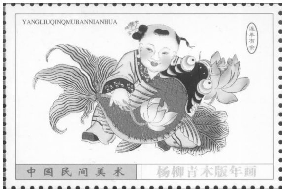
天津杨柳青木版年画

据《历代神仙通鉴》载:做了皇帝的李世民忽然疾病缠身,总觉得门外有鬼魅呼叫,扔砖掷瓦,夜不能寐。大将秦琼与尉迟恭便主动请命,持铜执金瓜在寝宫门外站岗,果然立奏奇效,李世民能安然就寝了。皇帝康复后觉得两员大将夜夜守护,未免太辛苦,就降旨命人画二人图像,分贴门板,这便是传为后世的“门神”画。