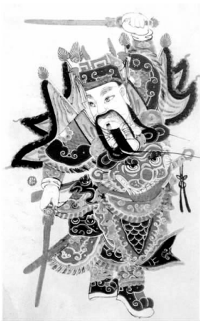
扬鞭铜门神(清) 四川绵竹