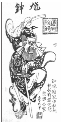
年画中的钟馗 河南朱仙镇