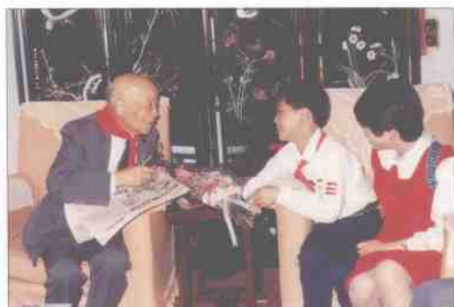
著名数学家苏步青欣然接受小记者采访。