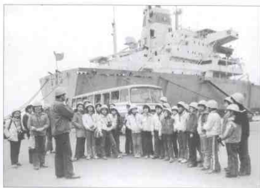
小记者组团采访宝钢码头。