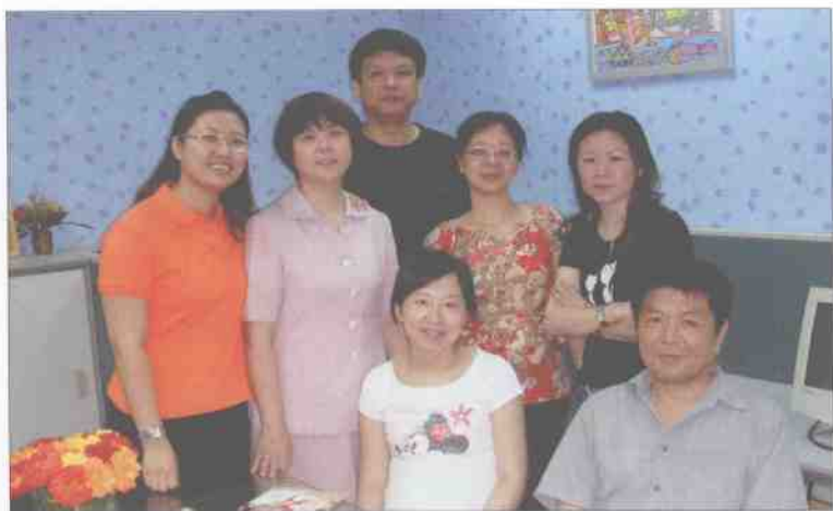
《时刻准备着》指导老师们在编辑部的合影。