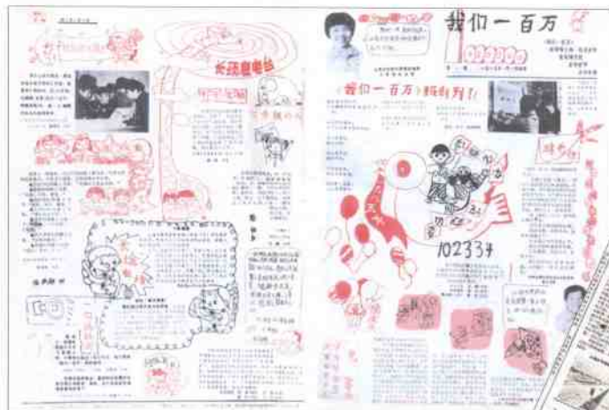
1985年1月1日《我们一百万》报创刊