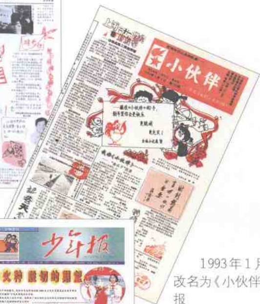
1993年1月改名为《小伙伴》报