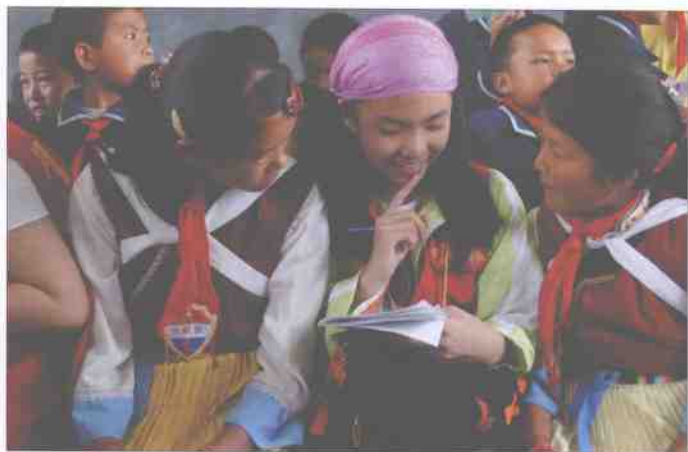
小记者赴云南省丽江市中海小学采访纳西族学生的学习生活。