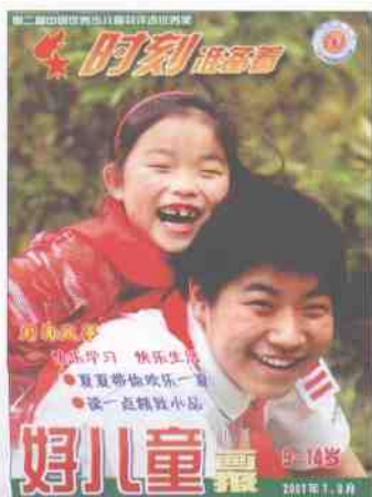
2005年1月改名为《时刻准备着》