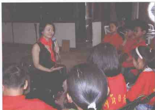
曾经的小主编、著名节目主持人秋林回“娘家”，热情辅导小记者。