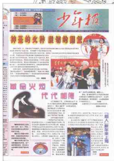
1999年9月改名为《少年报·小伙伴周刊》