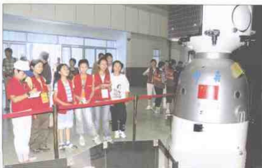
来自东海之滨的小记者来到了大西北的酒泉卫星发射基地。