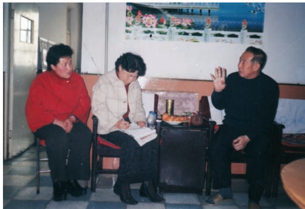
○2005年2月，作者（中）在右玉作民间文化调查