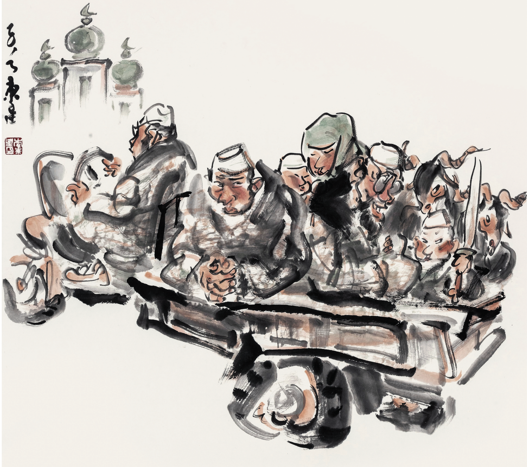
回乡集镇 68cm × 68cm