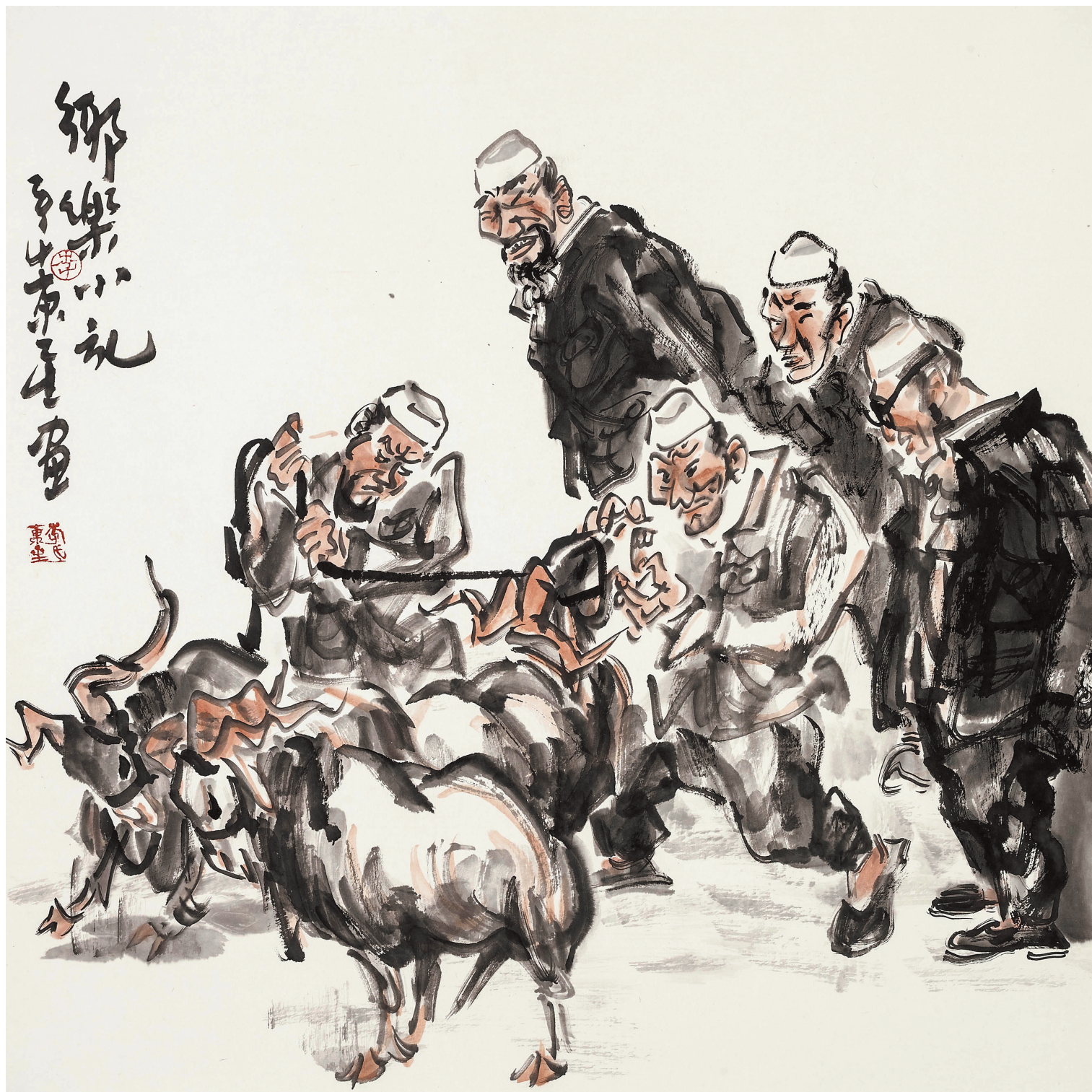
乡乐小记 68cm × 68cm