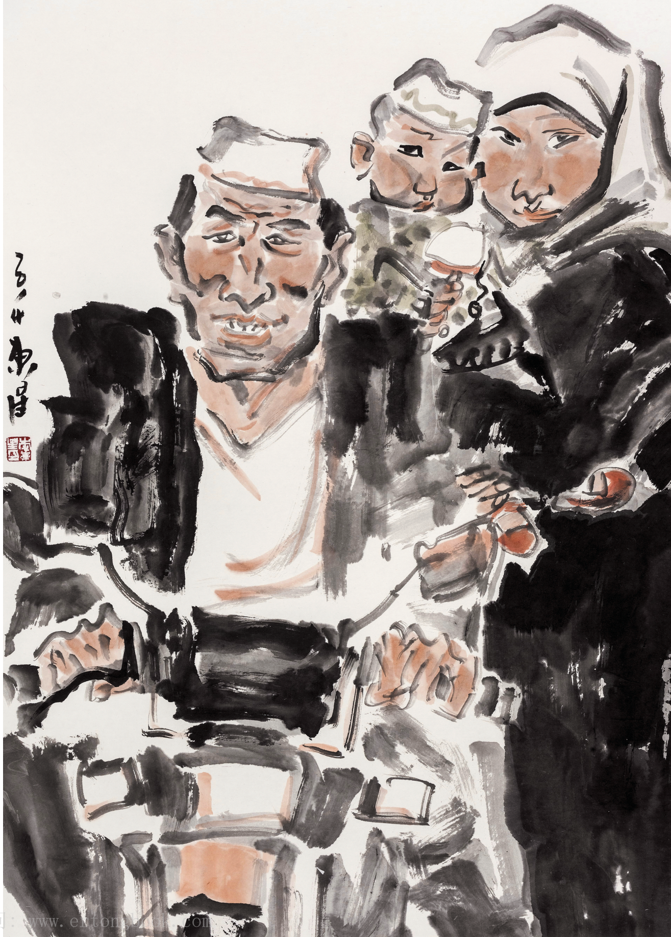
回乡风情 NO.03 90cm x 68cm