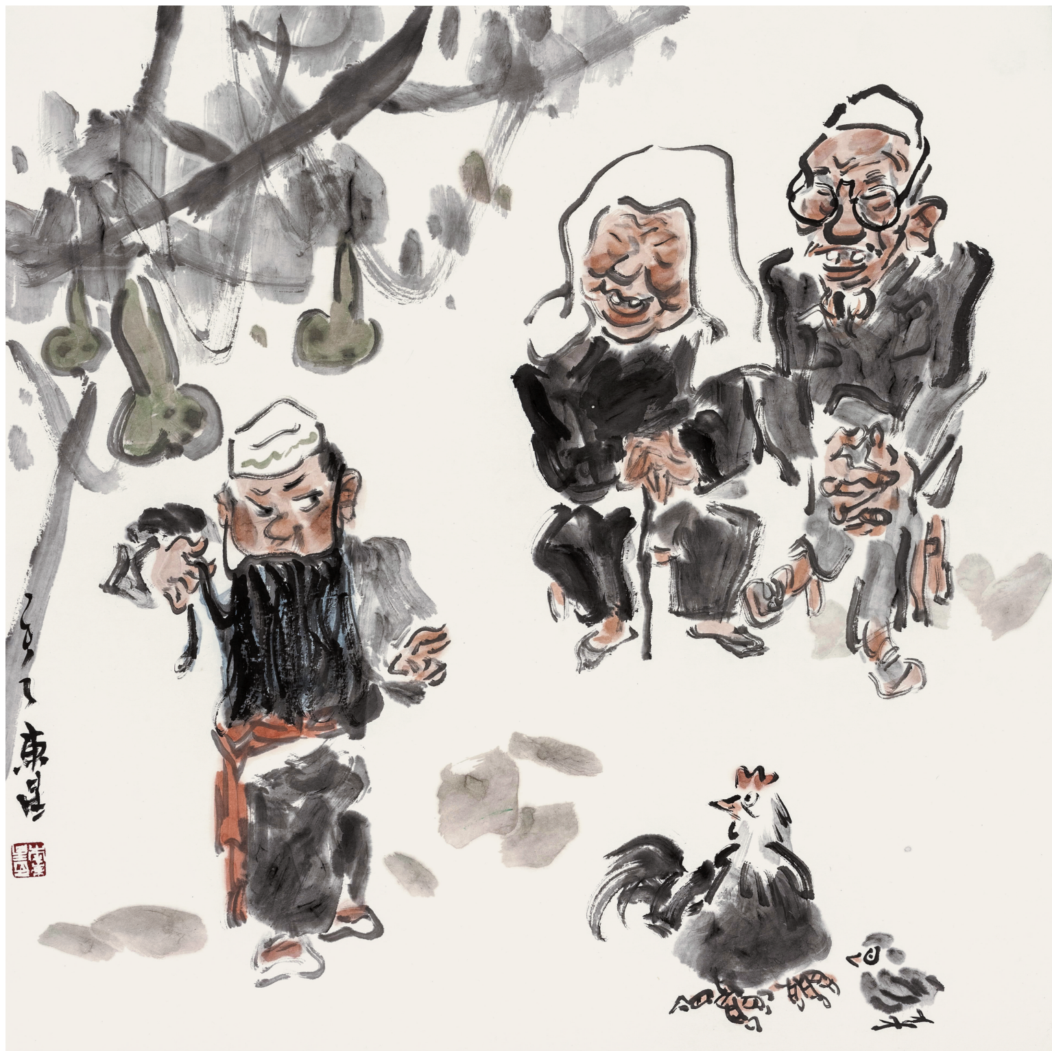
山乡秦音 68cm × 68cm