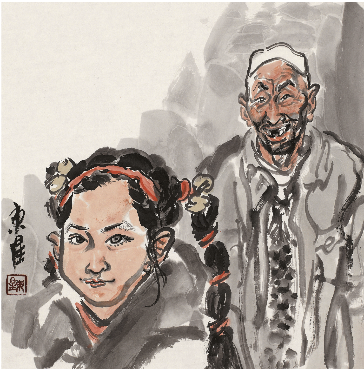
回乡风情速写 NO.2 36cm × 36cm