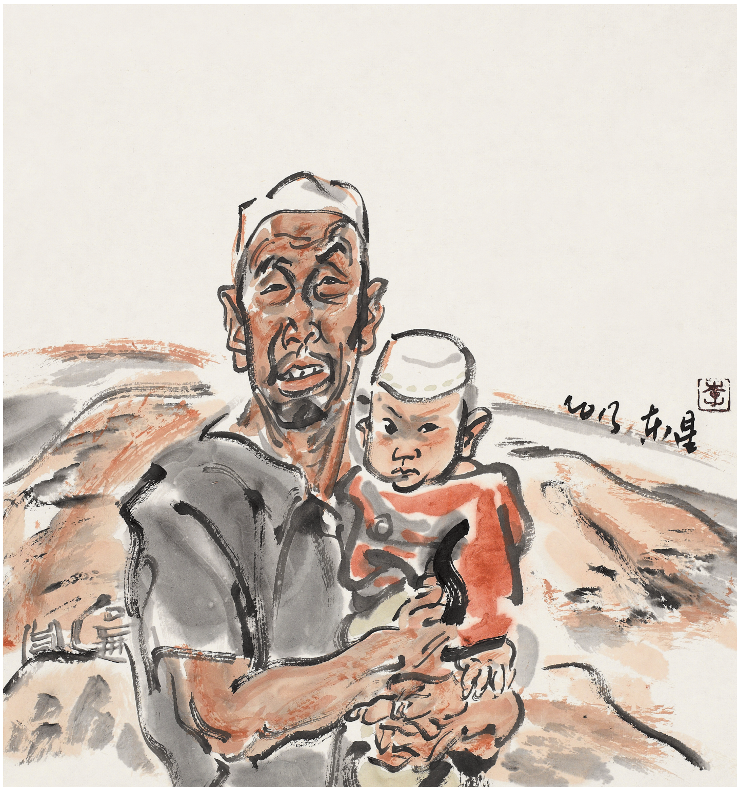
回乡风情速写 NO.3 36cm × 36cm