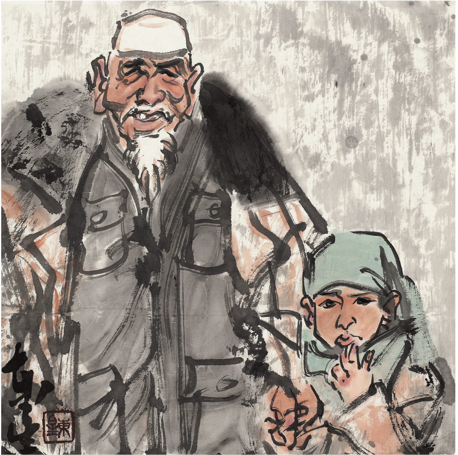
回乡风情速写 NO.1 36cm × 36cm