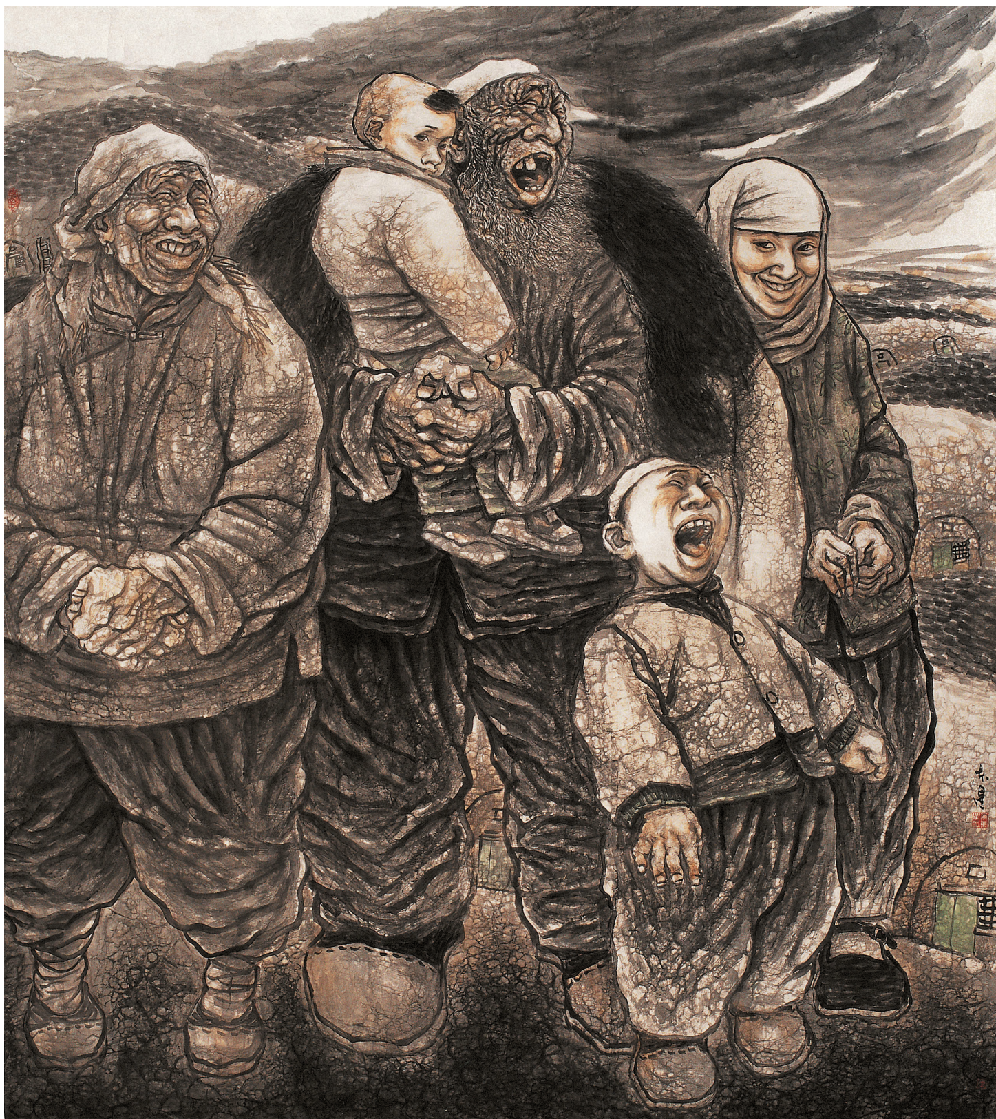
大山歌 200cm × 180cm