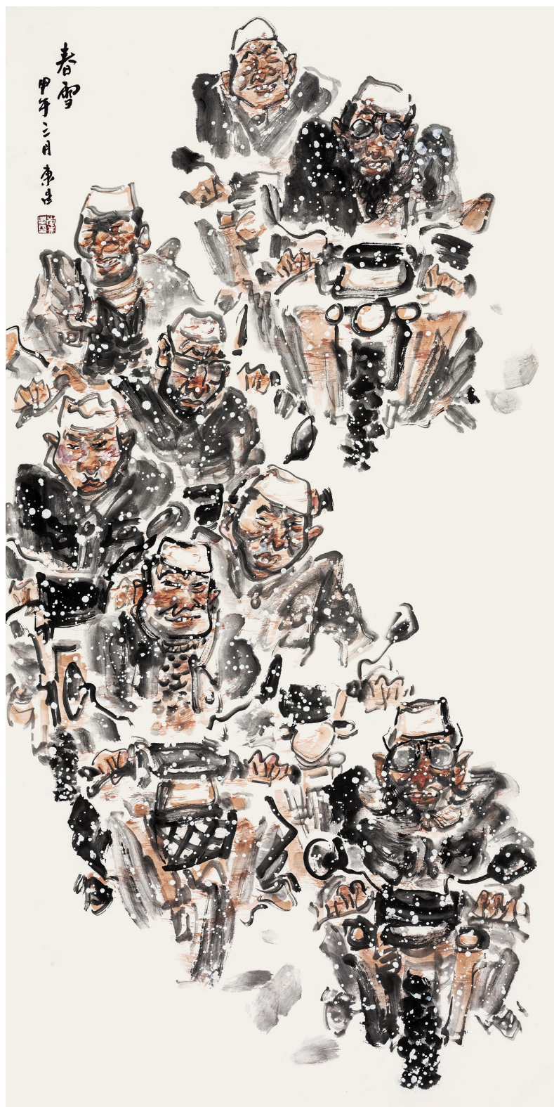
春雪 136cm × 68cm