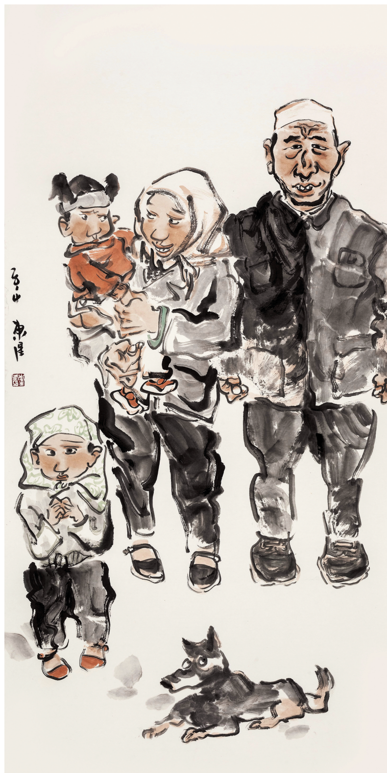
回乡人家 136cm × 68cm