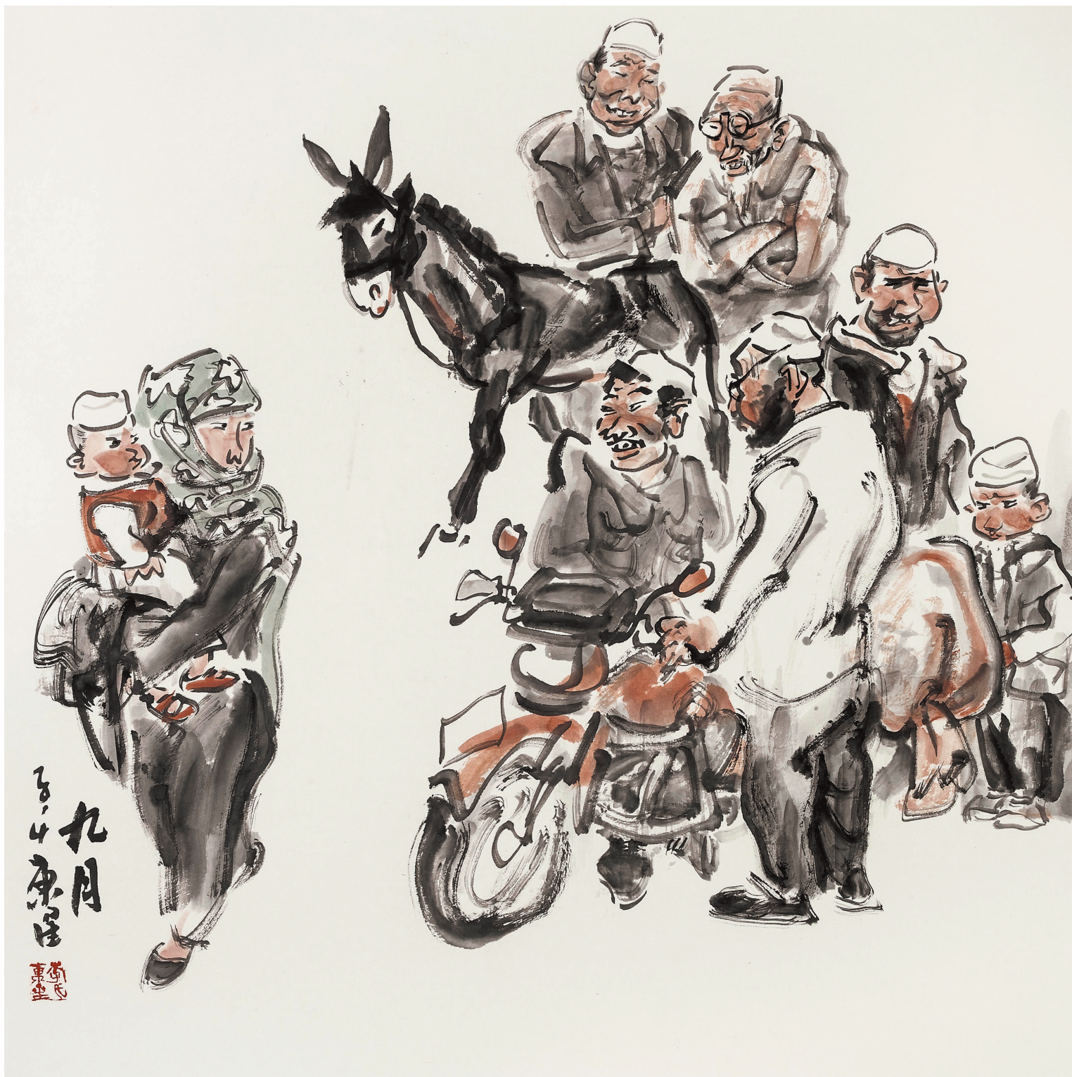
九月 68cm × 68cm