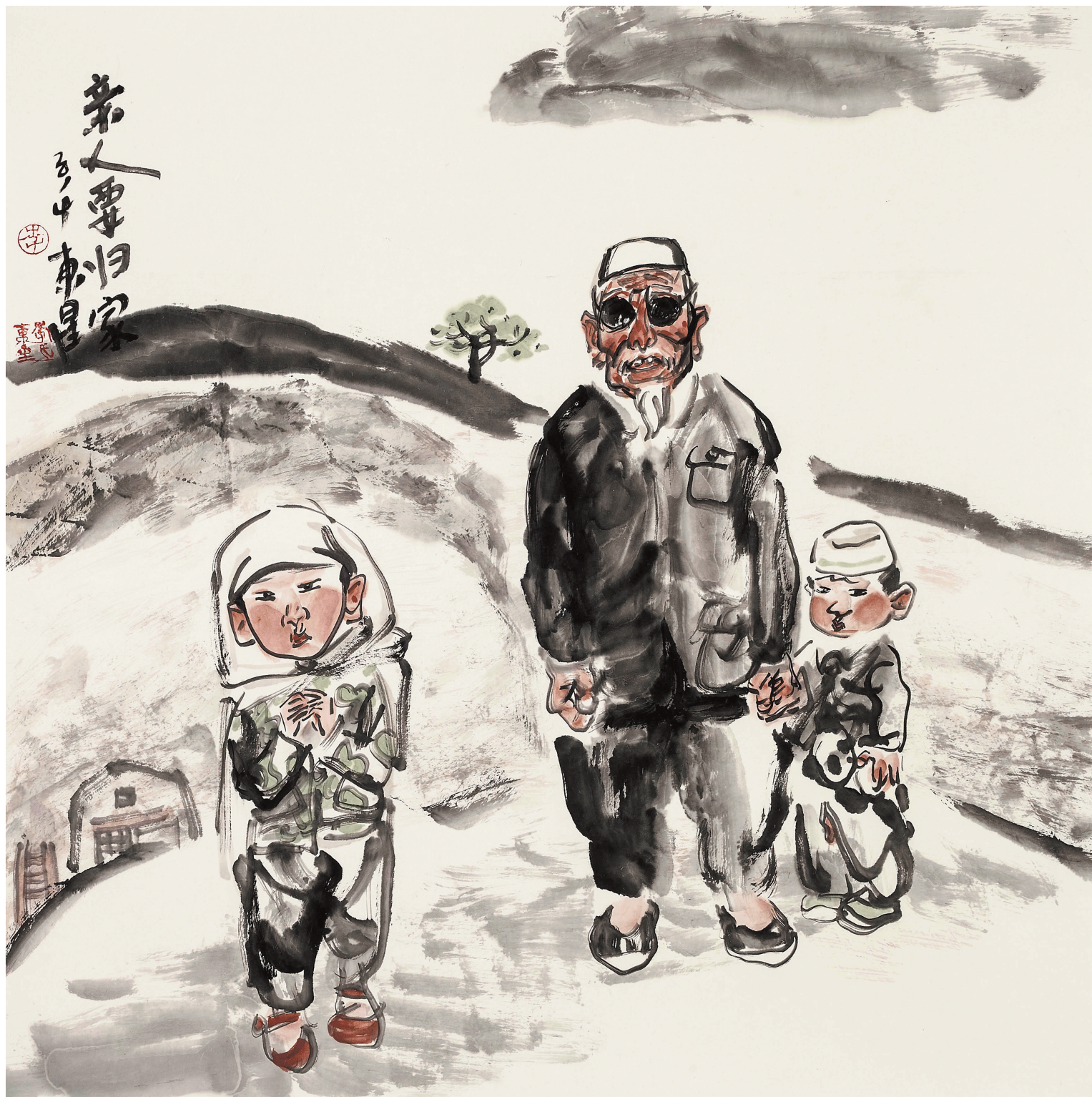
亲人要归家 68cm × 68cm