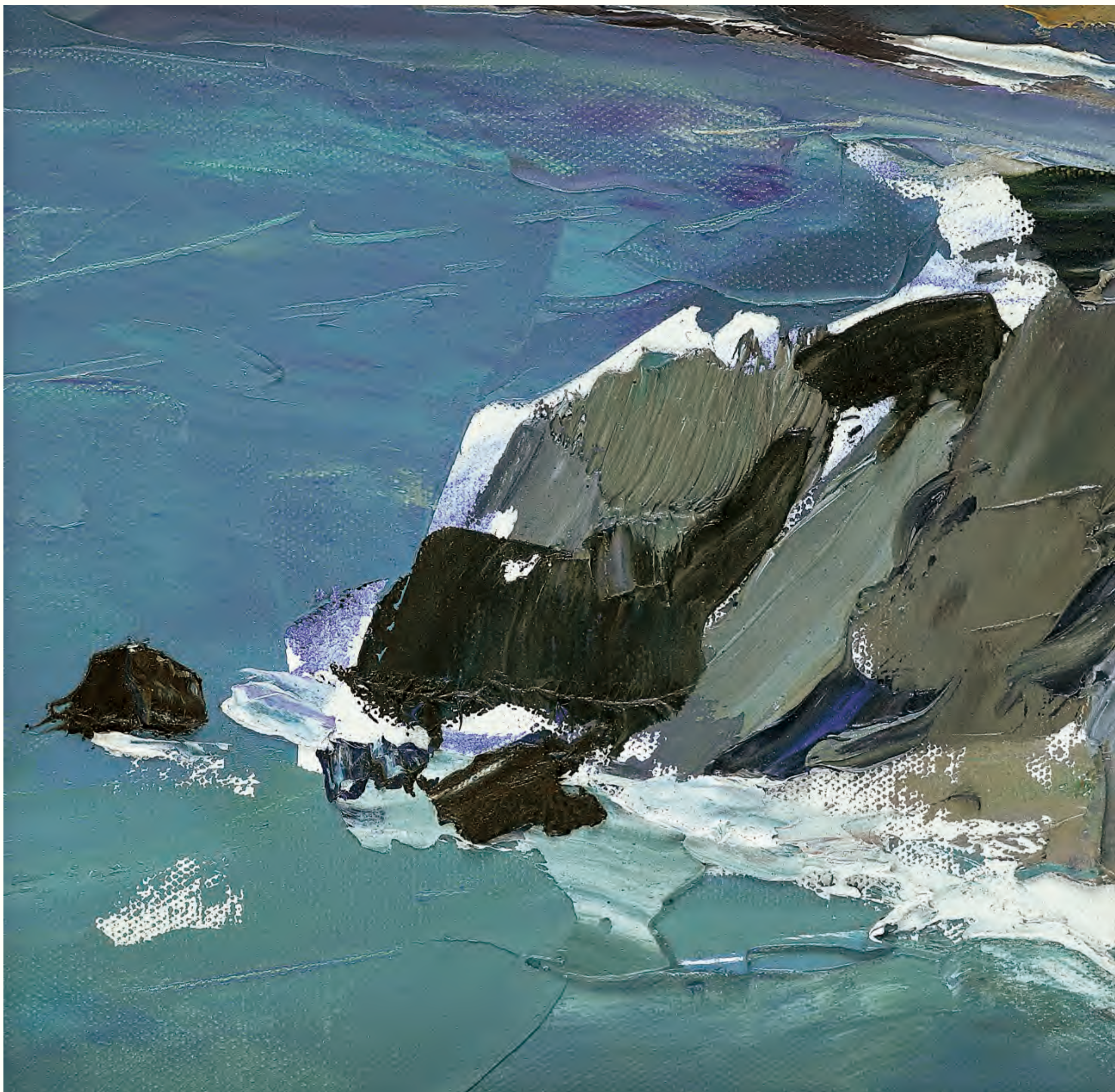
《礁石》 25cm × 25cm 2002年 谌北新