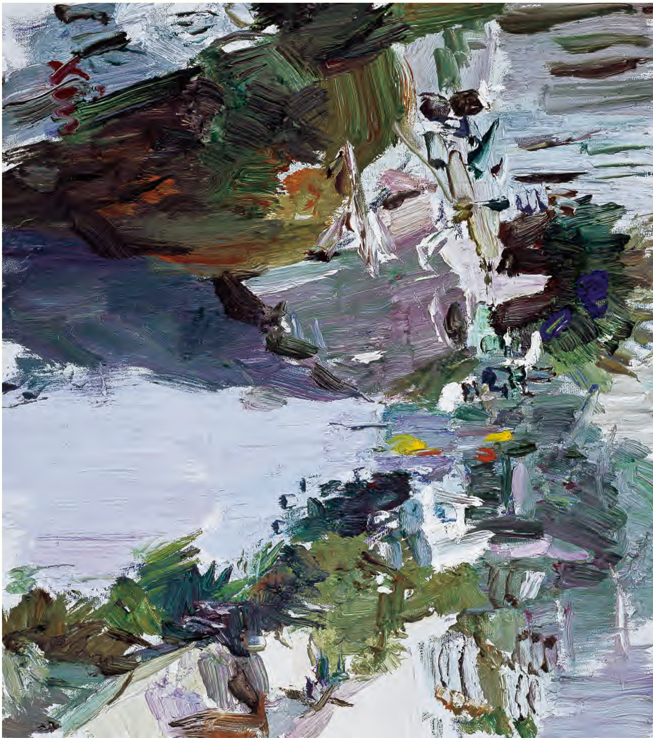
《忆江南》70cm x 80cm 二〇〇九年 董北新