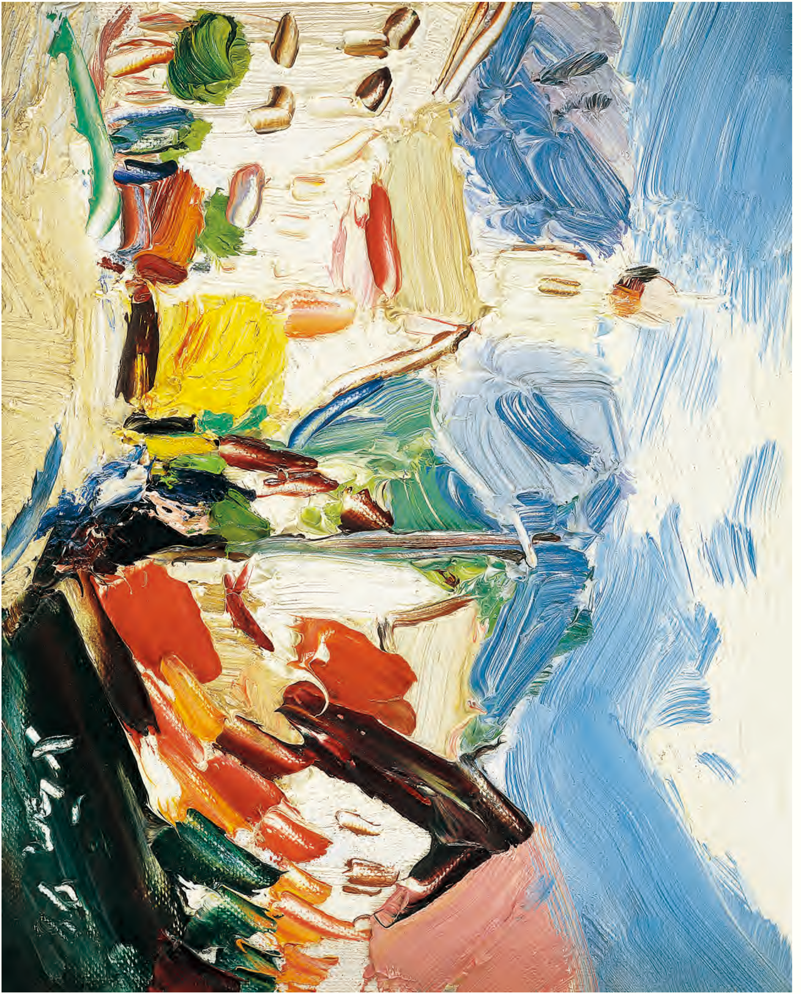
《小镇》 20cm x 25cm 11001年 庄吉新