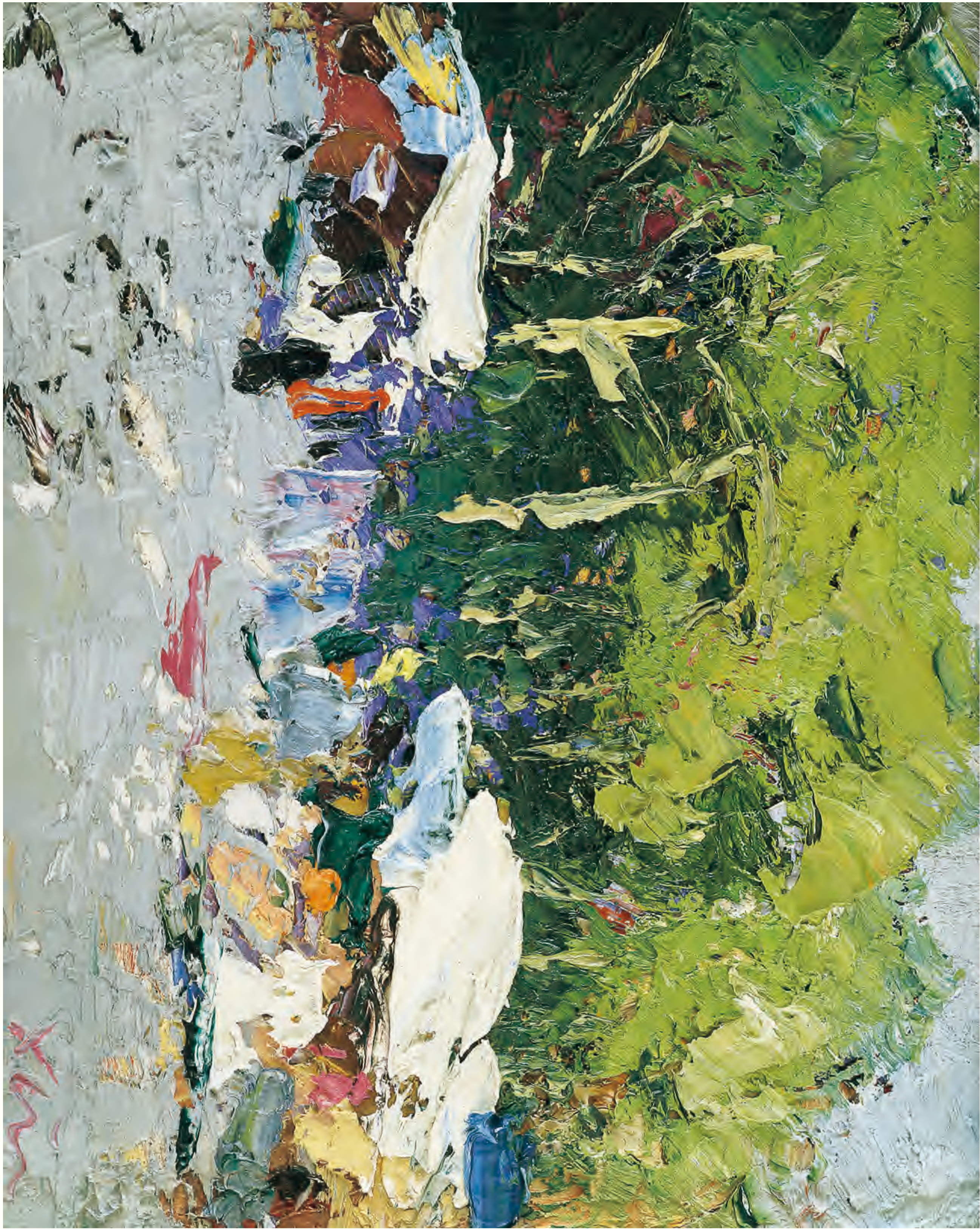
《早市》 20cm x 25cm 110011年 潘世新