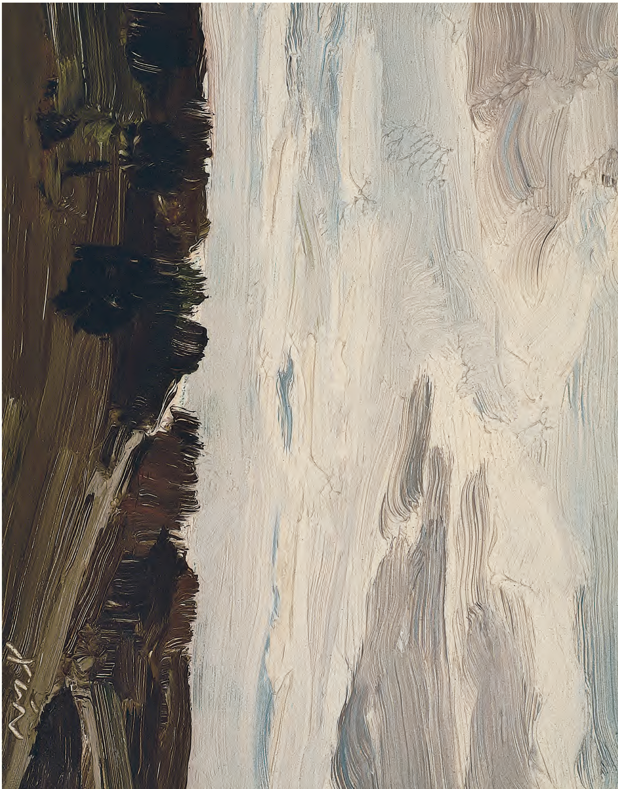
《北方》20cm x 25cm 11001年 韩北新