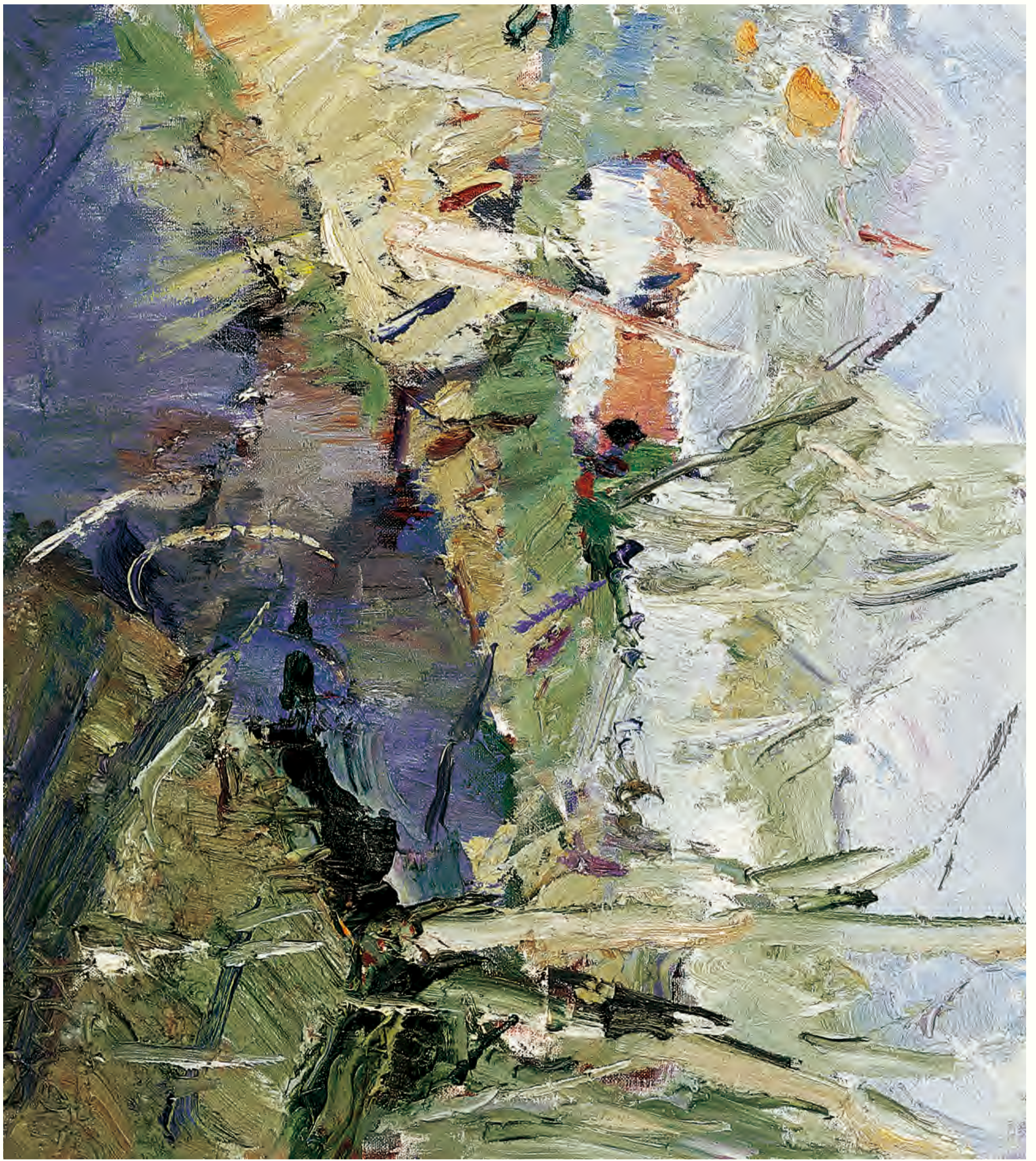
《早晨》 68cm x 80cm 11001年 庄吉士