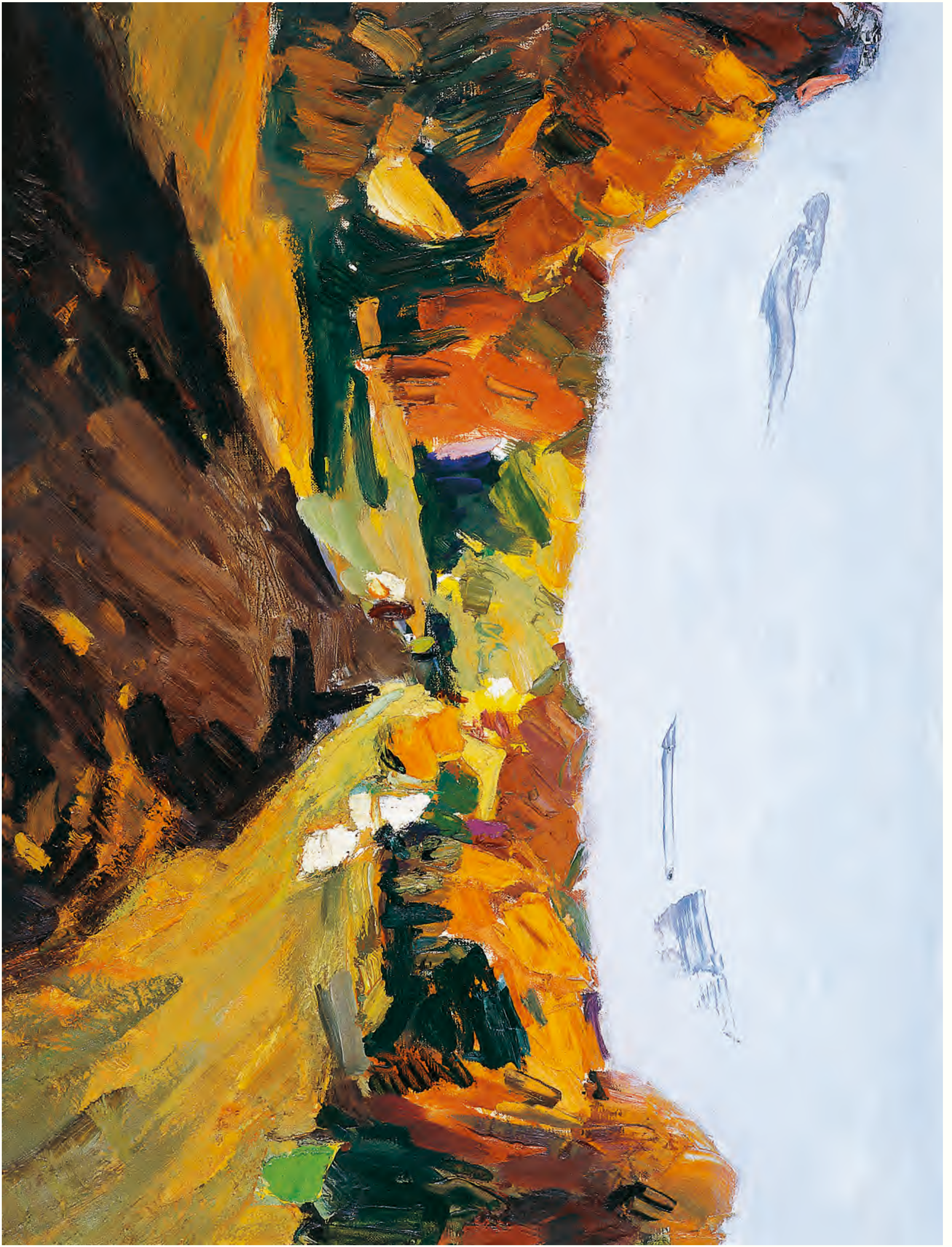
《绝句》 80cm x 100cm 11001年 潘北新