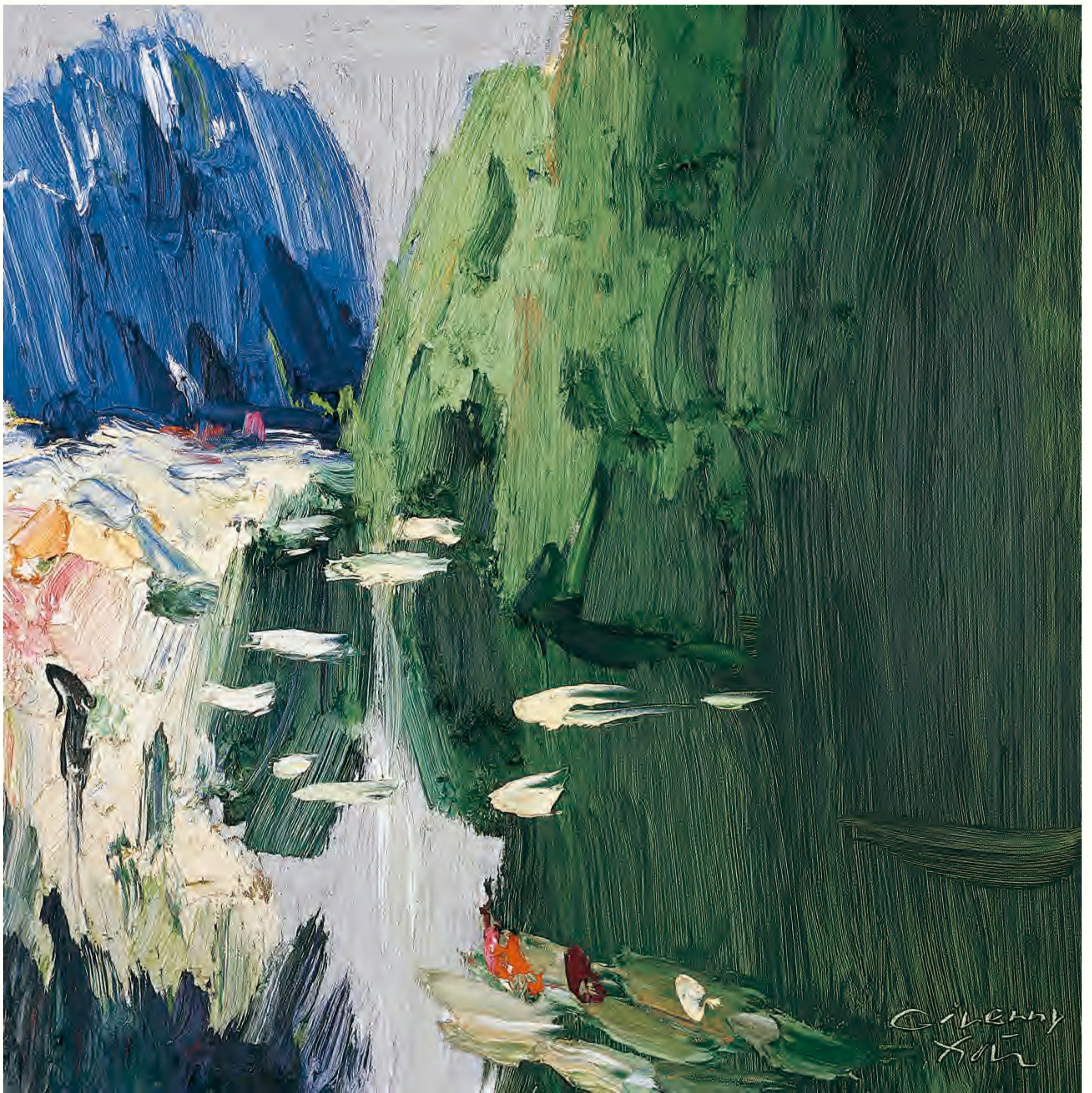
《希威尔尼》 90cm × 90cm 2008年 湛北新