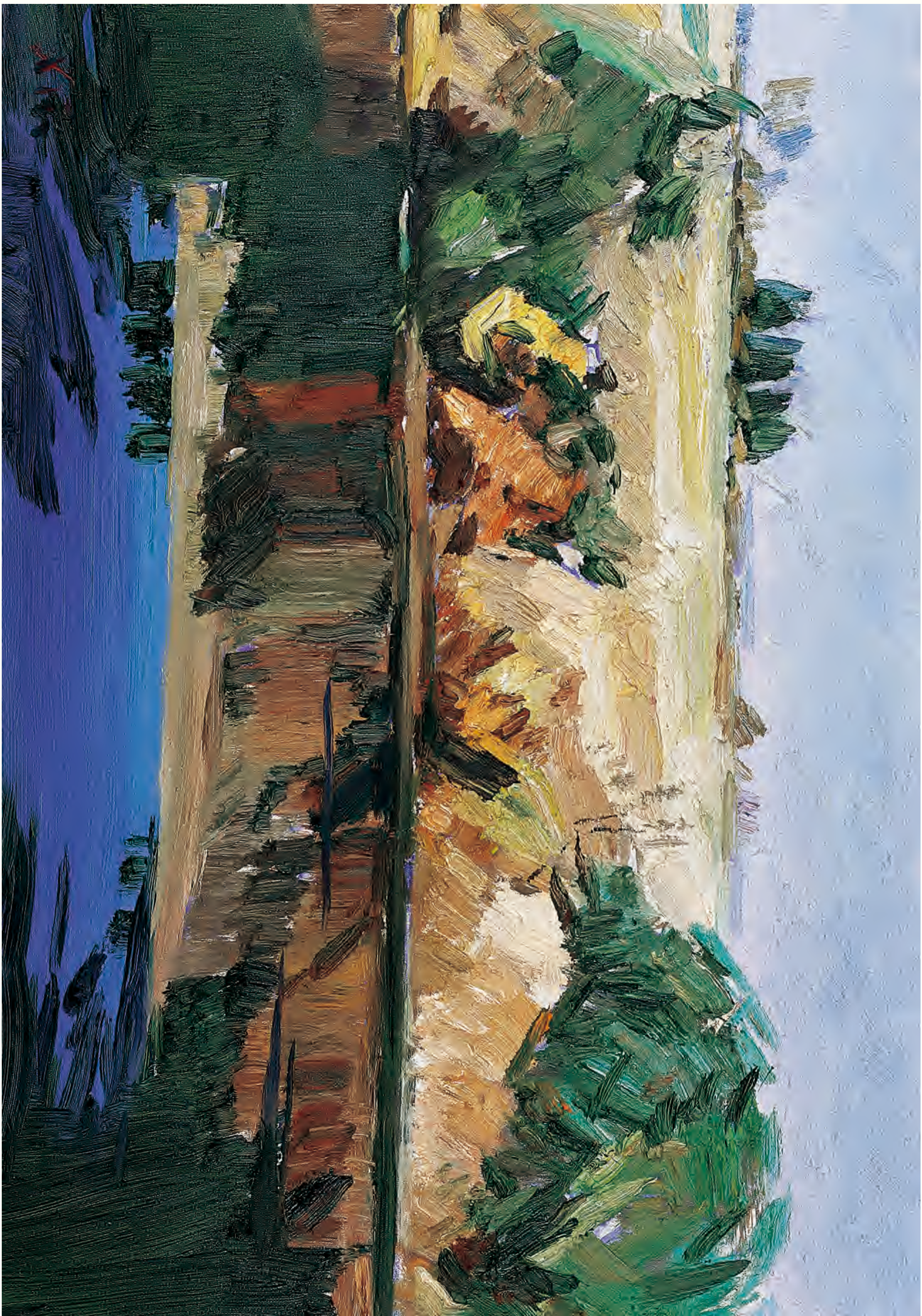
《秋水》90cm x 120cm 1006年 李迅