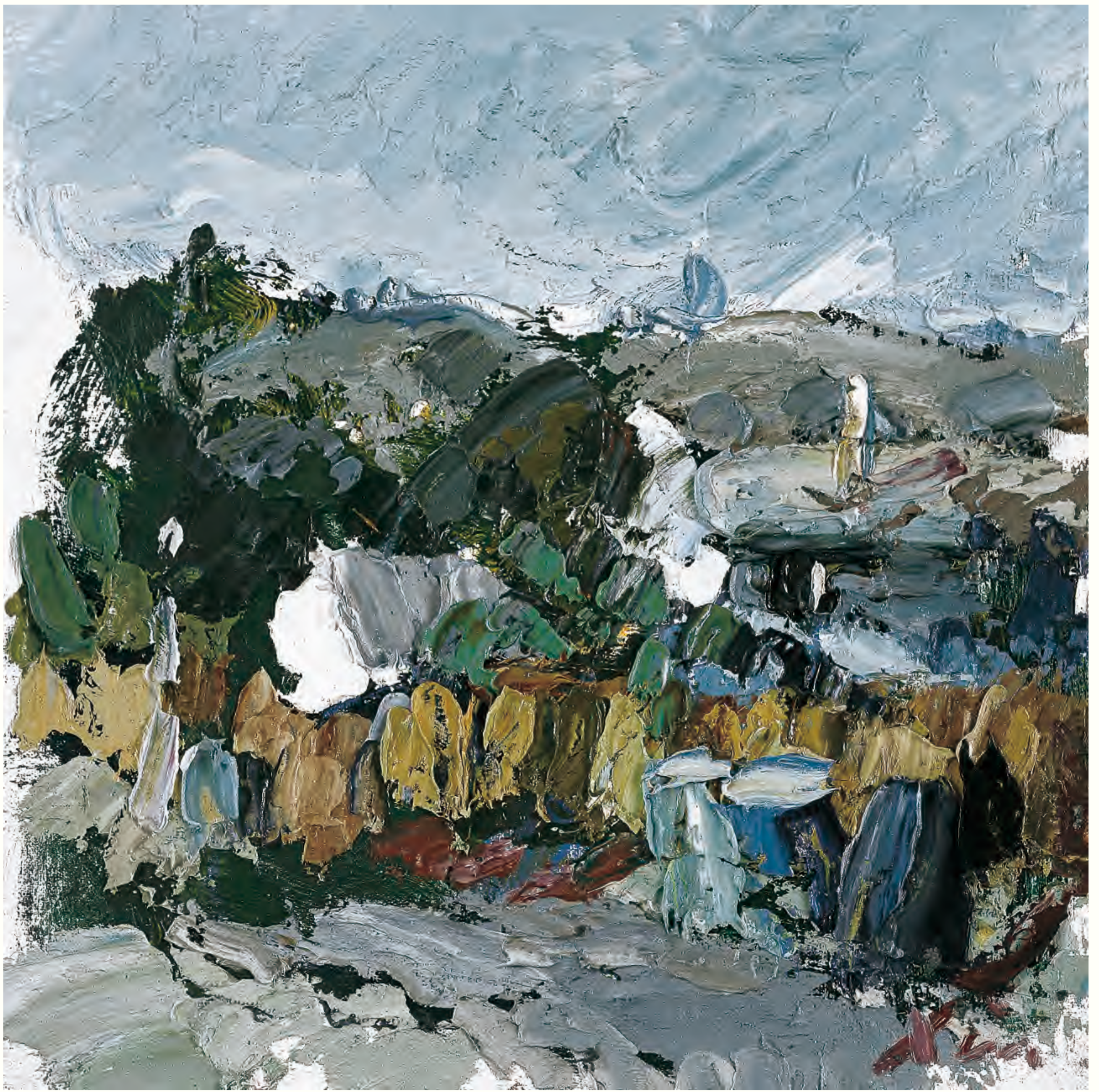
《晨光》 25cm × 25cm 2008年 湛北新