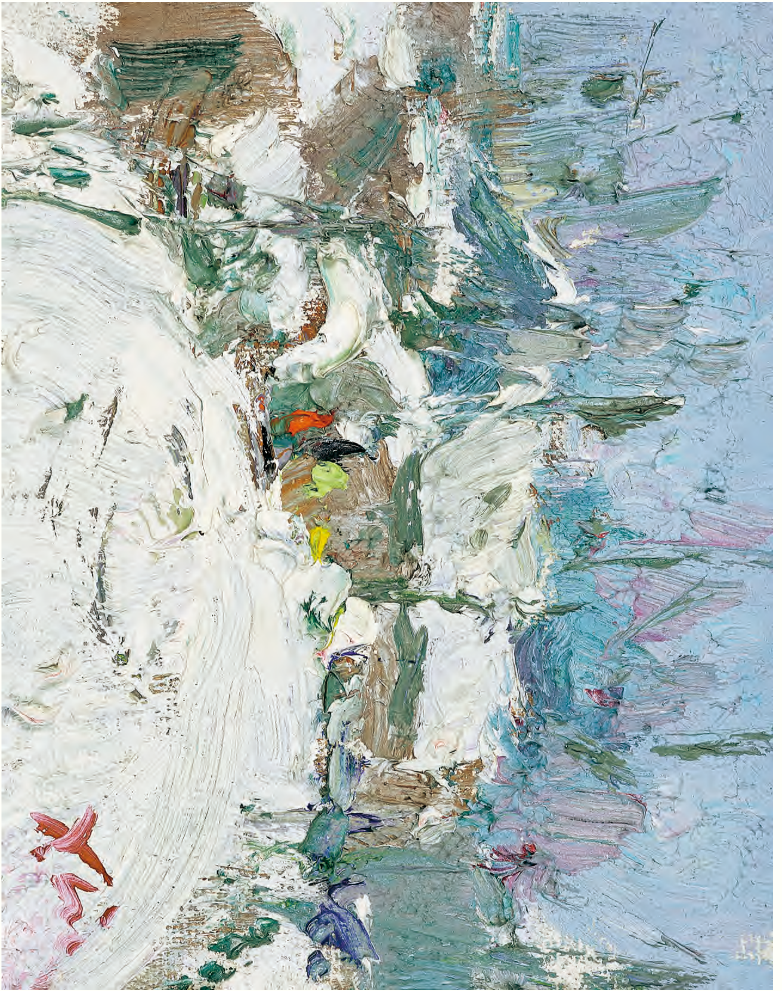
《长安画》 20cm x 25cm 1100四年 速北新