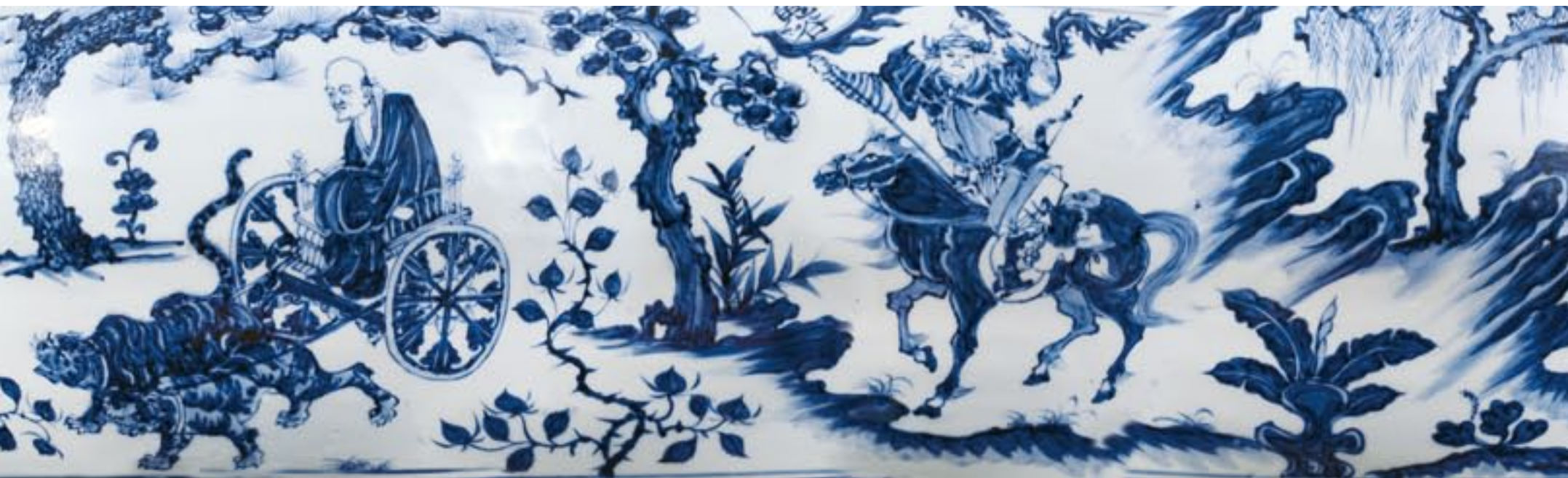
仿元青花鬼谷子下山图罐展开图