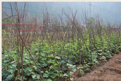
尚未结果的食用大葫芦

古时的葫芦羹有荤、素之分。素羹是这样做的：“下油水中煮极热，体横切，厚二分，沸而下，与盐豉、胡芹累奠之。”（《齐民要术》）以葫芦为主，盐豉胡芹为辅。葫芦可以素炒为菜，也可以做饺子、包子馅，但是不