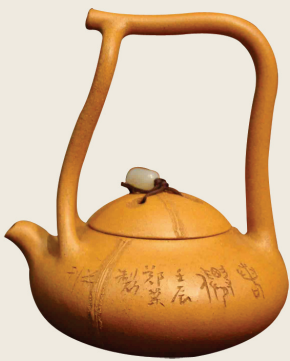
用葫芦制作的茶壶

扁壶、砚盒、钟楼、香盒、鼻烟壶及虫具等，多达二三十种。其中每一品种在造型和大小上又有很大差别。如盘有圆形的，也有长圆形的；碗有撇口的，也有兜口的；