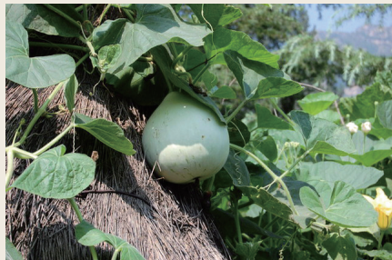
生长中的食用大葫芦

葫芦还可做成葫芦干收藏起来，留到冬日做成荤菜。制作葫芦干所用的葫芦，只能是趁其嫩时削成条片，晒干，若等其成熟就会发苦。南宋孟元老《东京梦华录》卷九载：“近岁节，市井皆印卖门神、钟、桃符……卖干茄瓠、马牙菜、胶牙饧之类，以备除夜之用。”“干茄瓠”就是茄干、葫芦干。既是除夕之用，看来身价还不低。葫芦干是怎样做的呢？《农桑撮要》上有一则“葫芦茄干”做了介绍：“做葫芦茄干，茄切片，葫芦、瓠子削条，晒干收，依做干菜法。”直到清代仍是这种做法。葫芦虽算不上什么高级菜蔬，但经过晒制的葫芦干，却是有其独特的风味，备受欢迎的。旧时不但乡下人爱吃，也受到达官贵人、公子小姐们的青睐。《红楼梦》第四十二回写平儿对刘姥姥说：“别说外话，咱们都自己，我才这么着。你放心收了罢；我还和你要东西呢。到年下，你只把你们晒的那个灰条菜和豇豆、扁豆、茄子干子、葫芦条儿，各种干菜带些来——我们这里上上下下都爱吃这个——就算了。别的一概不要，别罔费了心。”你看，贾府的老爷们吃够了山珍海味，也愿意用葫芦干换换口味呢。其实，葫芦干菜是中国人