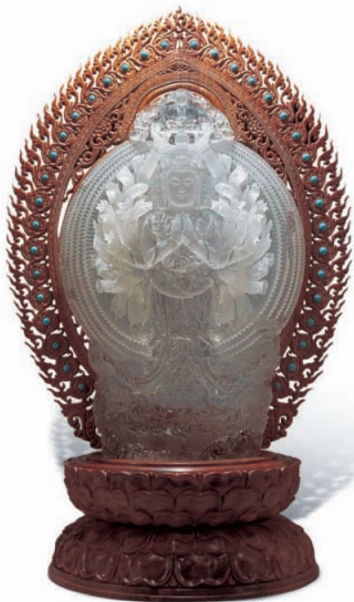
水晶雕刻《千手观音》

中国玉石雕刻大师翁祝红于2004年创建了“菩提·心晶”水晶工作室，潜心钻研佛教造像艺术。其代表作《四十二臂千手千眼观世音》、《大势至菩萨》、《长寿佛》、《三身佛》等先后在中国玉石雕刻作品展和中国工艺美术大师作品展中获得金奖。