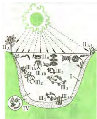
图 1.3 桑基鱼塘型生态农业

三国时期大机械设计师马钧设计发明了翻车，又叫龙骨风车，其结构设计精巧，所谓“灌水自覆，更入更出”，可以连续提水，从唐代开始，长江流域盛行形似纺车的水车(图 1.4)，到明末又有了利用风力的风转翻车，大大提高了灌溉效率 [3] 。