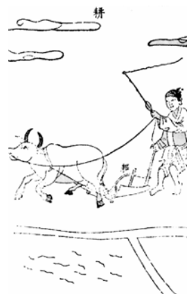
图 1.2 《天工开物》的耕犁