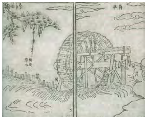
图 1.4 《天工开物》中的铜车(水车)