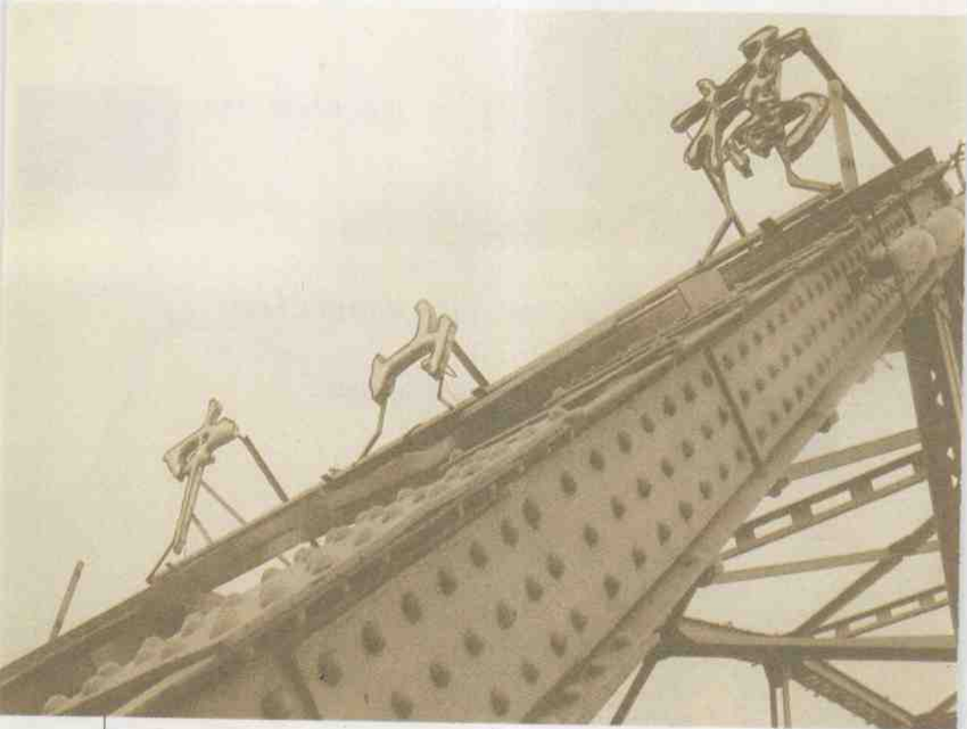
中山桥,原名兰州黄河铁桥,1909年建成,号称“天下第一桥”,为目前黄河上惟一留存的近代桥梁。现为甘肃省文物保护单位。