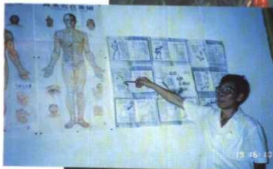
黄教授在海峡两岸特色医疗研讨会演讲(右上) 黄教授为学员讲解经筋疗法(左)