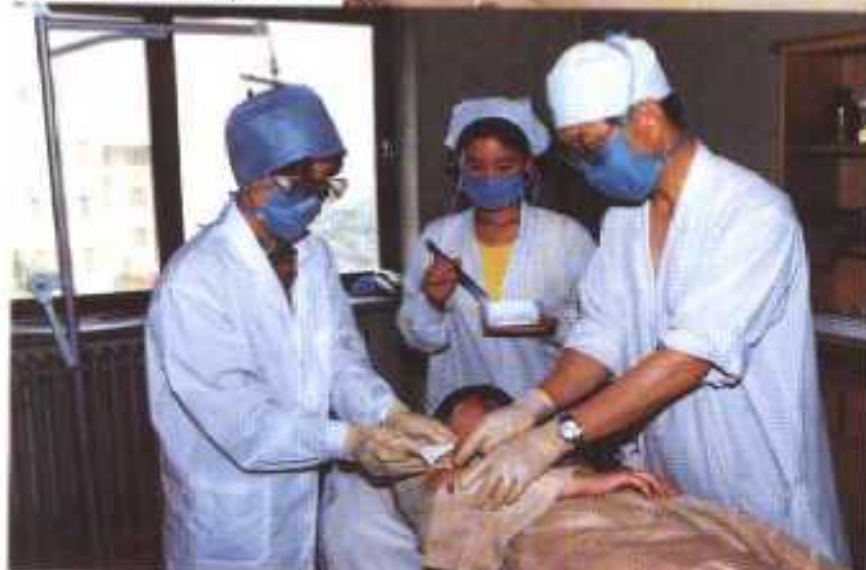
一九九四年七月，经国家中医药 管理局批准，在首都北京成立了 以针刀学医为特色的中国中医研 究院长城医院。图为医院门诊大 楼(上)。日本医生在长城医院进 行针刀闭合性手术见习(左)。