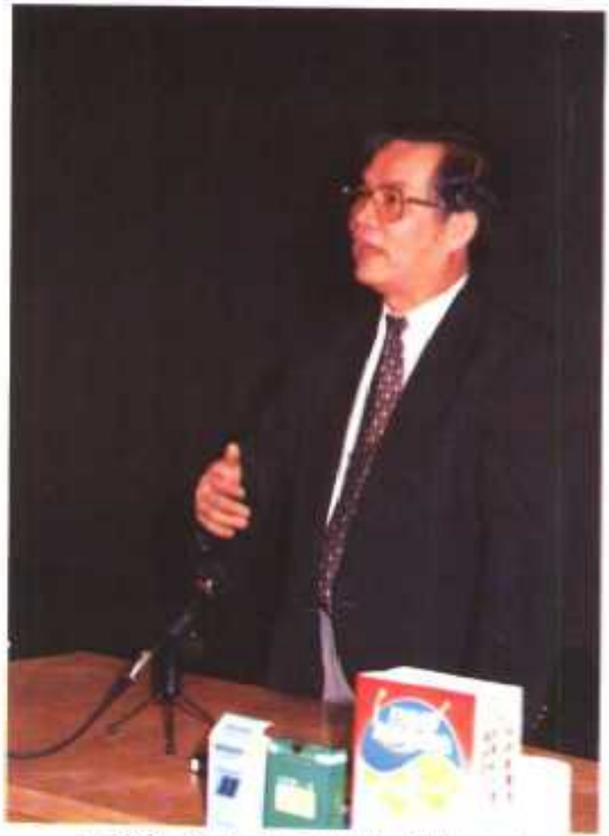
吕教授给学员演讲排毒健康法