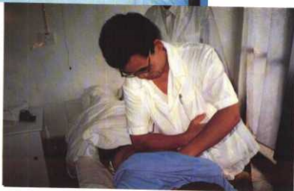
黄教授为患者进行舒筋治疗(右)