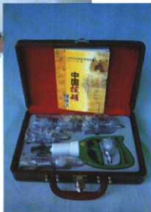
《中国拔罐健康法》专著与新一代枪式真空拔罐器(右)