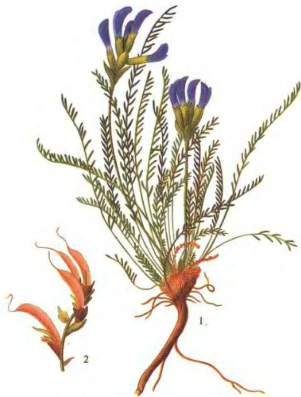
彩图7 我大夏 (镰形棘豆 Oxytropis falcata Bunge)