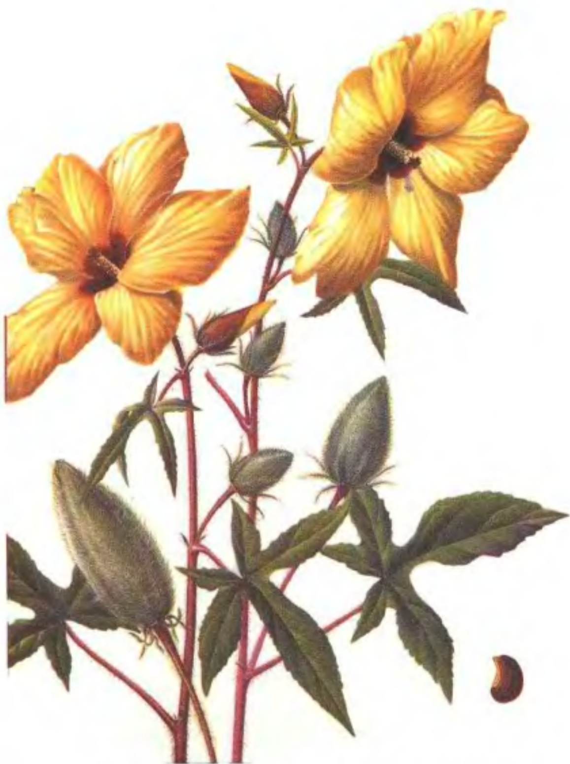
彩图8 黄葵 Abelmoschus moschatus (L.) Medic. (王利生绘)