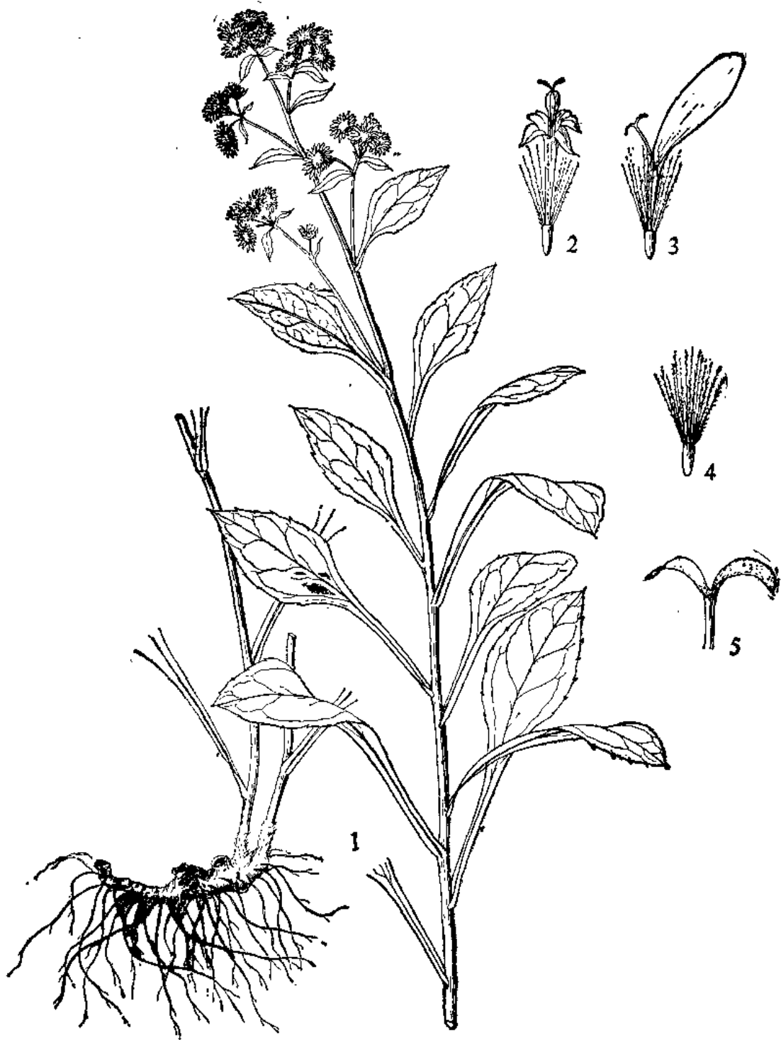
图1 一枝黄花 Solidago virga-aurea Lour. 1. 植株 2. 管状花 3. 舌状花 4. 瘦果 5. 花柱 (潘鸿森绘)