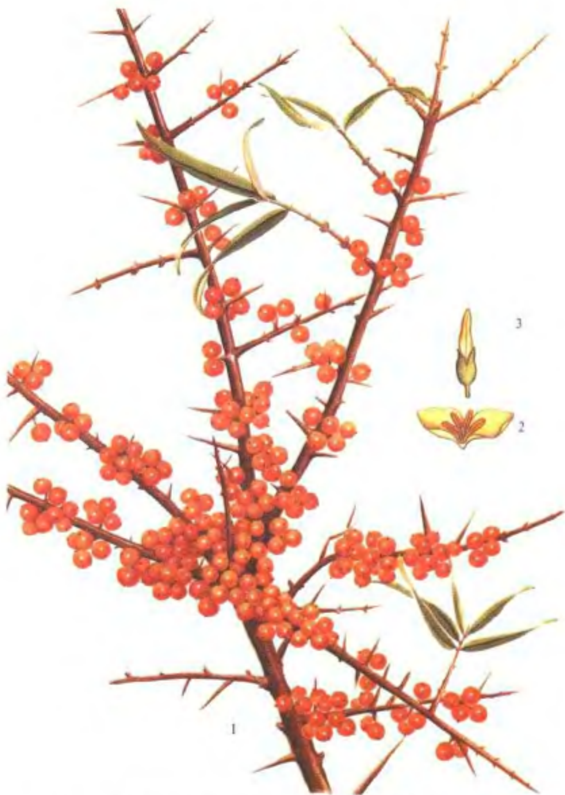
彩图5 沙棘 Hippophae rhamnoides L.