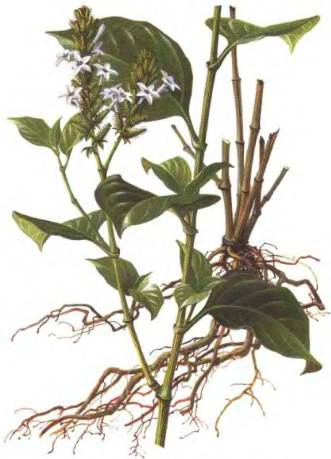
彩图2. 白花丹 Plumbago zeylanica L. (曾晓谦绘)