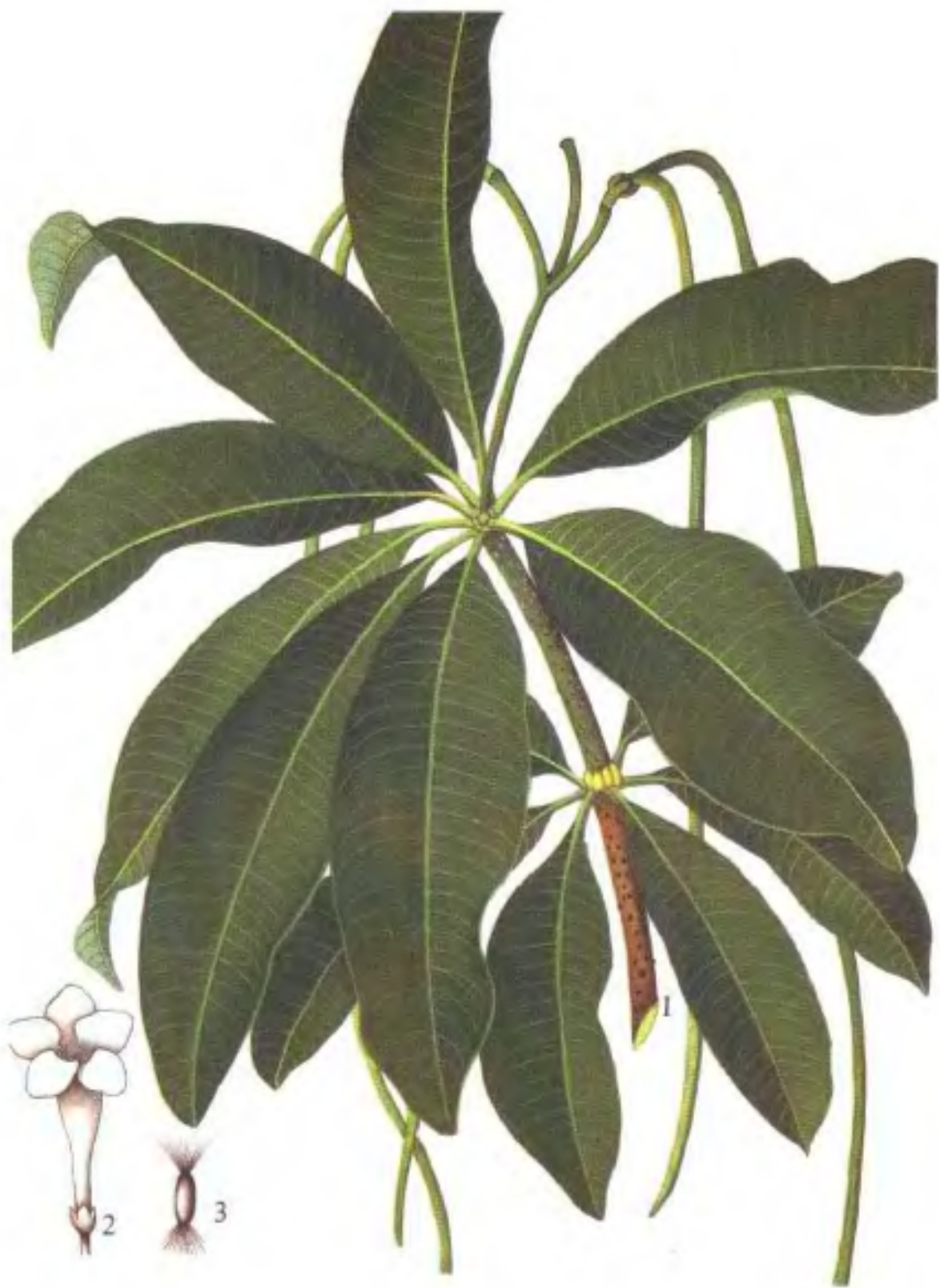
彩图4 灯台树 Alstonia scholaris (L.) R. Br. 1.果枝 2.花外形 3.种子 (肖 游松)