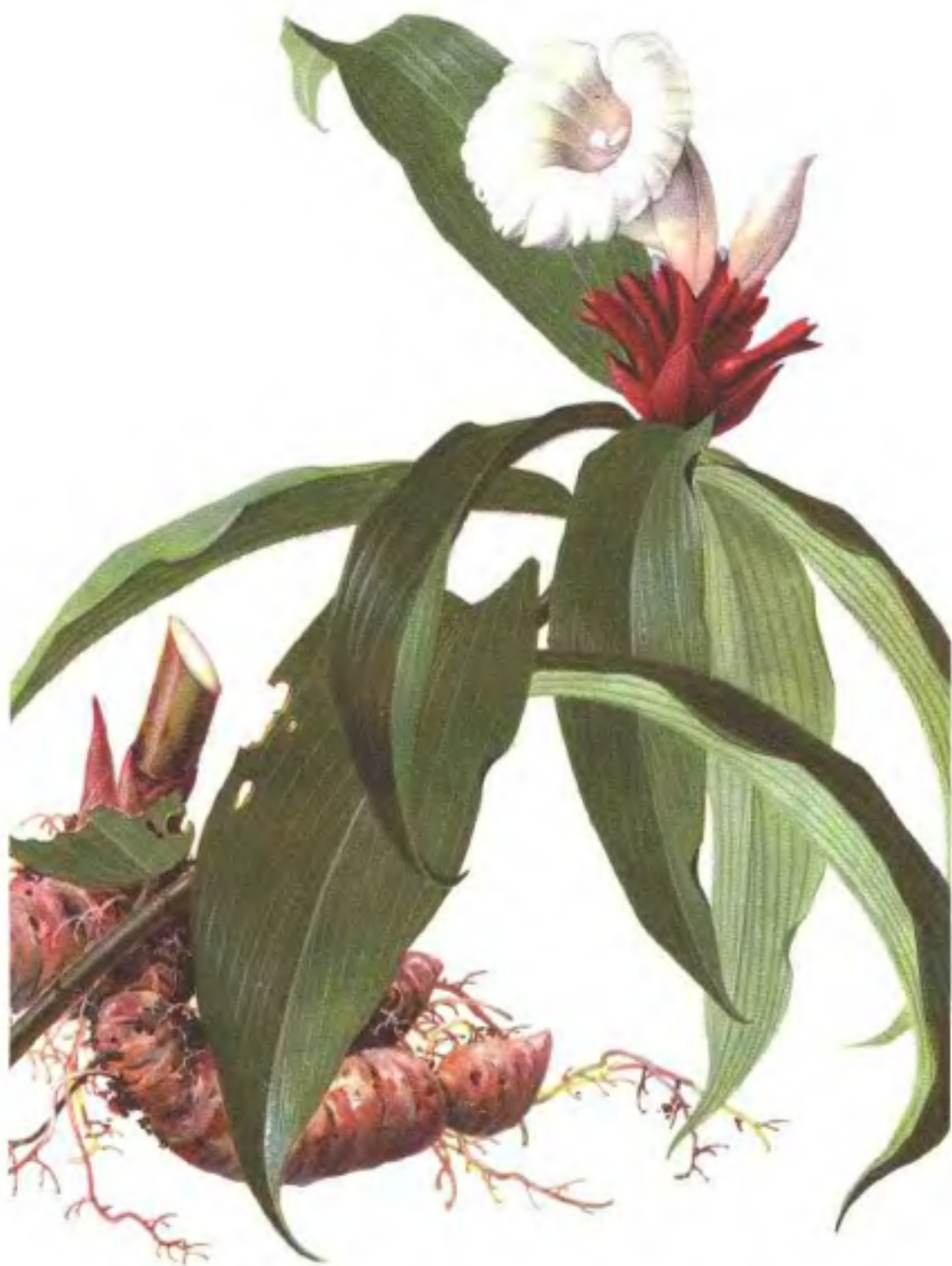
彩图3 闭鞘姜 Costus speciosus (Koenig) Smith (曾晓谕绘)