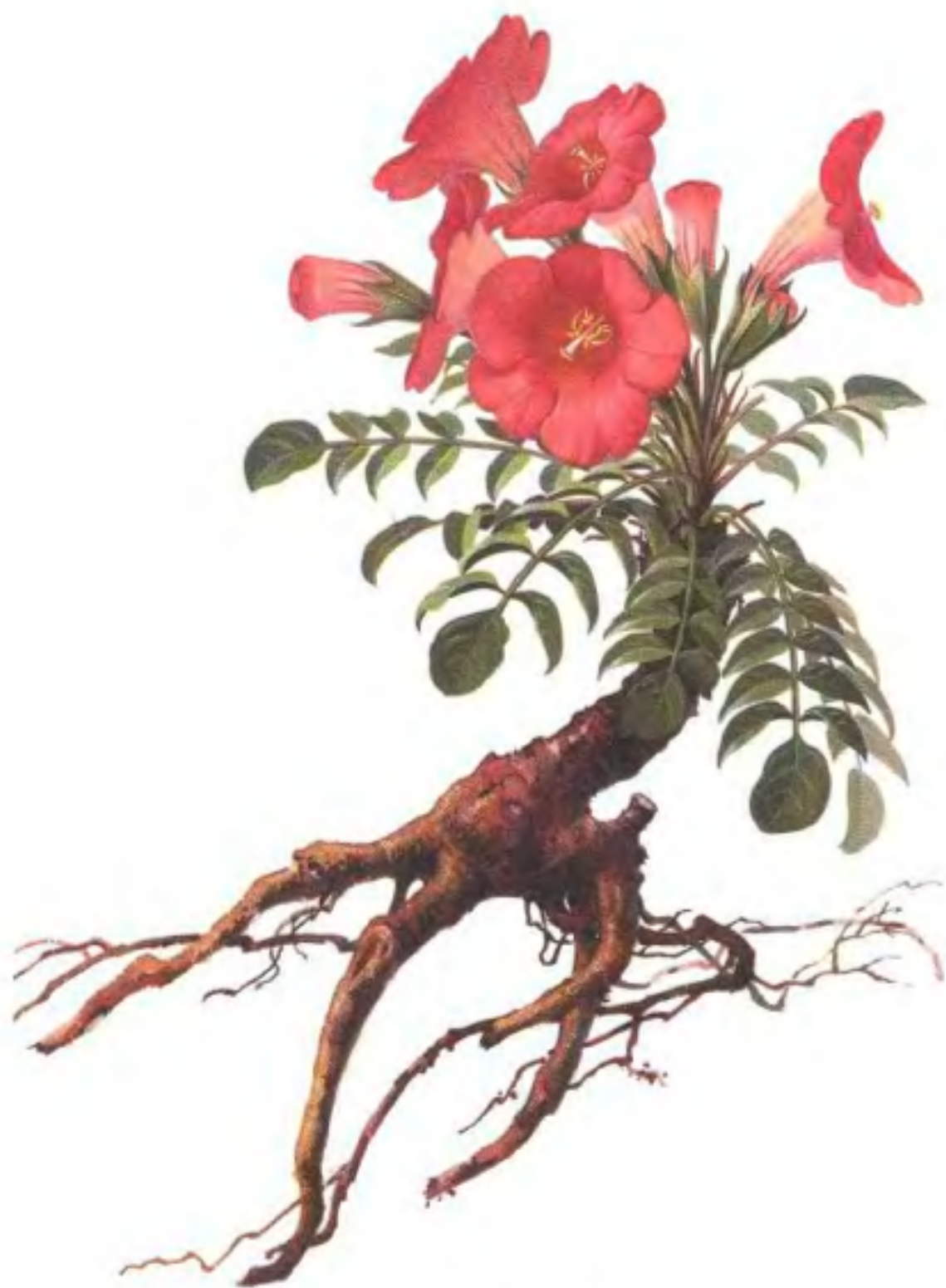
彩图1 乌却(密生波罗花 Lincarvillea compacta Maxim.) (宁汝莲 曾晓谦绘)