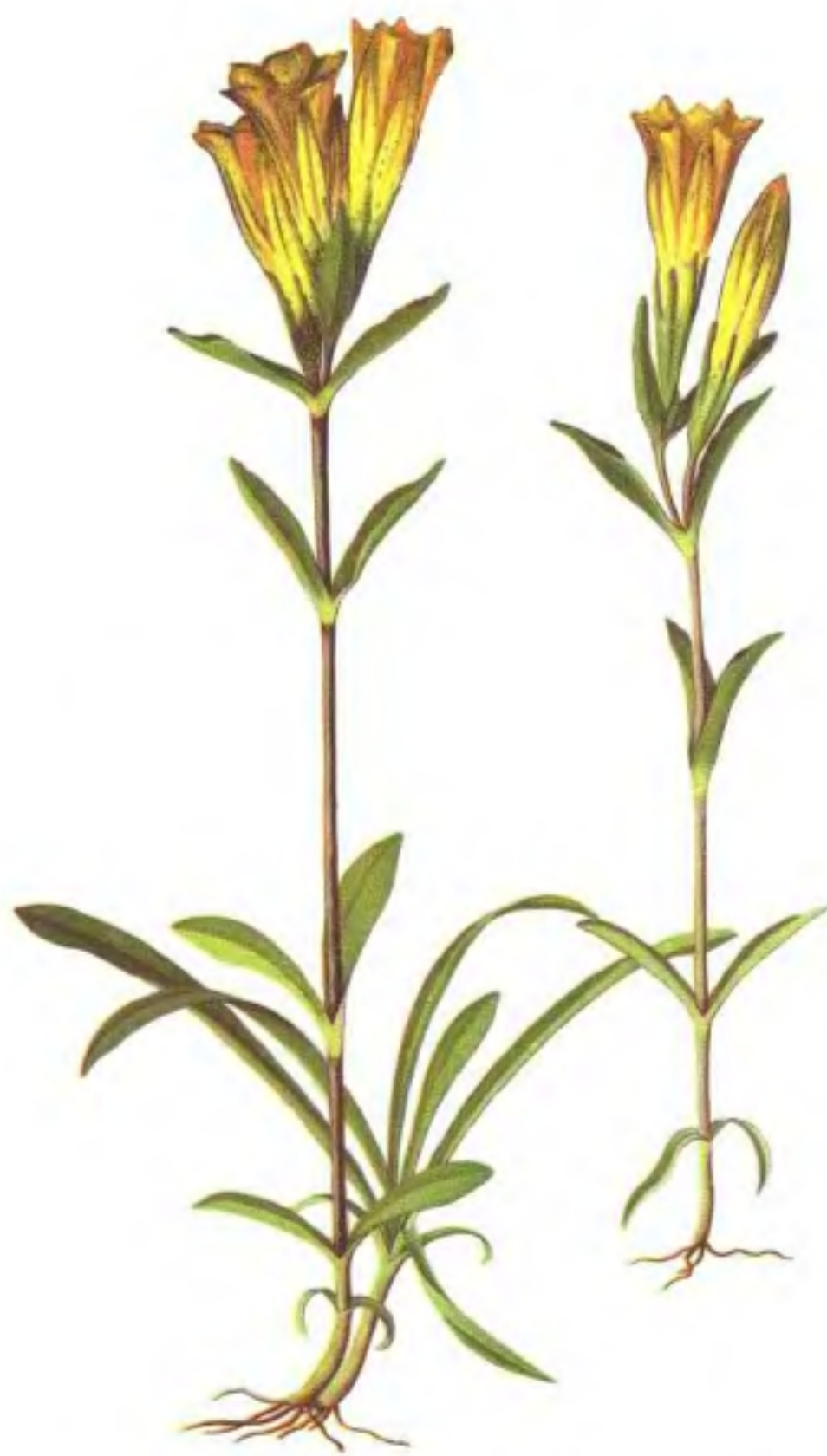
彩图6 青藏龙胆 Gentiana przewalskii Maxim. (宁汝莲绘)