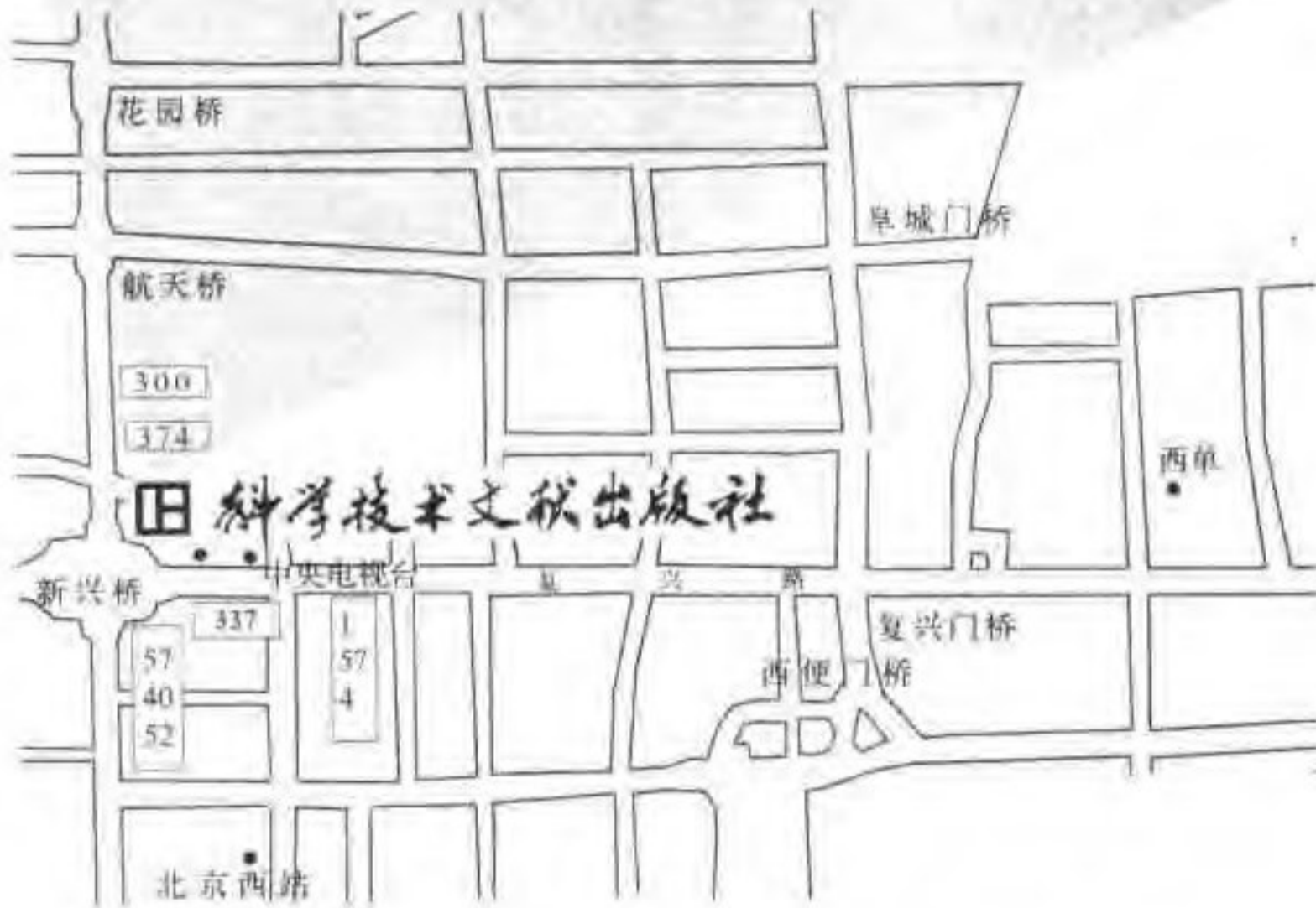
科学技术文献出版社方位示意图