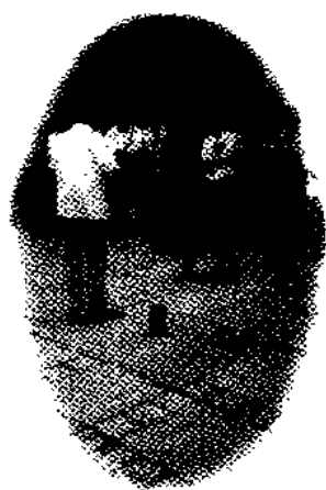
在培训班上为学员做解磷注射液急救敌敌畏中毒犬示范表演