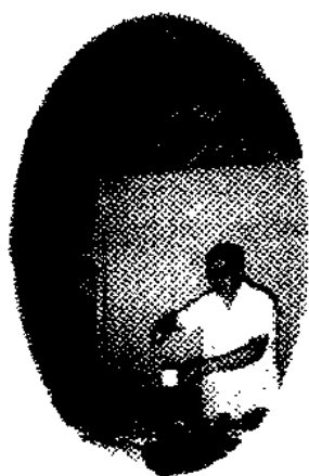
正在为学员示教毒检实验