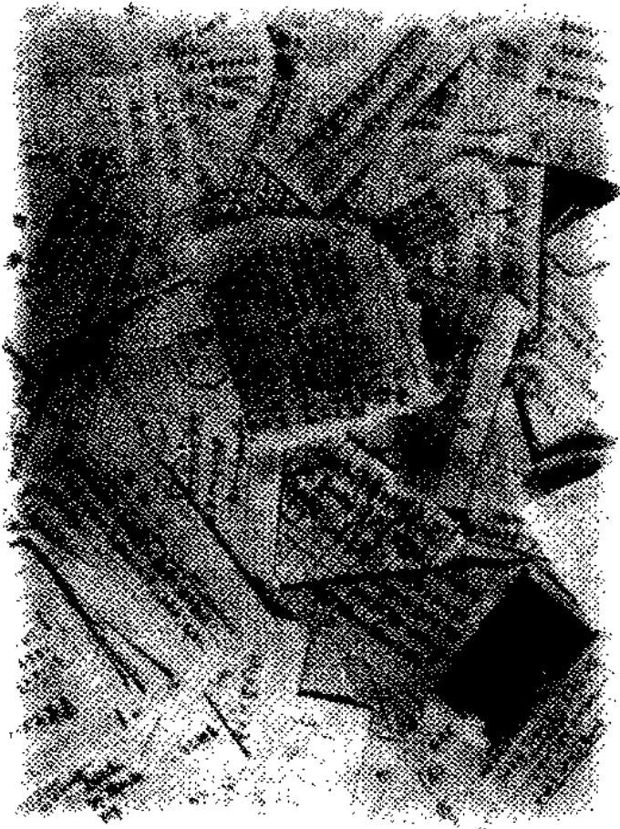
来自临床一线的问题(纸条照片)