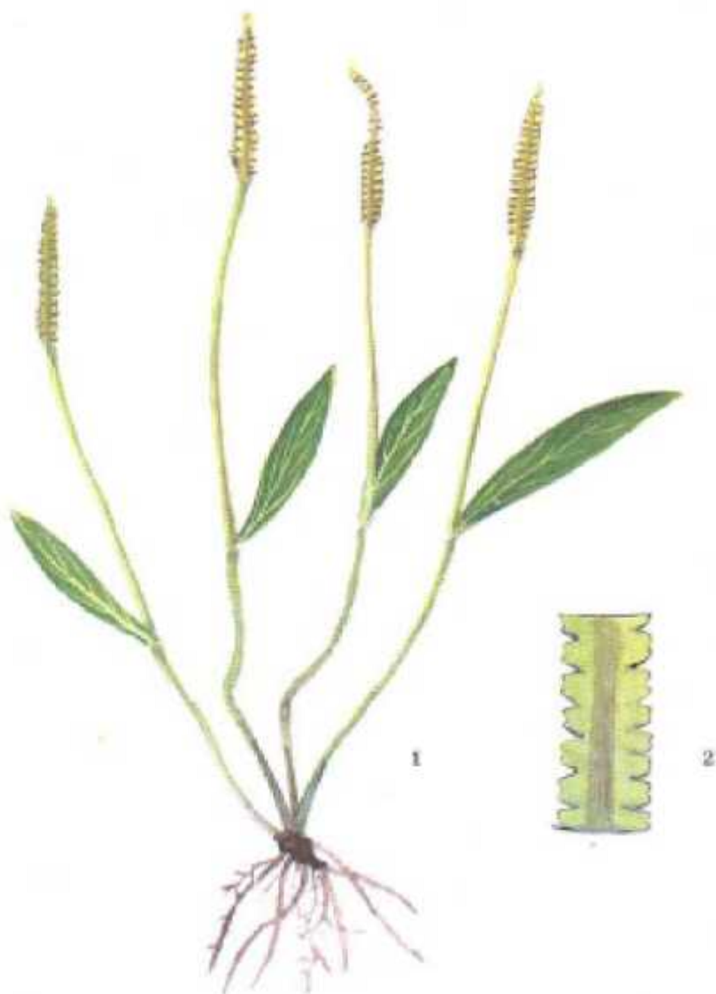
图1 狭叶瓶尔小草 1. 全株 2. 孢子叶 (放大)