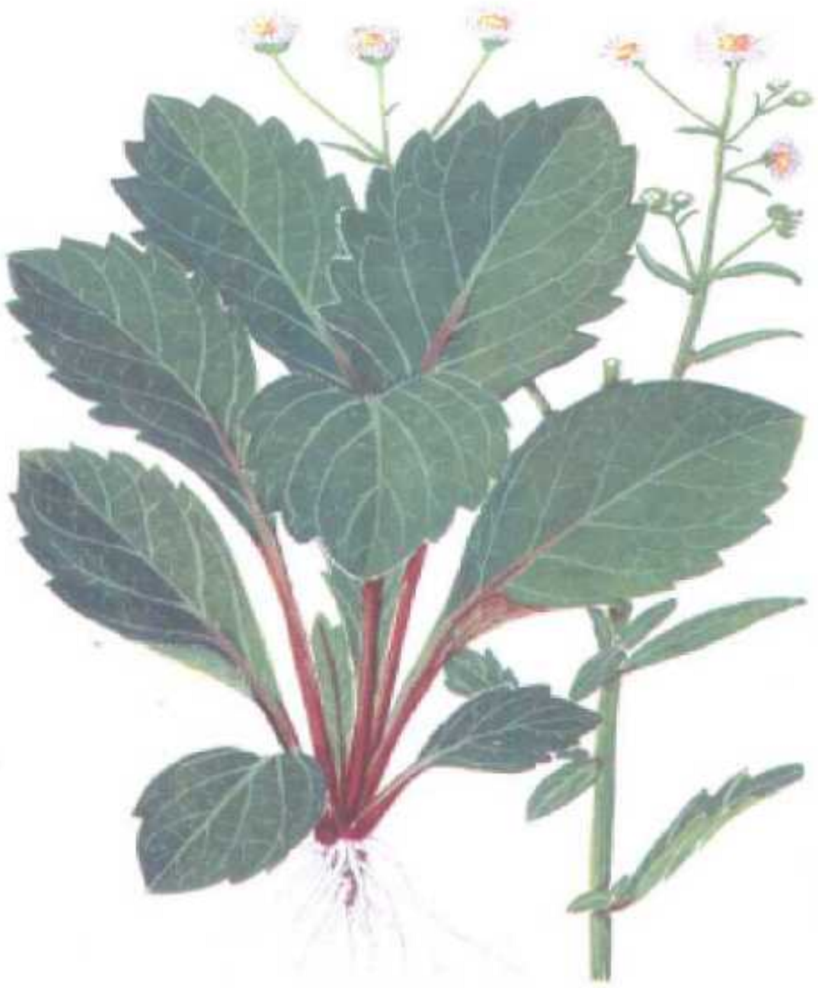
图 2 一年蓬