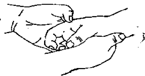
图2—3 测患者右手第二掌骨侧时的姿势

鸡卵状，肌肉自然放松，虎口朝上，食指尖与拇指尖相距约3cm。测试者用左手拇指尖在患者右手第二掌骨的拇指侧与第二掌骨平行处，紧靠第二掌骨且顺着第二掌骨长轴的方向轻轻来回按压即可觉有一浅凹长槽，第二掌骨侧的新穴即分布在此浅凹长槽内。逐穴按压时测试者左手拇指尖须按图2—3所示姿势，在图2—1或图2—2所示的穴位上向图2—1或图2—2的垂直于纸平面即垂直于浅凹长槽的方向施力按压，并略带以第二掌骨长轴为轴的顺时针方向旋转30°角的揉的动作。从而使指尖的着力点抵达以第二掌骨为脊柱位置的小人的内脏的位置。按照第二掌骨侧全息穴位群的分布图，在第二掌骨侧从头穴到足穴用拇指尖以大小适中且相等的压力顺序揉压一次（如果一次测试结果不明显可再重复揉压1~2次）。