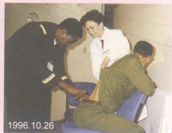
第三十一届国际军事医学大会