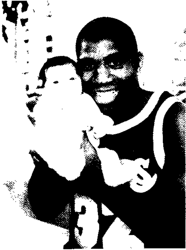
约翰逊与刚出生不久的儿子。