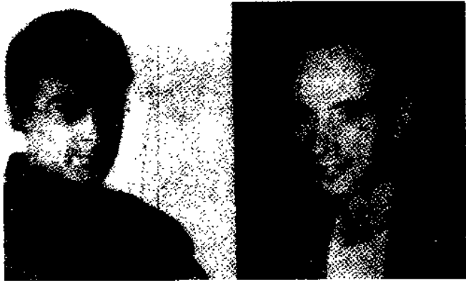
好莱坞影星雷沙奇患病前后判若两人。