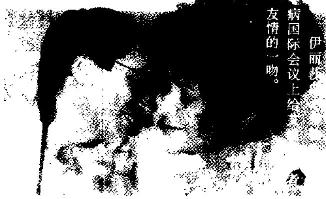
伊丽莎白在国际会议上给友情的一吻。