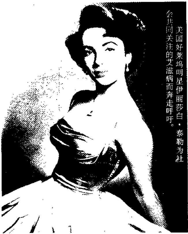
美国好莱坞明星伊丽莎白·泰勒为社会共同关注的艾滋病而奔走呼吁。