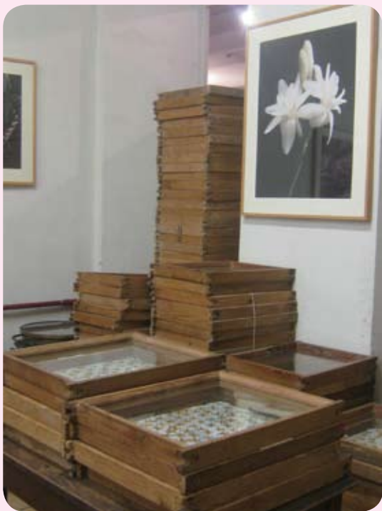
◆ 将花瓣平押在玻璃板内并涂满油脂，一层层的放，让油脂吸满花朵的香味精华，这就是脂吸法 (Enfleurage)