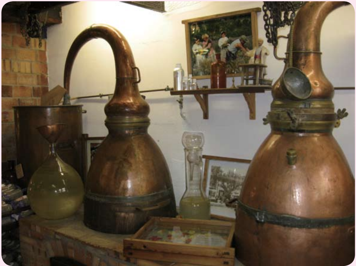
◆ 从油脂中萃取珍贵的花香精油

在装有植物油的玻璃瓶中并曝晒在阳光下数星期，使精油的味道被油脂吸收，待植物的味道被过滤出来，再加入更多的药草萃取。另一种方式则是在薄猪油上铺上一层鲜花，鲜花须每天覆盖上去直到达到所需浓度为止，然后加上酒精，当酒精蒸发后便将精油分离出来。法国南部的格拉斯是唯一还在使用此方法的地区。其精油价格非常高昂，所以会标上“Enfleurage absolute”。