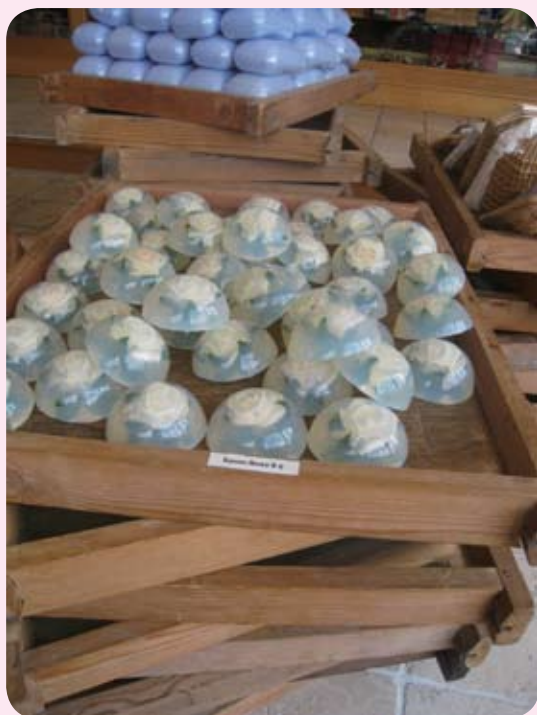
◆ 这个花香肥皂放在木格子上陈列的概念，就是取自古法脂吸法萃炼的花香精油

用油脂萃取精油是最古老的方式，它曾被广泛地用在香水工业上，以捕捉花朵的芬芳。将植物浸