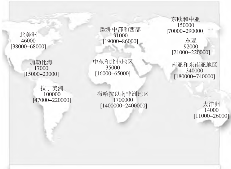
图 1-2 2007 年新增艾滋病感染者的地理分布