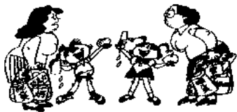
我的孩子怎么老长不胖