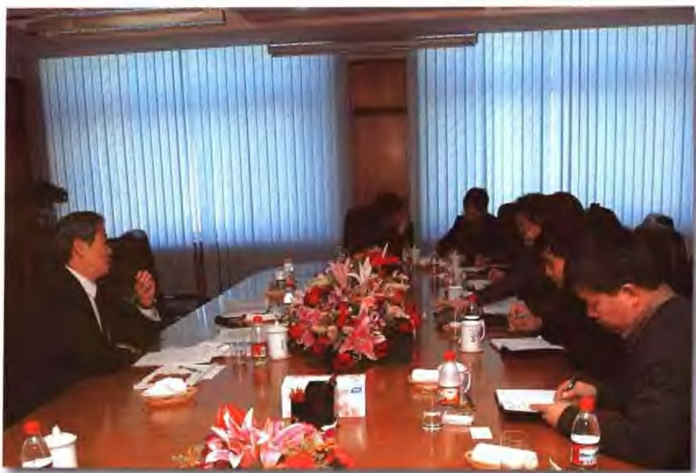
中国石油天然气集团公司总经理马富才接受新闻媒体采访。