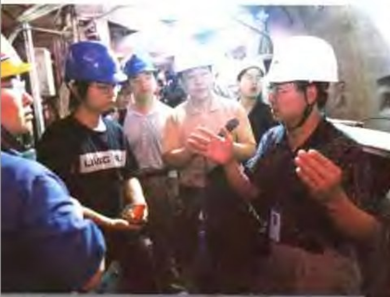
西气东输工程建设一直是媒体关注的焦点，在江淮、陕晋、甘宁、新疆西气东输工程建设的现场，随处可以见到媒体记者的身影。