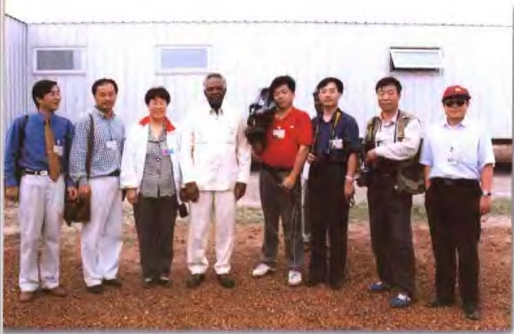
中国石油天然气集团公司大步向海外挺进。新华社、中央电视台等媒体对此进行了报道。图为记者采访完中油集团苏丹项目后，与苏丹的石油部长合影。