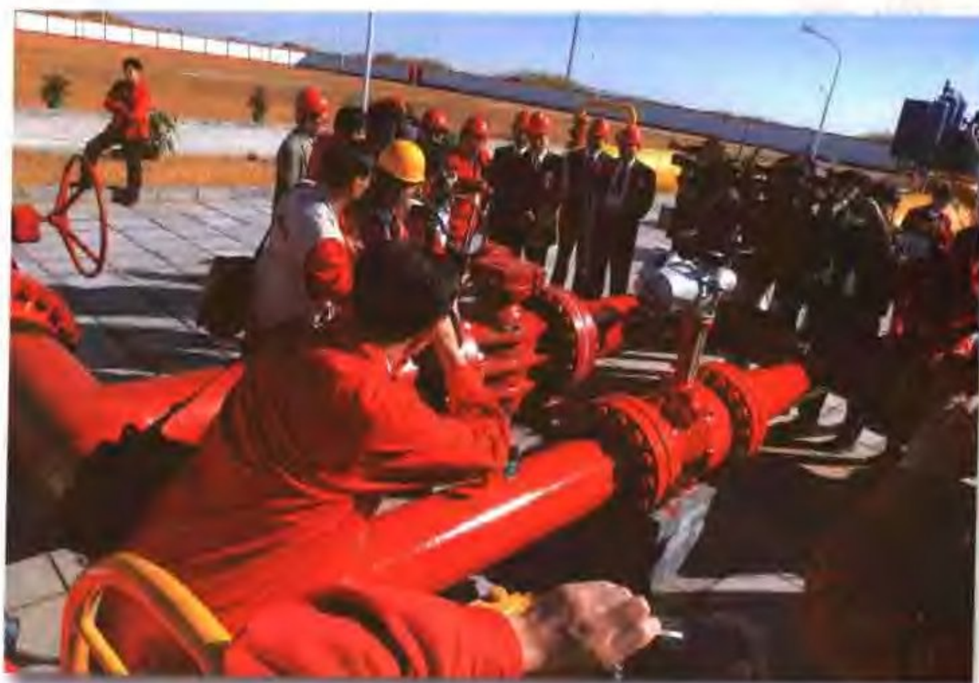
2003年10月10日，西气东输工程顺利完成第一阶段建设，各媒体记者聚集陕北靖边，关注靖边首先向上海输气的重要时刻。