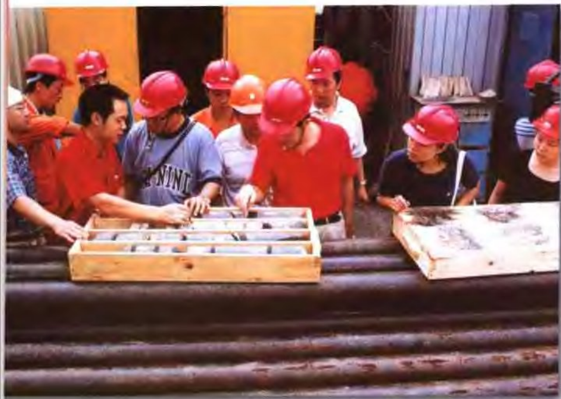
图为记者在采访四川气田时对各方面情况都感到新奇,不断向被访者刨根问底。