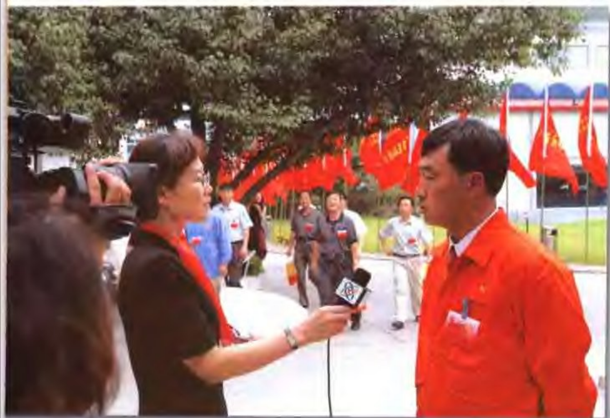
2003年中国石油天然气集团公司基层建设取得可喜成绩，中央电视台对此进行了报导。图为记者采访“百面红旗”代表。