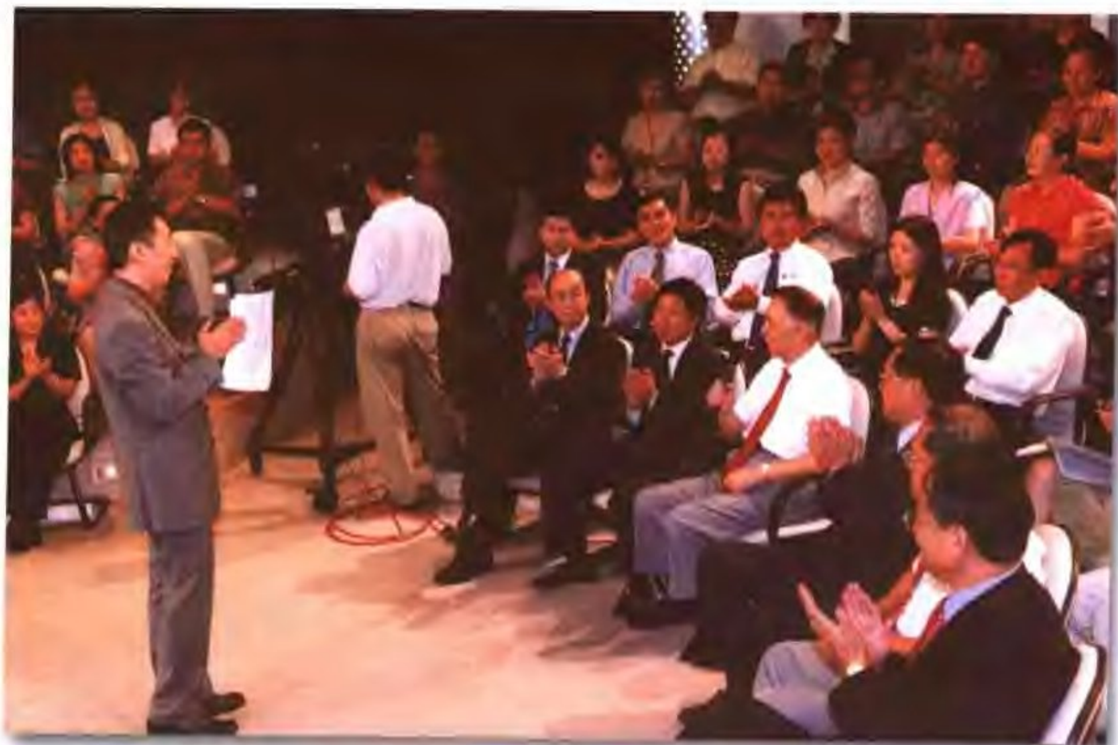
在中央电视台演播室，石油代表与《对话》节目主持人进行“对话”。