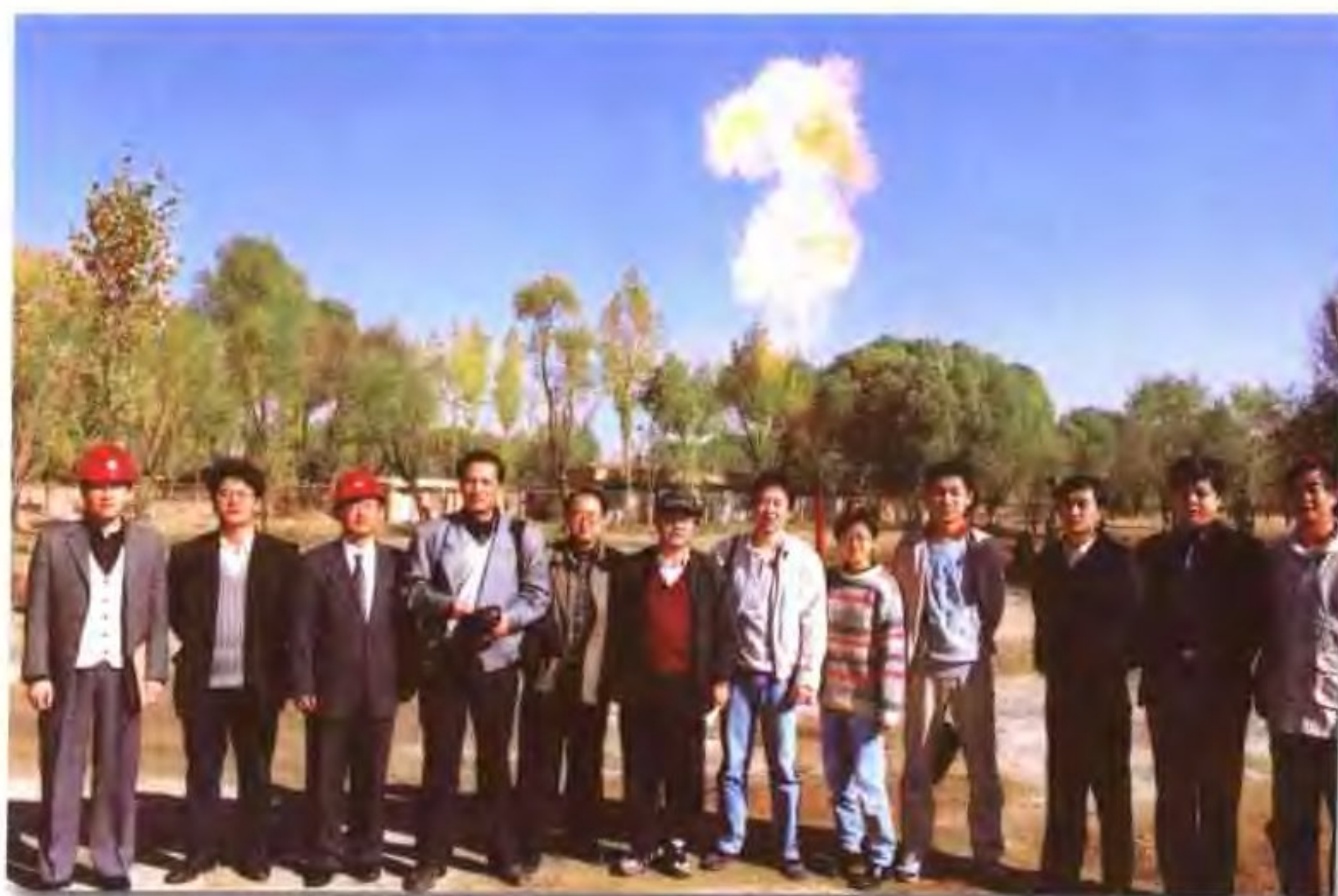
天然气是中国石油天然气集团公司一个重要经济增长点,媒体十分关注天然气勘探开发的情况,图为记者参观长庆气田的发现井——陕参1井。