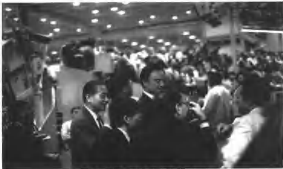
刘鸿儒在美国参观华尔街纽约证券交易所