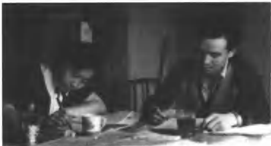
刘鸿儒与夫人在苏联留学

刘鸿儒，中国证监会第一任主席，被称为中国股市的拓荒牛。1992年至1995年的两年多里，刘鸿儒把握着中国股市的脉搏，而他的金融从业经历从上世纪50年代就开始了。1959年，刘鸿儒从莫斯科大学经济系毕业，获得副博士学位，回国后他被安排到中国人民银行工作。1980到1989年的十年间，刘鸿儒担任中国人民银行副行长，致力于中国的金融改革。