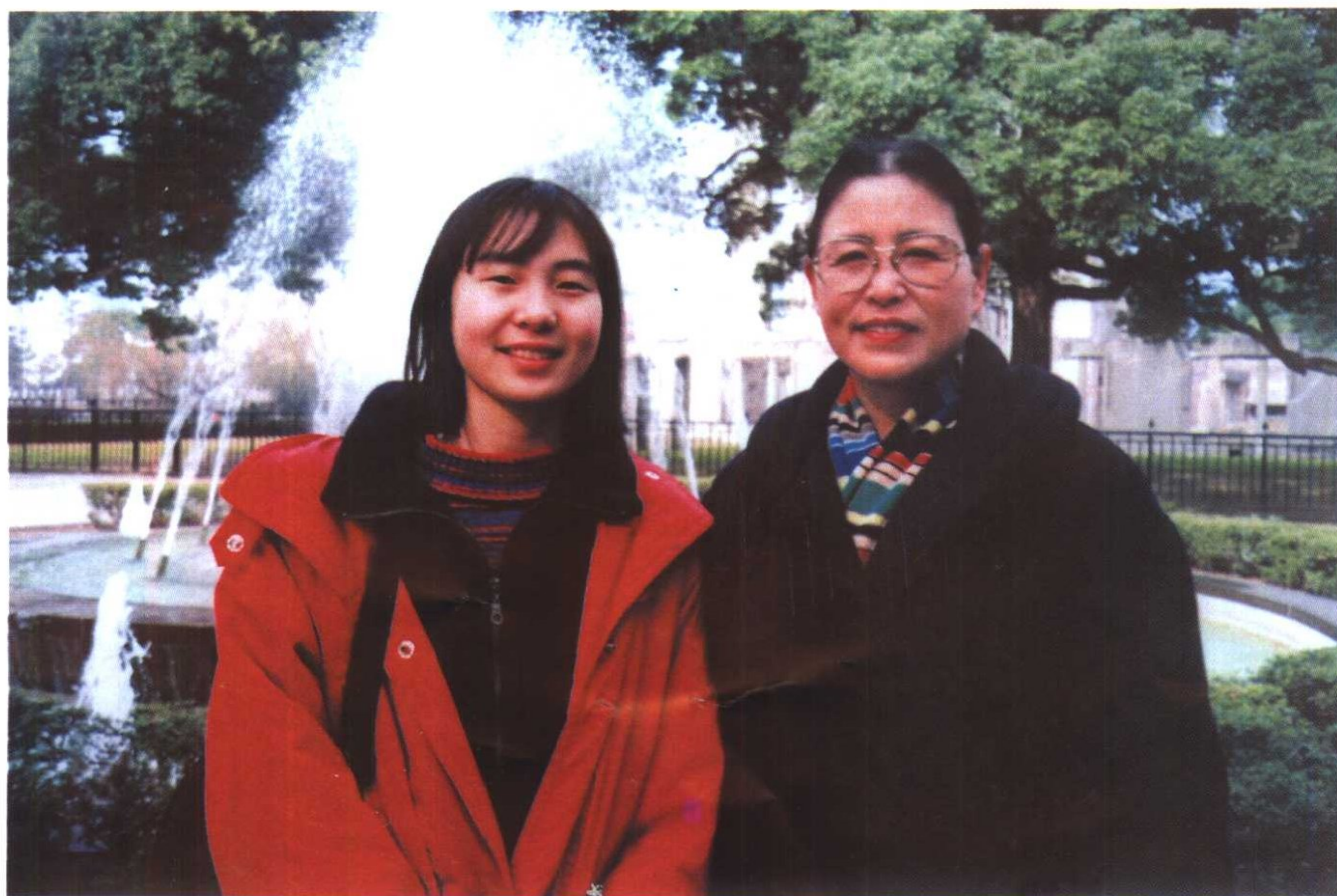
亲亲密密的母女俩。 (1998年于日本广岛)