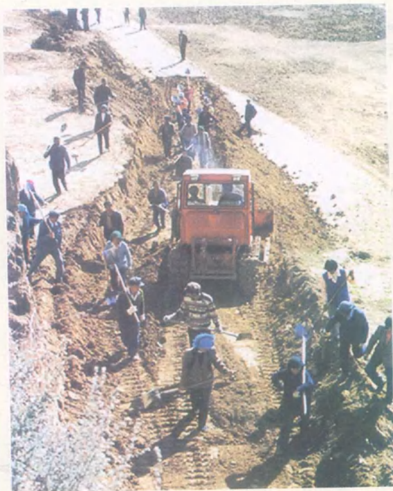
水洛镇李庄村修梯田现场