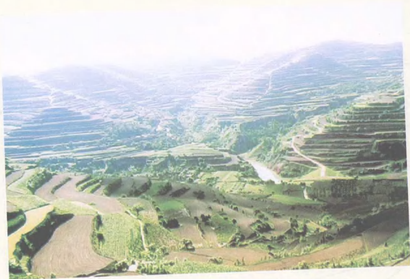
堡子沟流域综合治理