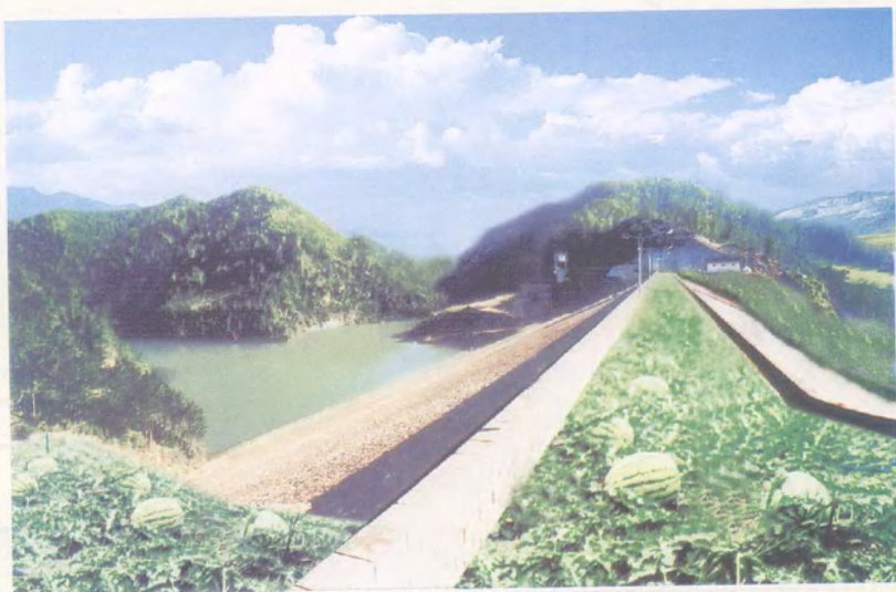
竹林寺国家级水利风景区