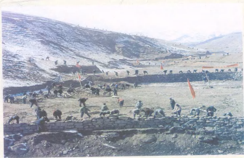
郑河乡上寨村梯田施工现场