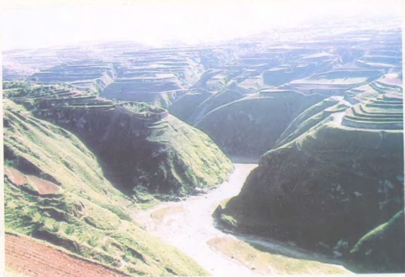
庄浪县葫芦河峡谷口梯田景观