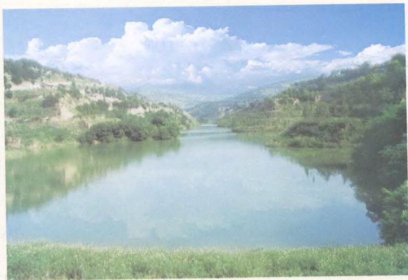
乱庄冶沟骨干坝生态景观