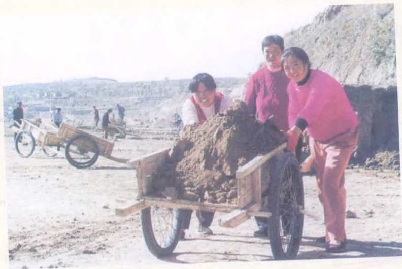
朱店镇高庙村梯田施工现场