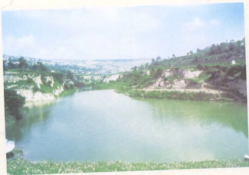
柳梁牛家沟淤地坝景观