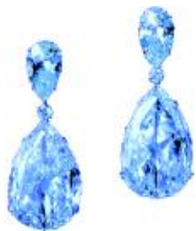
一桩异国婚姻、一次在拍卖会中创下的世界记录成全了“茵多尔”，让它成为世界名钻。