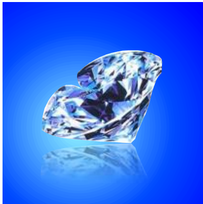
来自于古印度神像眼眶的钻石——“纳萨克”

纳萨克是印度马哈拉施特拉邦西部马拉他人聚居的一个市镇，马拉他人崇拜印度教中的湿婆神。在一座庙宇的湿婆神像眼中，就镶嵌了这粒巨大的金刚石“纳萨克”。那闪烁着光芒的眼睛，使以残暴毁灭著称的湿婆神看来更为栩栩如生。