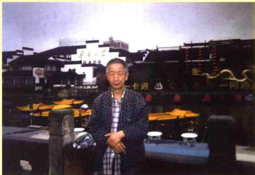
二〇〇二年六月摄于故乡南京夫子庙秦淮河畔