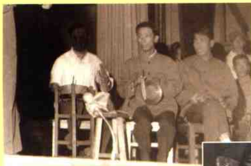
哈二十一中演出现代京剧，参加乐队伴奏(打小锣者为本书作者)