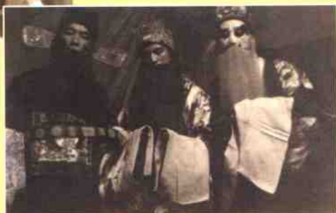
傍哈三中学生演出《将相和》，饰虞卿