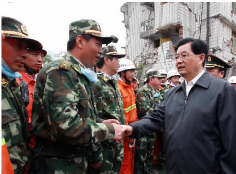
胡锦涛总书记在 5·12 汶川大地震抗震救灾第一线

赶往受灾严重的都江堰市，查看灾情，到一线指挥抢险。他对救援大军发出了掷地有声的命令：“千方百计进去！步行也要进去！时间越早越好，早一秒钟就可能救活一个人！”