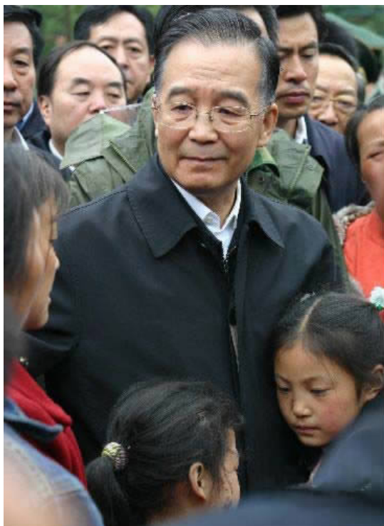
温家宝总理在 5·12 汶川大地震抗震救灾第一线

与民众一起流泪的，还有共和国的总理。人们忘不了，当看到那么多孩子和民众被废墟和泥石流掩埋，呼