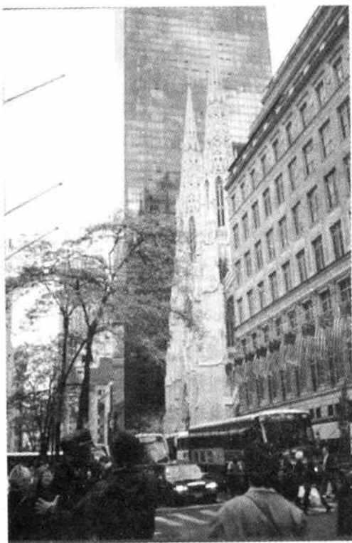
图 1-8 曼哈顿教堂

弹”，可畏而不可爱。还有人称他是一座座“巨型的钢筋混凝土板块”，“现代材料组成的巨型盒子，没有艺术价值”等等。