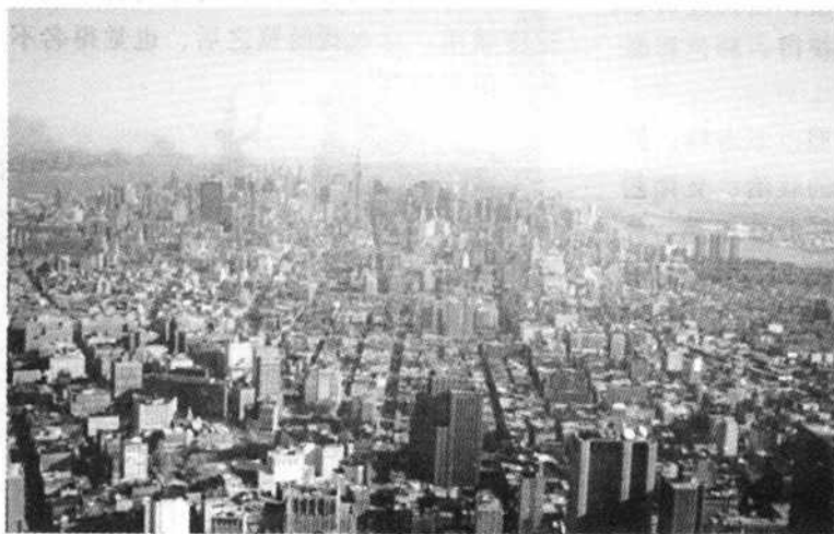
图 1-6 曼哈顿鸟瞰

插云霄。特别是世界贸易中心大楼，更是鹤立鸡群，独显其奇。它位于曼哈顿闹市区南端，是由 5 幢建筑物组成的综合体。其主楼呈双塔形，各高 412 米、110 层，1973 年建成。四周外墙全是玻璃，有“世界之窗”之称。负责设计的总建筑师是山崎实，原籍日本。大楼有 84 万平方米的办公面积，分租给世界各国 800 多个厂商，还设有为这些单位服务的贸易中心、情报中心和研究中心。在底层大厅及 44、78 两层高空门厅中，有种类齐全的商业性服务行业。第 107 层是瞭望厅，专供游人瞭望。我登上瞭望厅，眺望四周，参差不齐的高楼，尽收眼底。简直是一片茫茫无际的混凝土森林（图 1-6）。