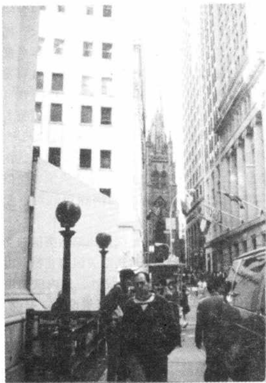
图 1-7 曼哈顿狭窄街道