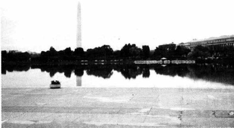
图 1-2 华盛顿纪念碑绿色广场

广场是一片碧绿的草坪，纵长约3500米，宽约200~500米。四周绿树葱茏，像一处绿色的海洋。在国会大厦和林肯纪念堂之间，耸立着一座高大的华盛顿纪念碑。它建于1885年，高约169米，是一座花岗岩砌筑的方尖形石碑，围绕碑基是50面星条旗。从造型上看，酷似一把高大的宝剑直刺天空；又像行将升入太空的火箭，屹立在广场之中。石碑中空，参观者可拾级而上，共898级；亦可乘电梯直登碑顶，居高眺望，有“一柱擎天，俯视万有”之概。广场雄伟，寥廓开朗。如遇晴空日丽，华盛顿的风光，也可尽收眼底（图1-2、图1-3、图1-4）。