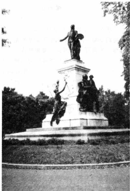
图 1-4 白宫大门外广场的雕像