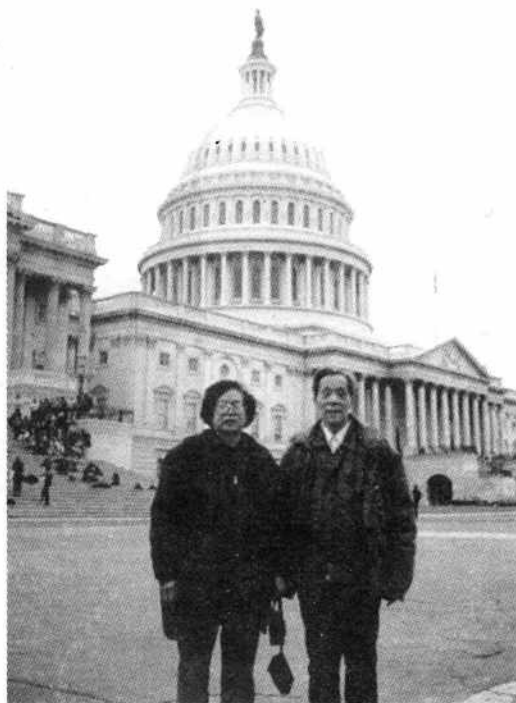
图 1-1 国会大厦前笔者与夫人合影

定把华盛顿分成从国会大厦向外辐射的四个扇面区域，即东北区、西北区、东南区和西南区。市区为一南北、东西成对角线的正四边形，布局匀称，空间疏朗，广场、公园、绿地、铜雕、塑像林立，波托马克河则像一条蓝色宽带，飘逸而过。华盛顿与其它大多数美国城市不同，没有摩天大楼，许多建筑物不超过 8 层。市中心是建立在全城最高点上的国会大厦，城市街道从这里向四周作辐射状展开。东西向马路分别用阿拉伯数字编号，而南北向马路则以英文字母命名。另有以美国最早的 13 个州州名命名的 13 条斜形大道，与这些棋盘式的马路相交叉。国会正面，有两条斜形大道向西北和西南方向延伸，前者为宾夕法尼亚大街，与白宫相连接。国会南北，又分别有独立大道和宪法大道直抵波托马克河畔。这一带是美国首都的核心所在，是首脑机关集中地。它的规划，既有方格式又有放射式的街道，形成纵横与放射交织的格局（图 1-1）。