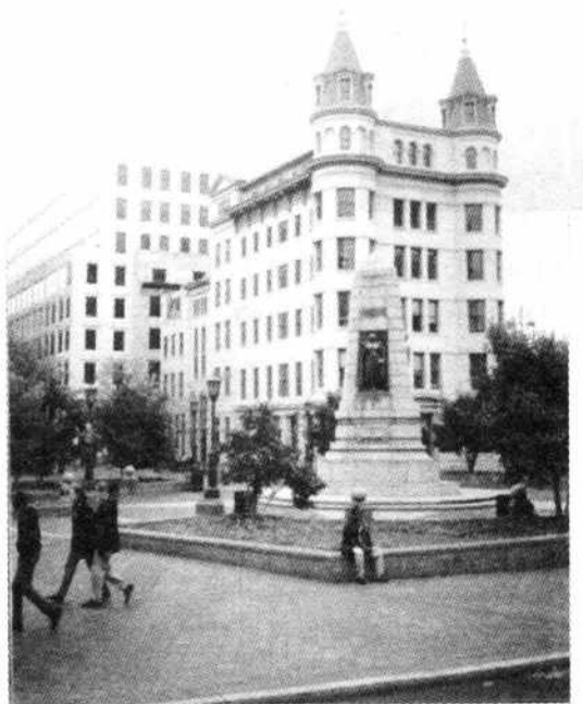
图1-5 华盛顿街道之一角

这些建筑并不高大，造型也不奇特；但设计和建造精致，具有浓郁的政治、文化艺术氛围（图1-5）。