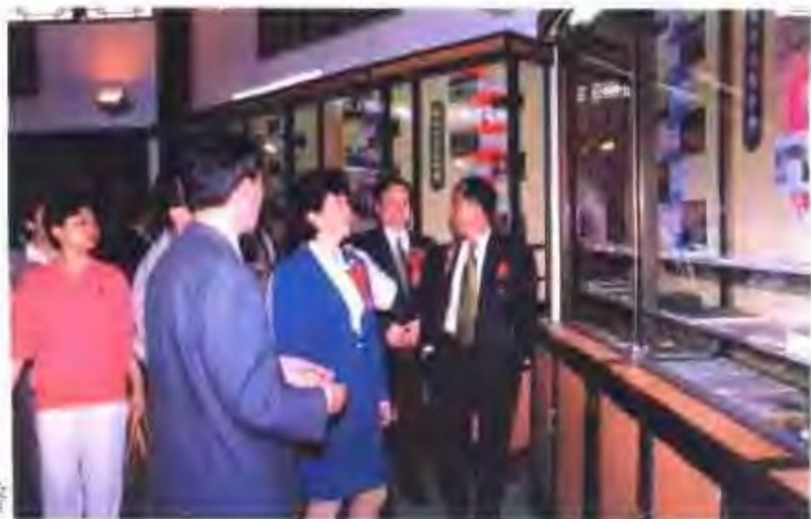
漳州灯谜艺术馆展厅一瞥