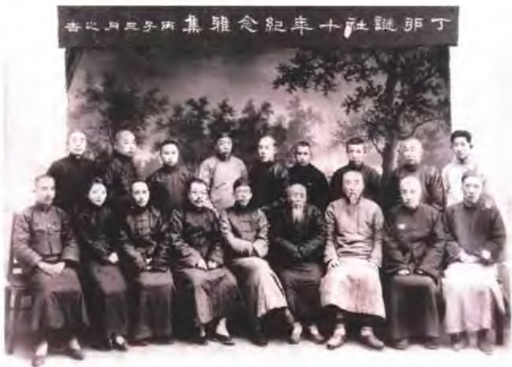
民国年间北平丁卯谜社社员合影