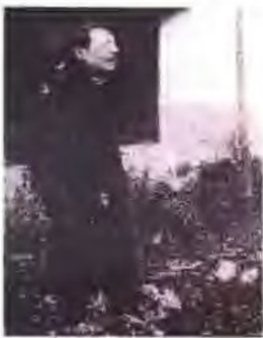
民初竹西谜家吉亮工像