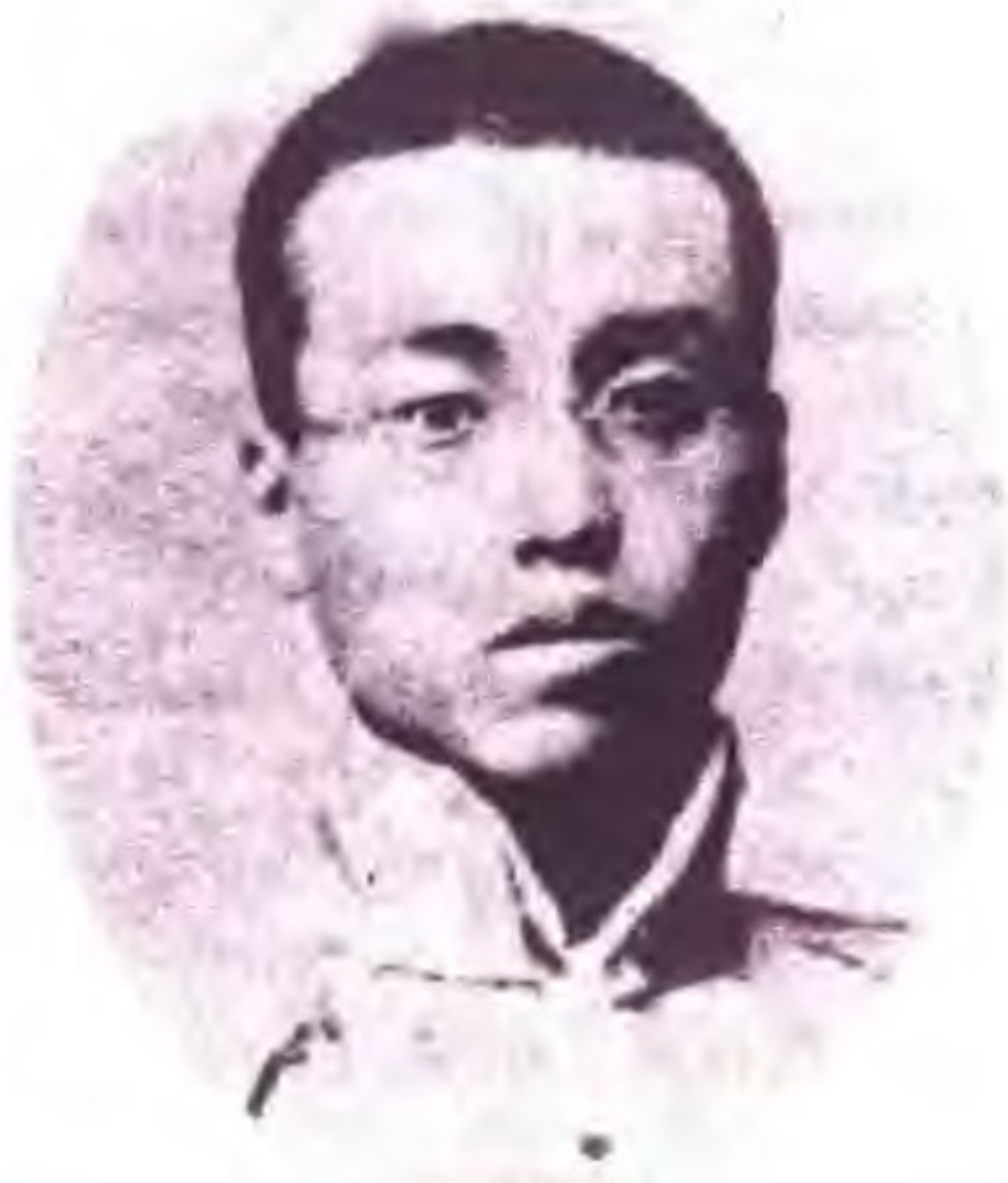
民国年间谜家徐枕亚小影