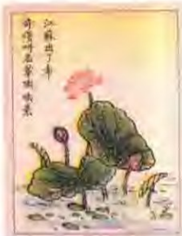
民国年间绘有谜语的香烟牌子