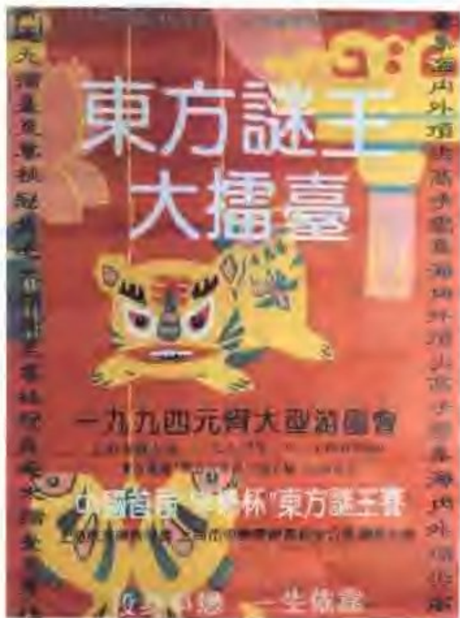
曾轰动上海的“东方谜王赛”海报