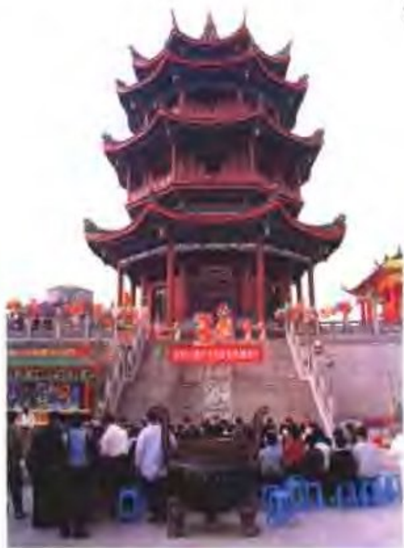
福建漳州灯谜艺术馆建于威镇阁内