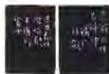
以写梅花诗谜闻名的吴让之印作