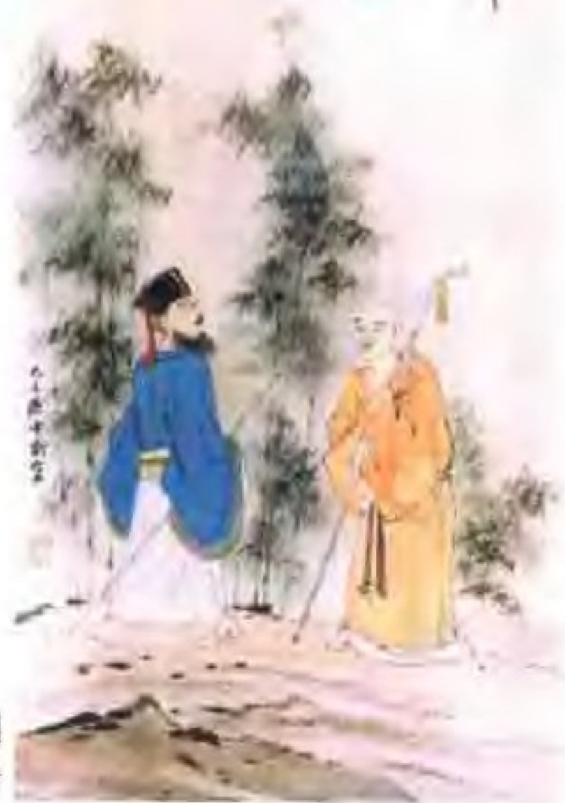
东坡佛印商谜图 孙仲威 作画 苏渊雷 题字 陈以鸿 赋诗

东坡佛印 商谜图 苏渊雷 二老高僧事有共什师妙 语曾教麻好碍于字文十 说换取情神一福图 己巳夏秋陈以鸿