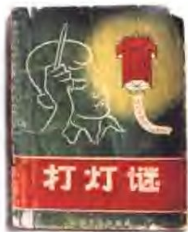
沾溉一代谜人的《打灯谜》 （作者余真）