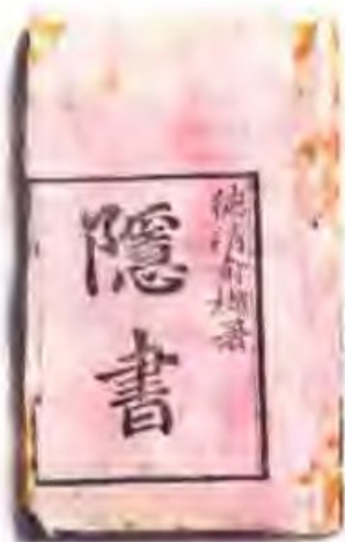
清代经学大师俞曲园的 灯谜专著《隱書》