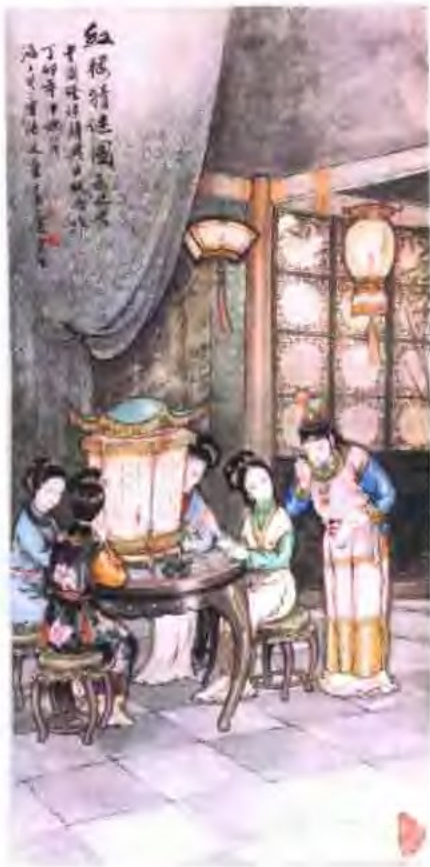
红楼猜谜图 陆敏（无尘）绘

东坡佛印 商谜图 苏渊雷 二老高僧事有共什师妙 语曾教麻好碍于字文十 说换取情神一福图 己巳夏秋陈以鸿