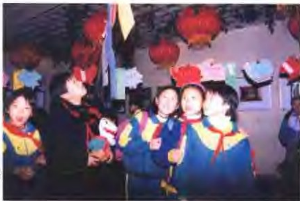
娃娃谁个不爱谜——上海南市区少年宫谜会一角