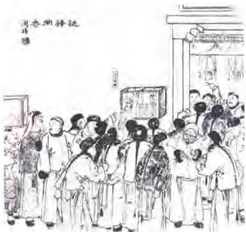
晚清周慕桥绘《谜语同参》图