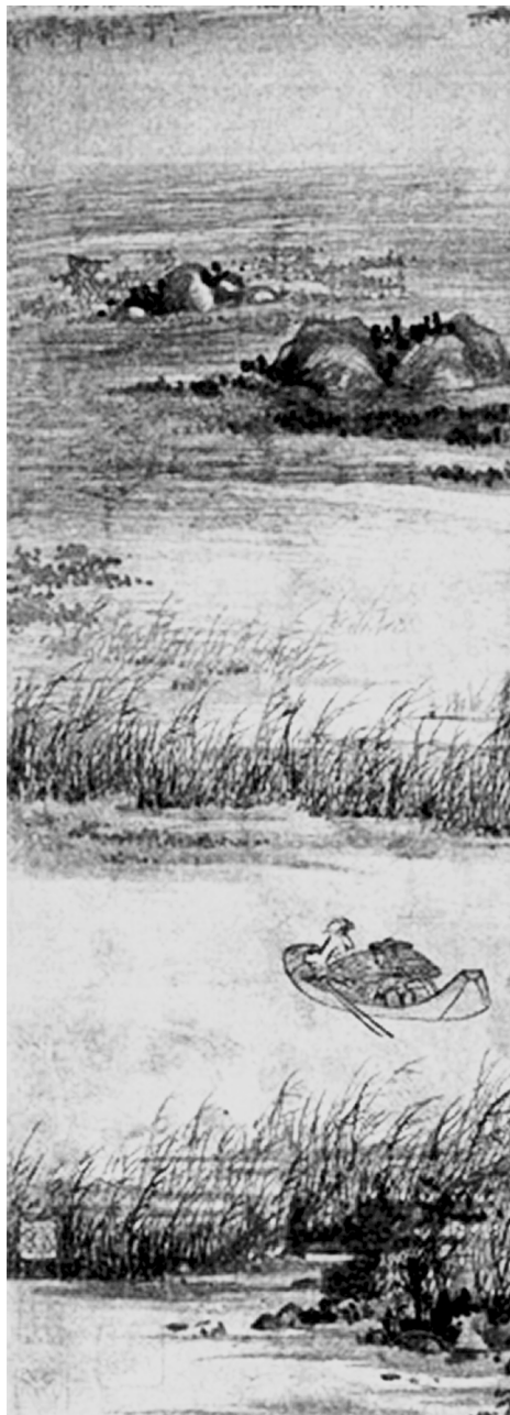
《芦花寒雁图》(元吴镇)