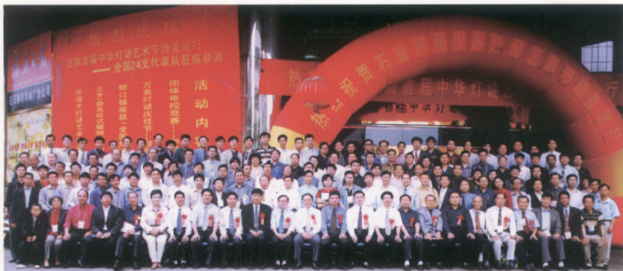
石獅首屆中華燈謎藝術節2001年5月舉辦。