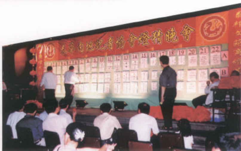
泰國舉辦“泰華內地記者協會燈猜晚會”。