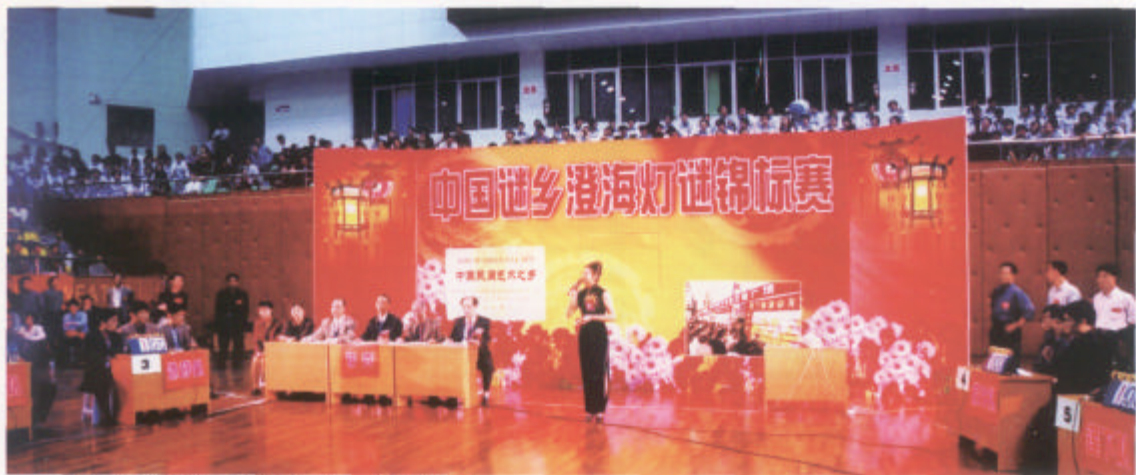
中国灯谜艺术之乡澄海举办灯谜锦标赛。