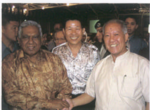
新加坡总统丹纳（左）会见中华灯谜学术委员会主任郑百川（右）。