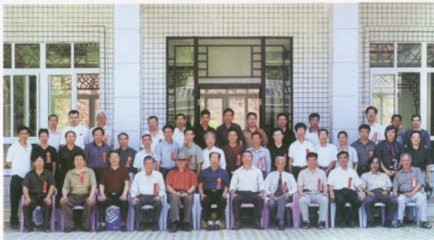
'04潮州市移动绿城国际休闲谜会2004年9月在潮州举办。