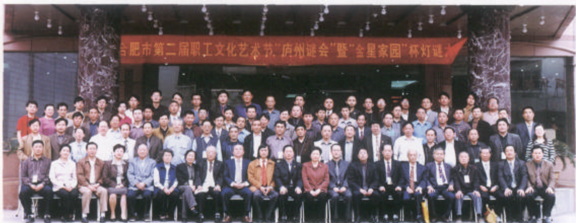
合肥市第二届职工文化艺术节“庐州谜会”暨“金星家园”杯灯谜大赛2004年4月在合肥举办。