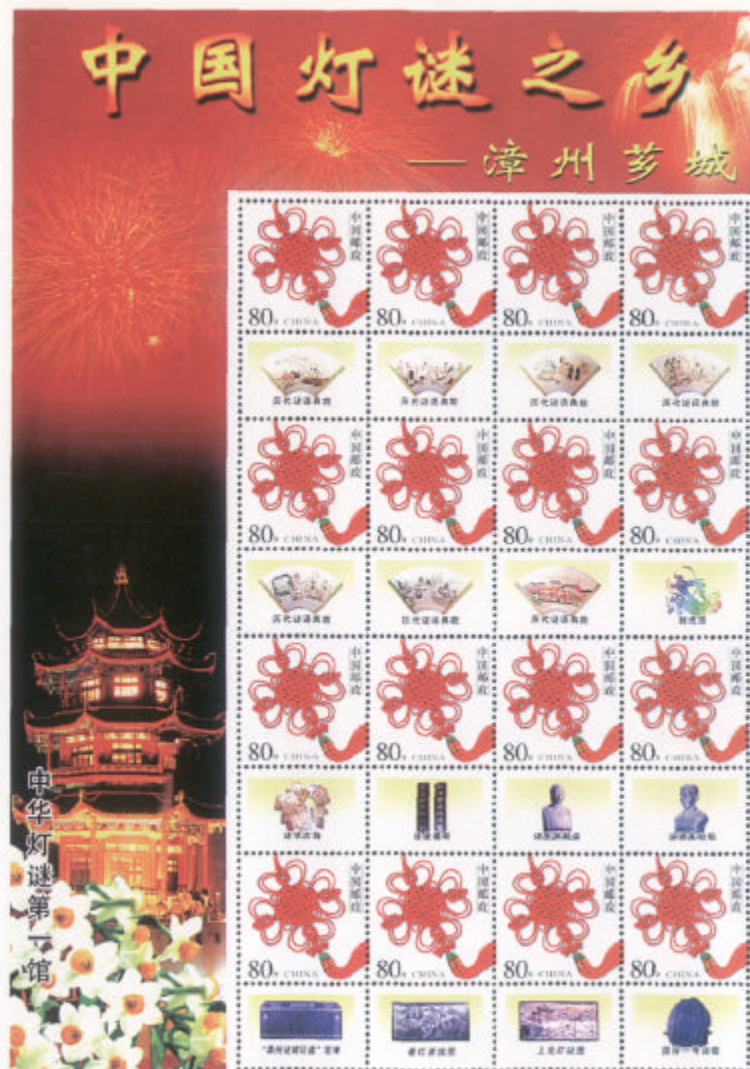
福建省第六届灯谜艺术节暨海峡两岸（漳州）谜艺研讨会发行纪念邮票。