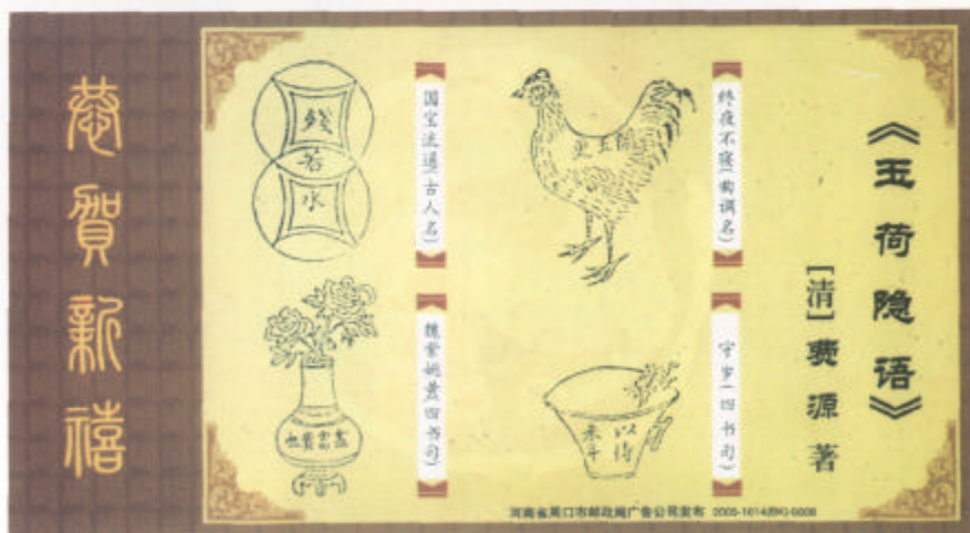
河南省周口市邮政局广告公司发布的灯谜“中国邮政贺年有奖明信片”。