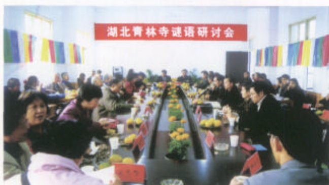
中国民间文艺家协会、湖北省民间文艺家协会召开湖北青林寺谜语研讨会。