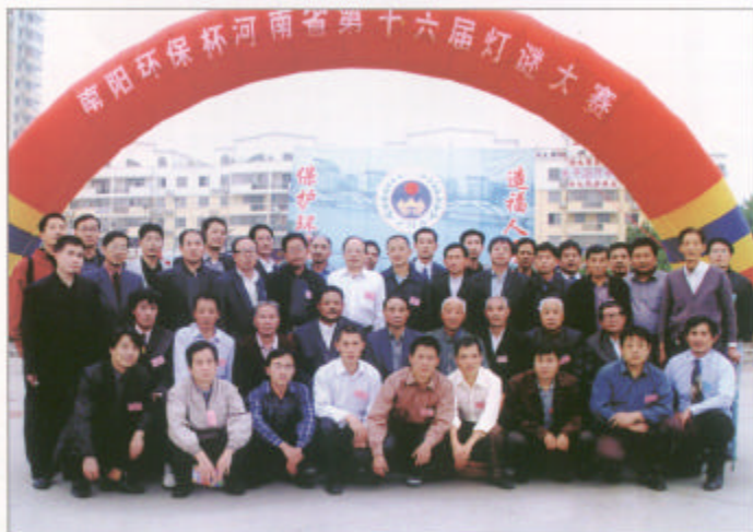
南阳环保杯河南省第十六届灯谜大赛在2003年10月在南阳举办。