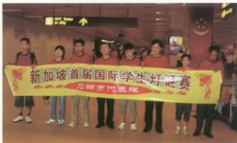
石獅代表隊參加新加坡首屆國際學生燈謎賽。