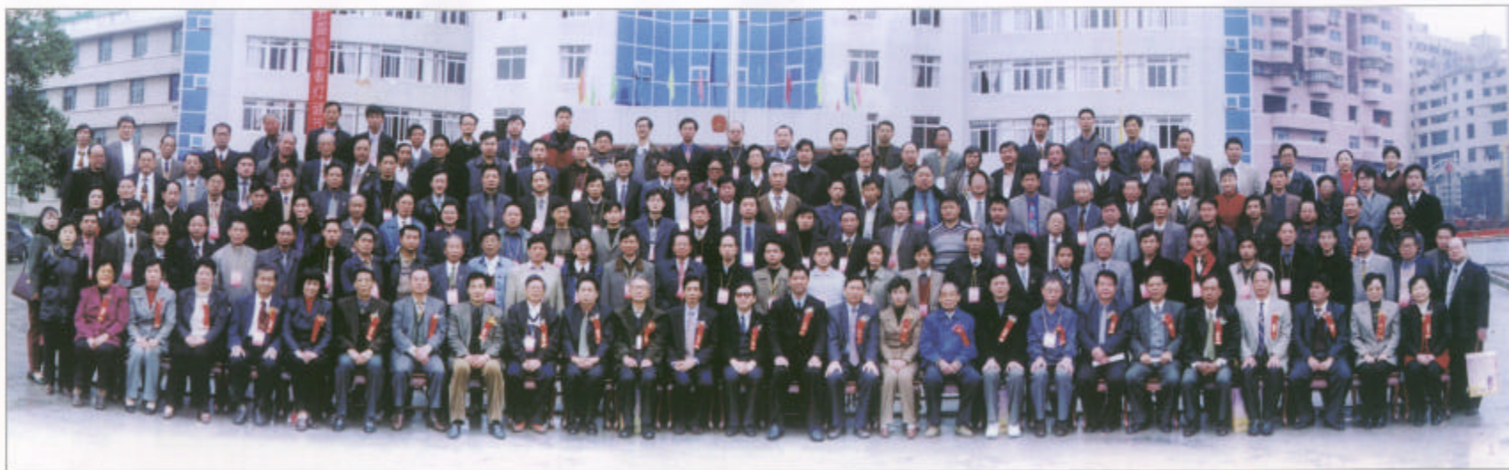
第五届福建省灯谜节暨第三届漳州中华灯谜艺术节2000年2月在漳州举办。