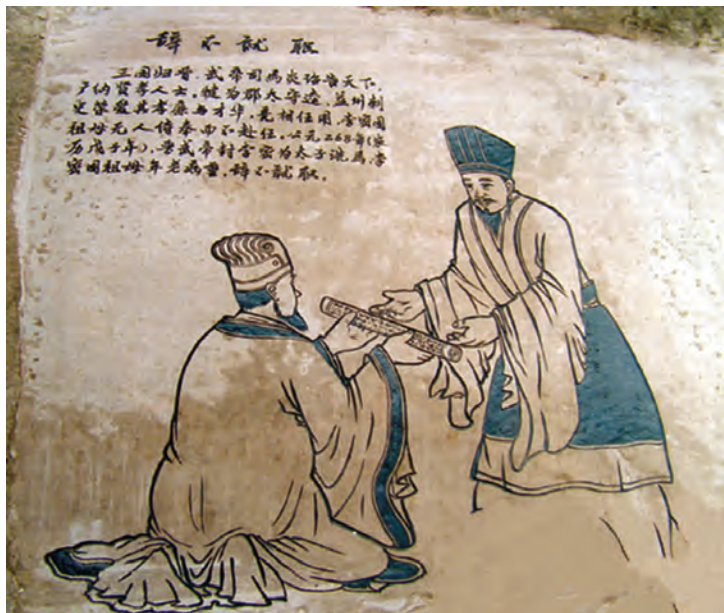
▲李密故里表现李密辞不就职的壁画

我想圣朝是以孝道来治理天下的，凡是故臣遗老，皆受到怜惜抚育，何况像臣这样特别孤苦，尤其可怜之人呢。如今祖母刘氏已日薄西山，气息微弱将绝，生命危在旦夕。我如果没有祖母抚养，就不可能活到今天，