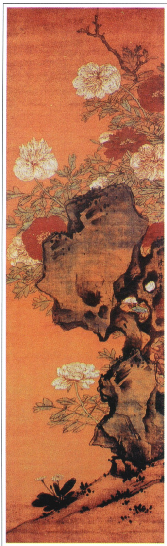
[明] 孙林 奇石牡丹图