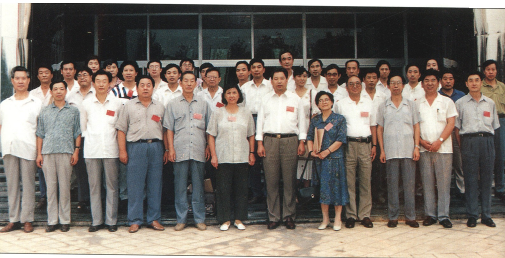
出席全国牡丹争评国花联席会议代表合影。