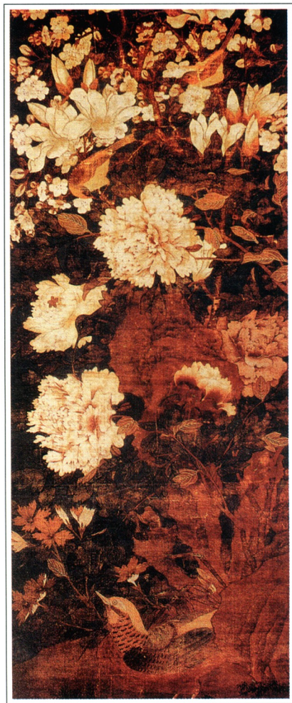
[五代] 徐熙 玉堂富贵图