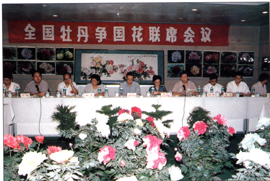
1994年8月，河南、山东、山西、陕西、甘肃、四川、湖北、广东、上海、北京十省市代表出席在洛阳召开的全国牡丹争评国花联席会议。图为用牡丹花照片装饰的会场。