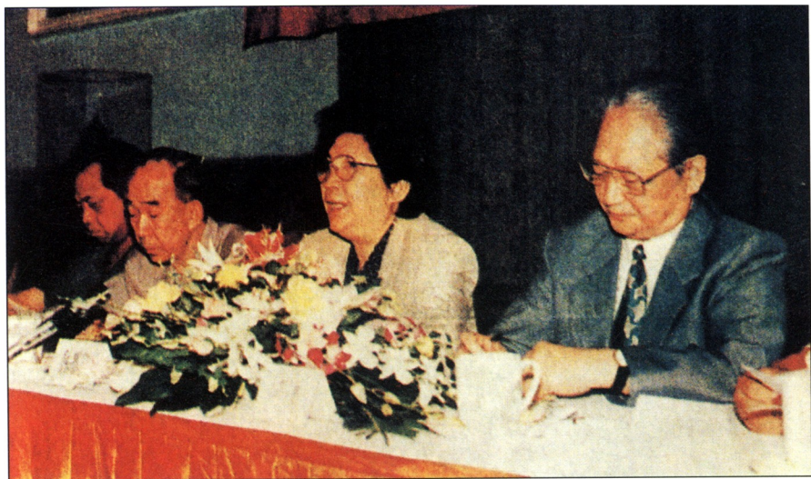
1994年9月2日，全国评选国花在人民大会堂举行第一次新闻发布会，陈慕华发表重要讲话。