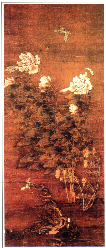
[南宋] 佚名 风蝶牡丹图