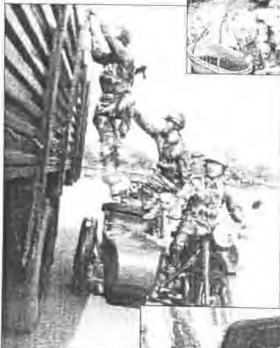
◀ 千钧一发，飞车擒敌