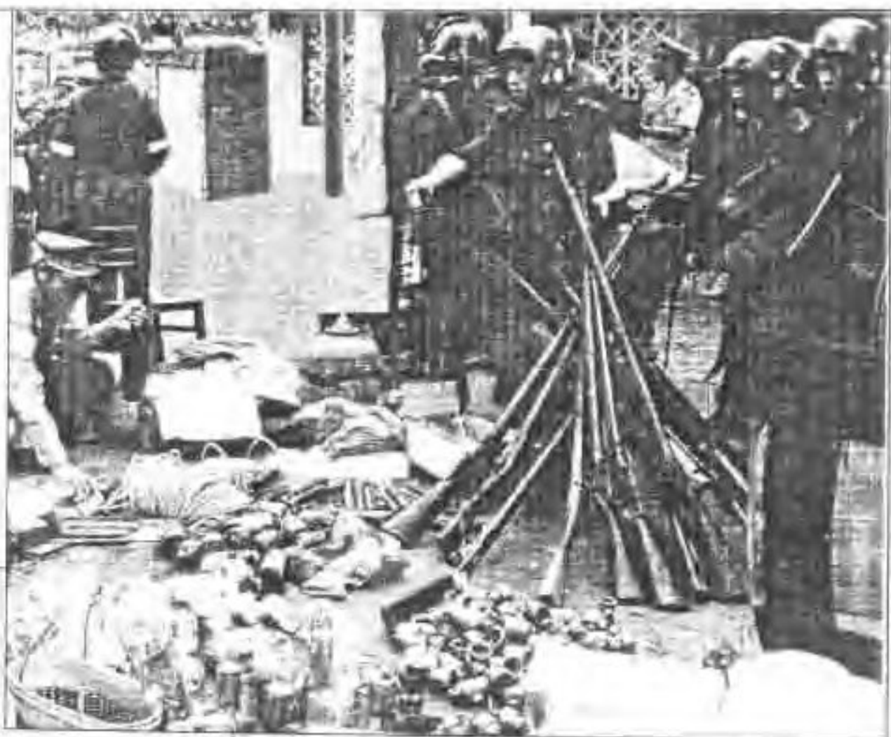
▲ 缴获武装歹徒的枪枝弹药