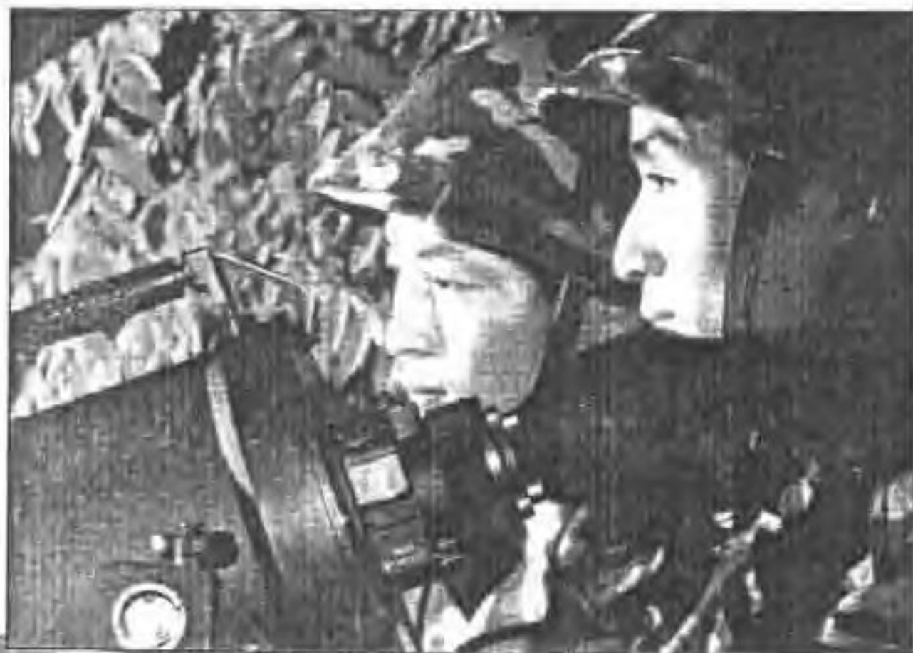
▶ 用夜视仪监视目标。