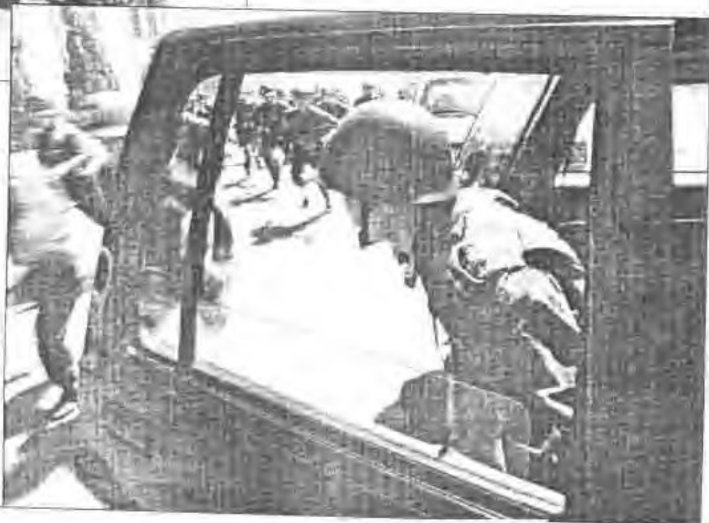
▶ 一声令下，紧急出动