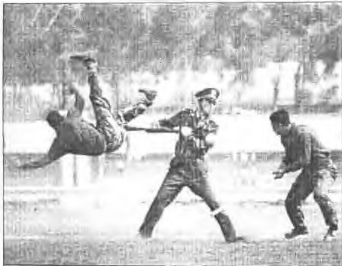
◀ 神勇武警招招制敌。