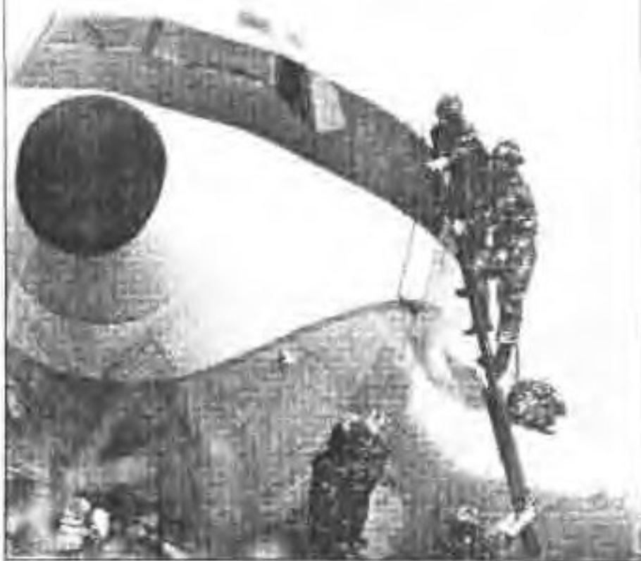
▶ 女子特警队员围歼逃犯， 抵近射击。