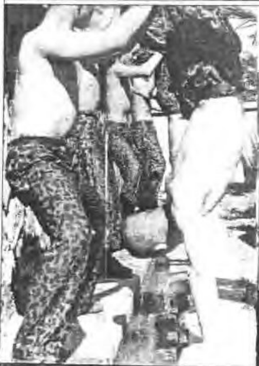
◀ 基本功训练——倒立—立 就是几小时。