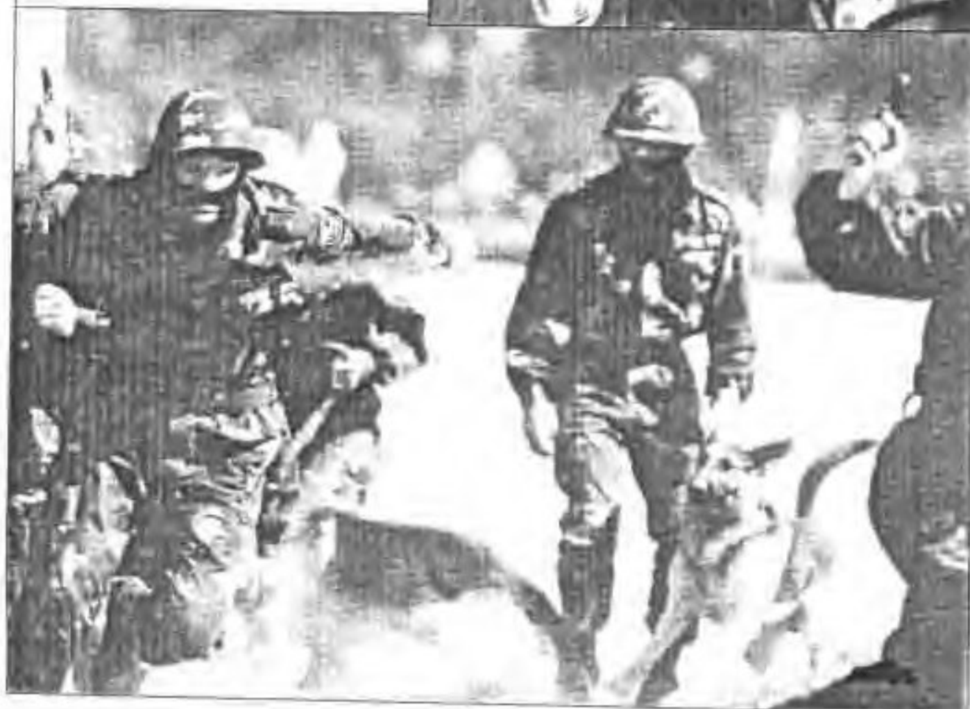
▶ 利用警犬追捕逃犯。