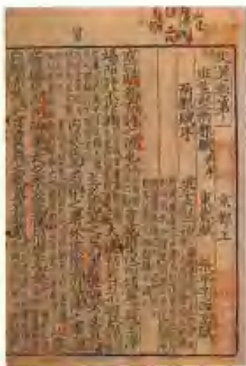
图二 宋绍兴三十一年(1161) 建阳崇化书坊陈八郎宅刊本 五臣注单行本《文选》

目录学所谓“集部”，既不等于萧绎所说的“文”之专集，更不等于今之所谓文学专集。一方面，集部书里收入了许多应用文，其中有的属于文学，有的不属于文学，应当视具体情况而定。另一方面，小说、戏曲这两种体裁，今人视为文学中不可缺少的部分，而在古代却不入集部。小说中的文言小说，或入史部或入子部。白话小说和戏曲，传统目录学家则基本上不予著录。