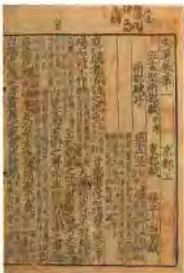
图二 宋绍兴三十一年(1161) 建阳崇化书坊陈八部宅刊本 五臣注单行本《文选》

目录学所谓“集部”，既不等于萧绎所说的“文”之专集，更不等于今之所谓文学专集。一方面，集部书里收入了许多应用文，其中有的属于文学，有的不属于文学，应当视具体情况而定。另一方面，小说、戏曲这两种体裁，今人视为文学中不可缺少的部分，而在古代却不入集部。小说中的文言小说，或入史部或入子部。白话小说和戏曲，传统目录学家则基本上不予著录。